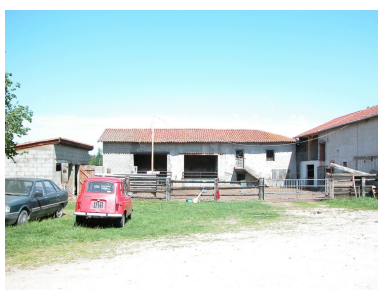
Vue d'ensemble depuis le sud. IVR82_20134201653NUCA