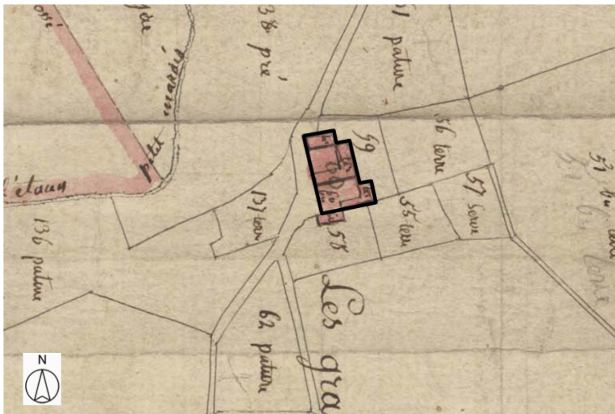
Plan de situation, d'après le cadastre de 1809, section A, échelle originale 1:5000 Plan cadastral, dit cadastre napoléonien Dessin au crayon, plume et lavis d'encres colorées sur papier, 1809. AD Loire. 3P-1682VT