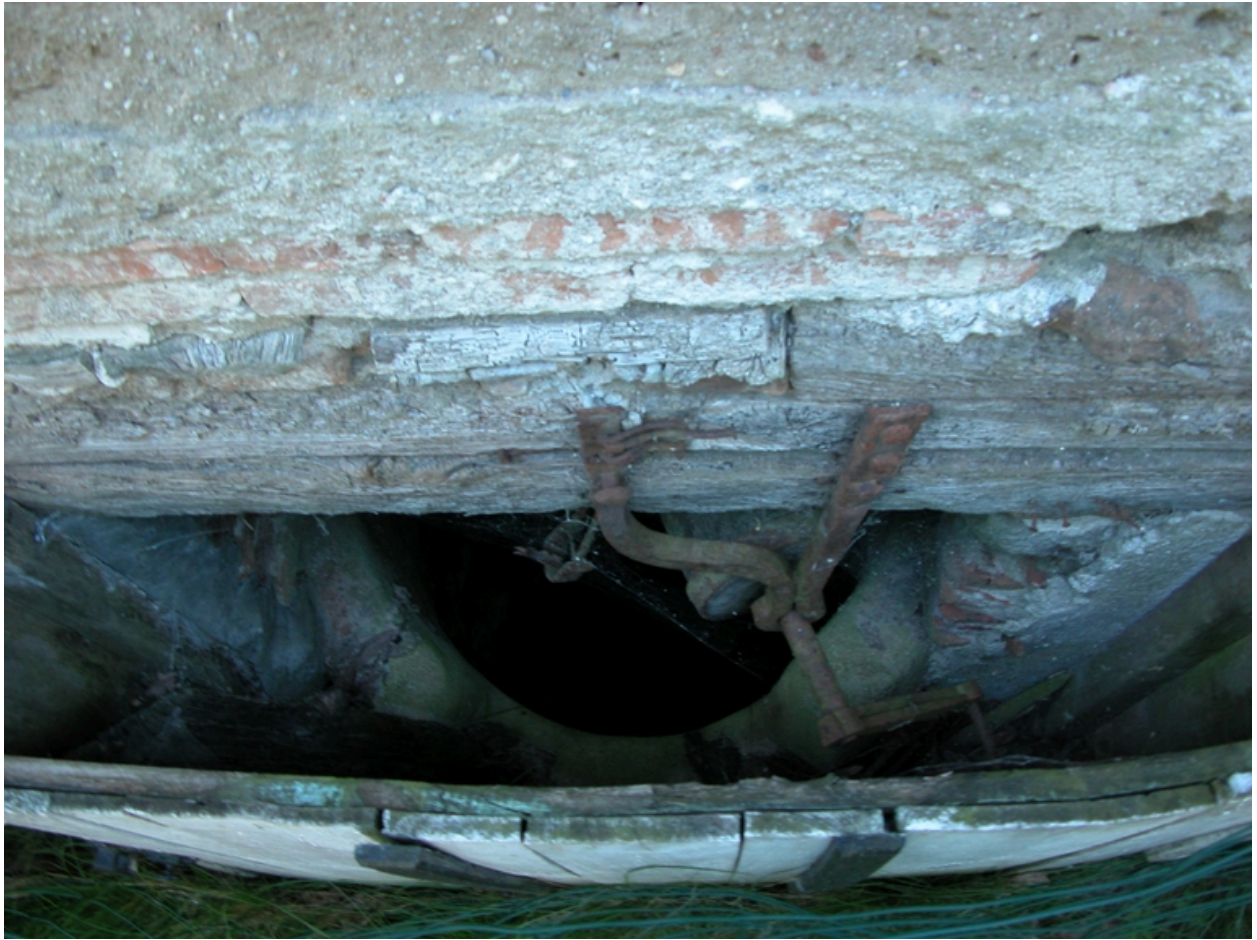
Vue intérieure du puits.