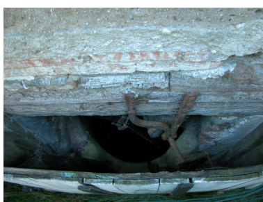
Vue intérieure du puits.