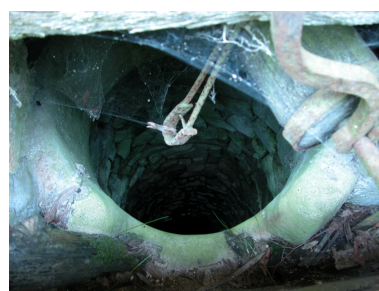
Vue intérieure du puits.