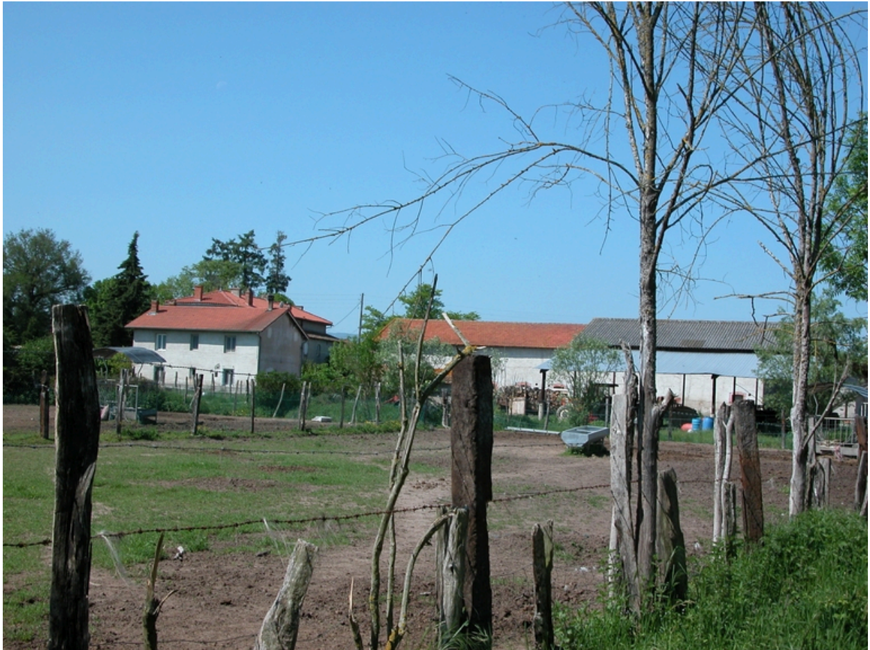
Vue générale depuis l'est.