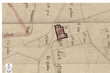
Plan de situation, d'après le cadastre de 1809, section A, échelle originale 1:5000 Plan cadastral, dit cadastre napoléonien Dessin au crayon,