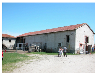
Vue d'ensemble depuis le sud-ouest. IVR82_20134201652NUCA