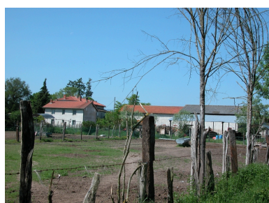
Vue générale depuis l'est.