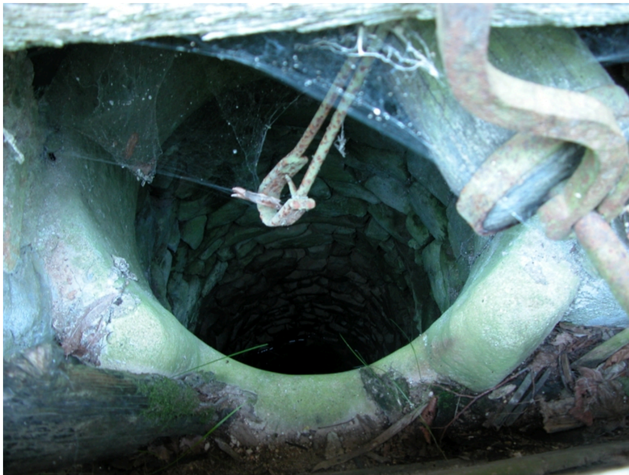
Vue intérieure du puits.