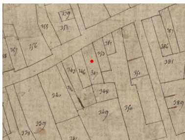
Extrait du plan cadastral de 1809, parcelle E 347.