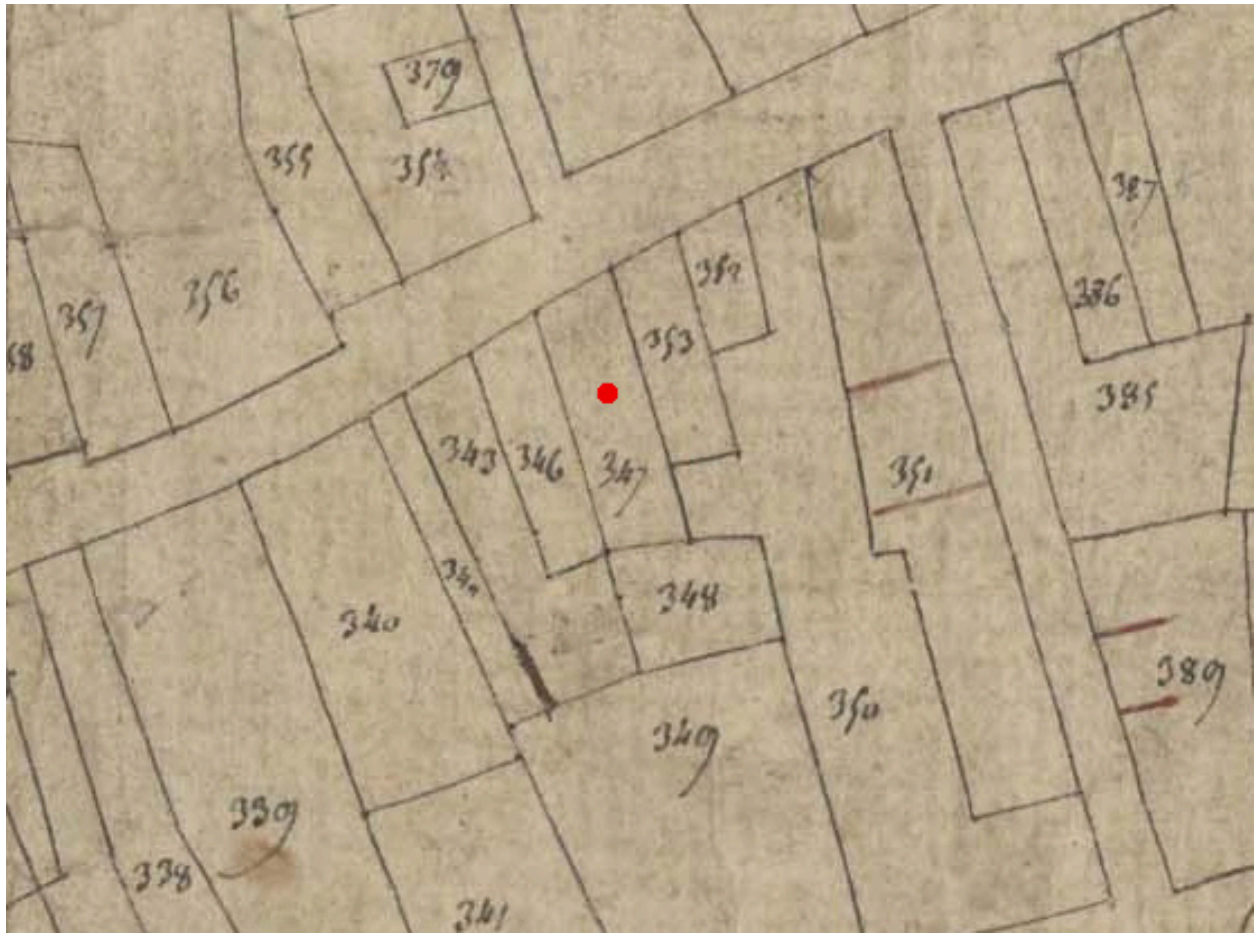
Extrait du plan cadastral de 1809, parcelle E 347.