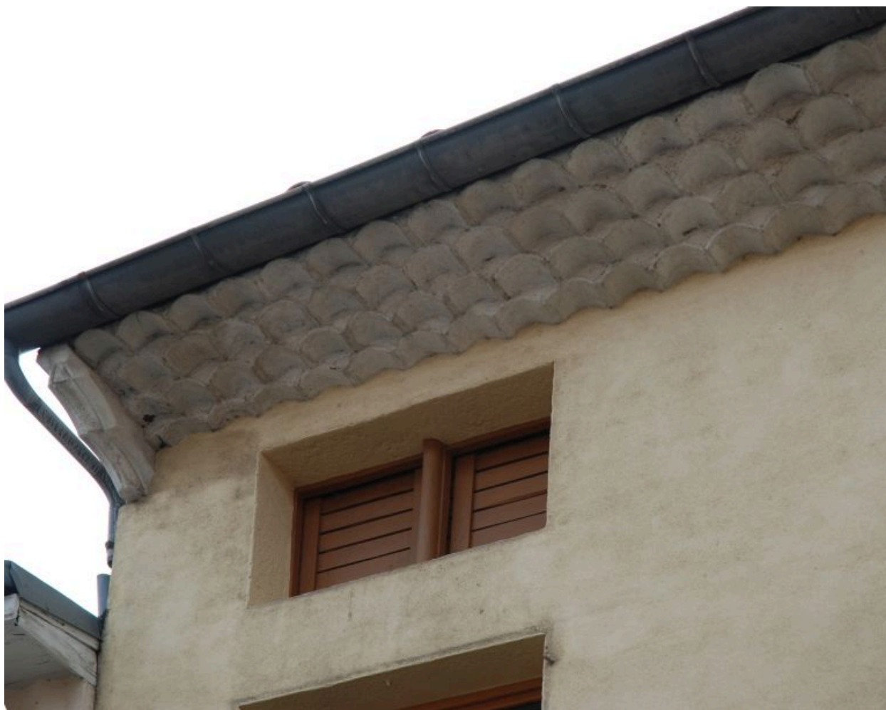
Détail de l'étage en surcroît : baie avec meneau de bois, avant-toit soutenu par des consoles et fermé par une génoise.