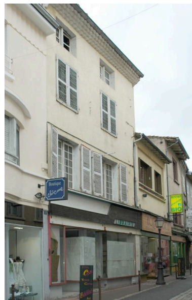
Vue générale. IVR82_20124202669NUCA