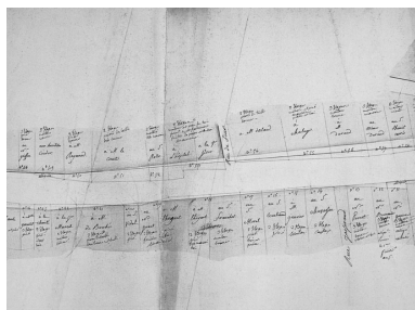
Extrait du plan de la Traversée de Montbrison en 1780, maison n° 18 Grande Rue. plan de 1780