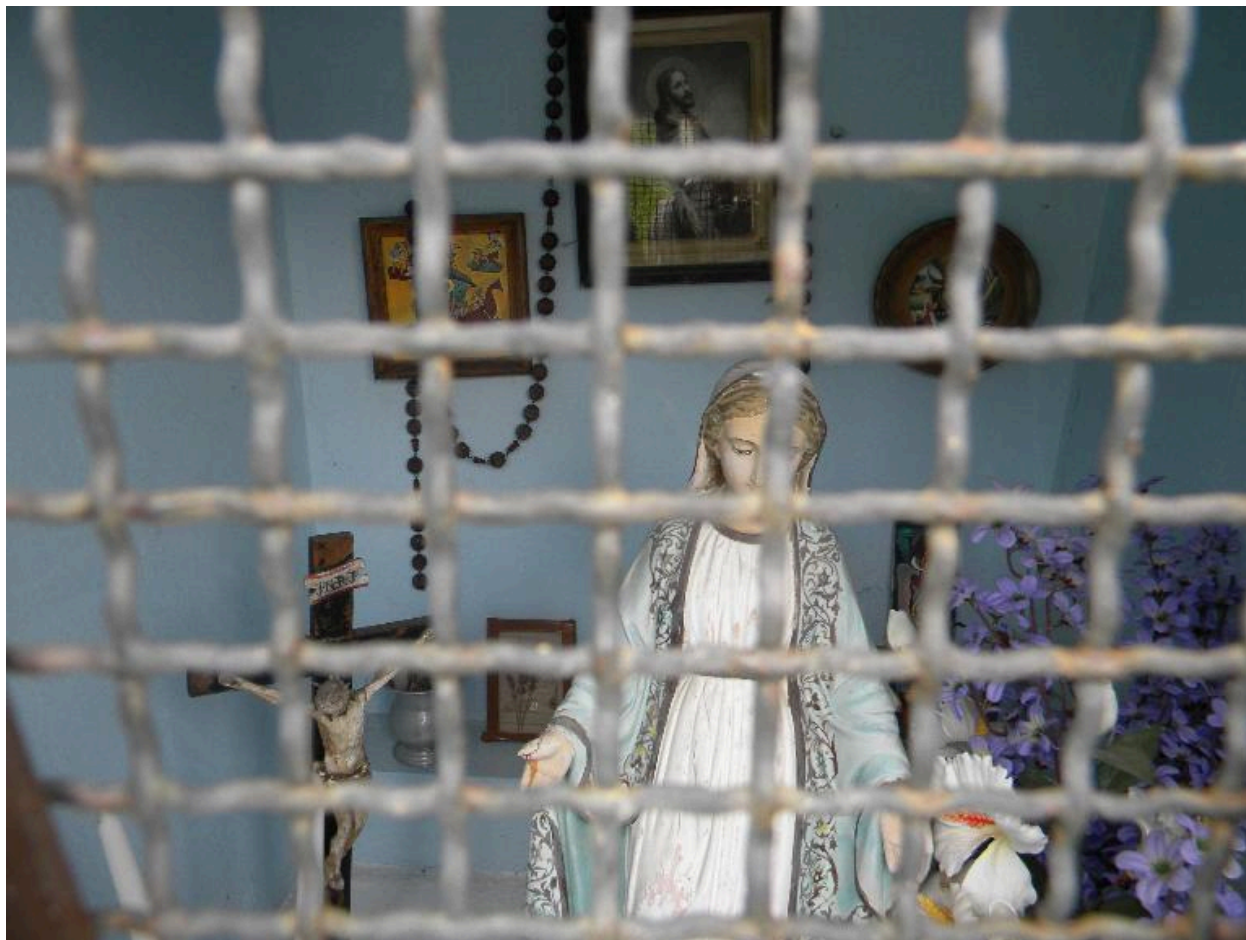
Vue de l'intérieur de l'oratoire.