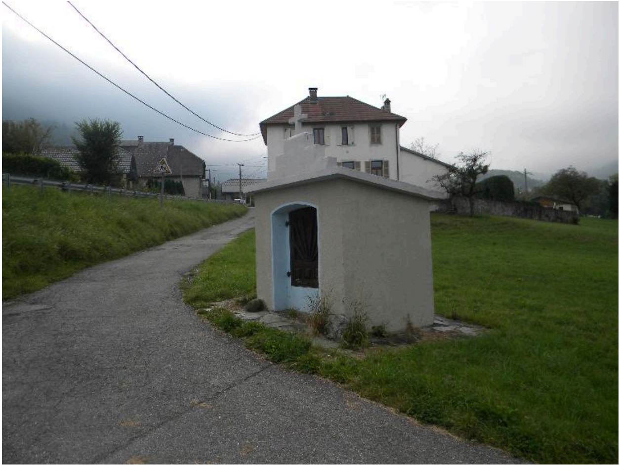
Vue de trois-quarts.