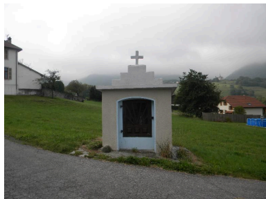
Vue de face IVR82_20157401716NUCA