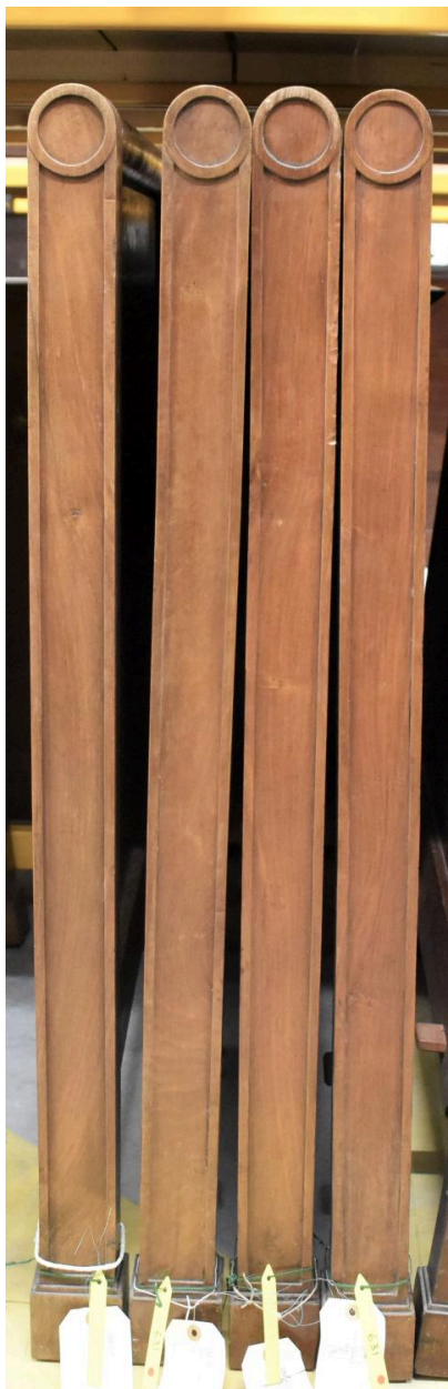
Vue générale - chevets