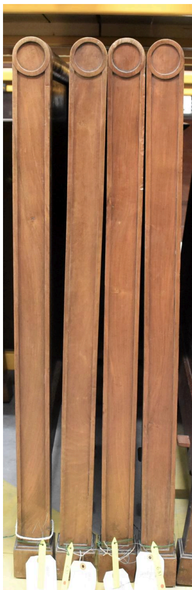
Vue générale - chevets IVR84_20226301169NUC4A