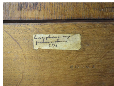
Détail - estampille et étiquette IVR84_20226301170NUC4A