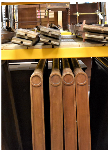
Vue générale - longs pans IVR84_20226301171NUC4A