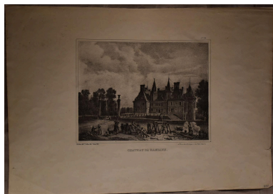
Vue générale IVR84_20216301044NUCA