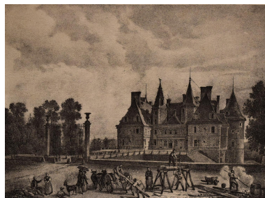
Détail IVR84_20216301045NUCA