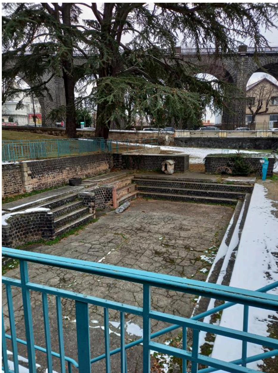
Piscine avec gradins et absides ayant fait partie des thermes antiques, découverte au moment de la construction du viaduc ferroviaire en 1878.