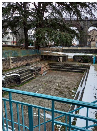
Piscine avec gradins et absides ayant fait partie des thermes antiques, découverte au moment de la construction du viaduc ferroviaire en 1878. (Photo chercheur.) Phot. Bénédicte Renaud-Morand