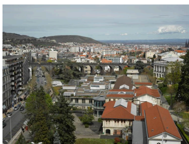
Vue générale du viaduc dit de Royat : à gauche, l'arche plus large passant au-dessus de l'avenue qui sert de promenade « aux habitants de Clermont et aux baigneurs et touristes de Royat » IVR84_20166300112NUC4A