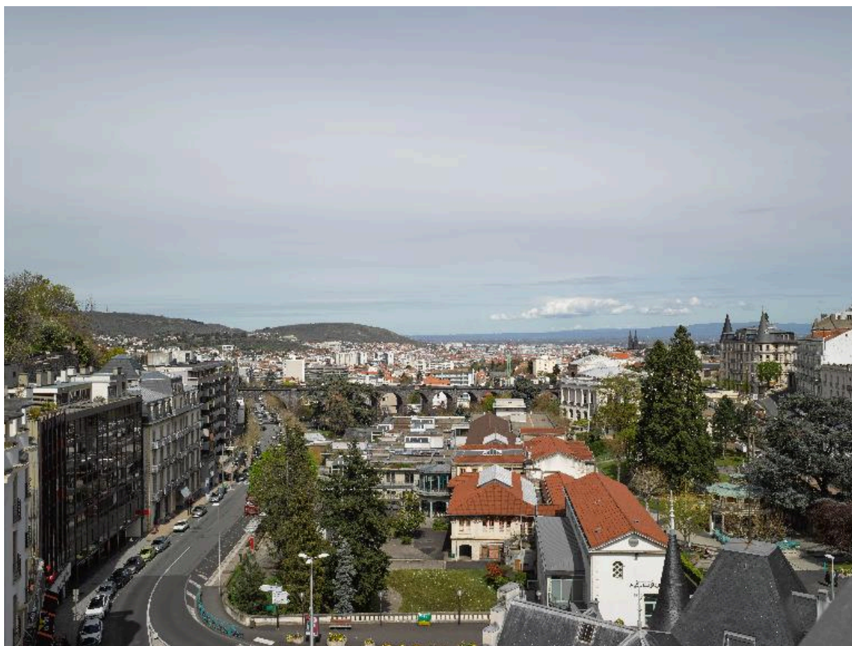
Vue du viaduc depuis le sud