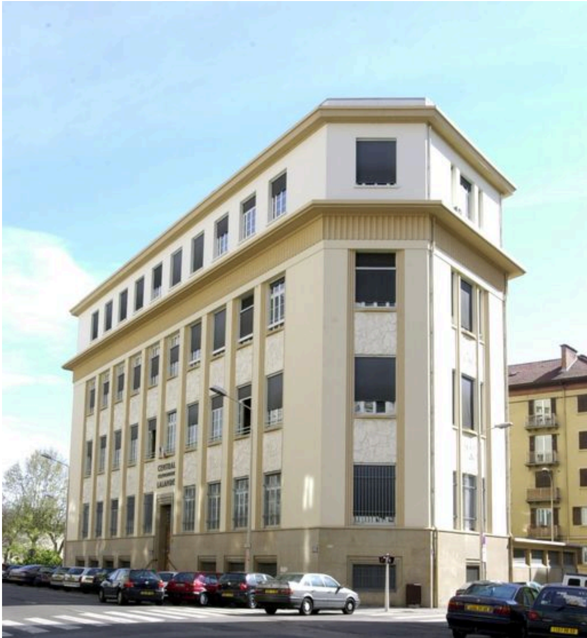
Elévations ouest et sud