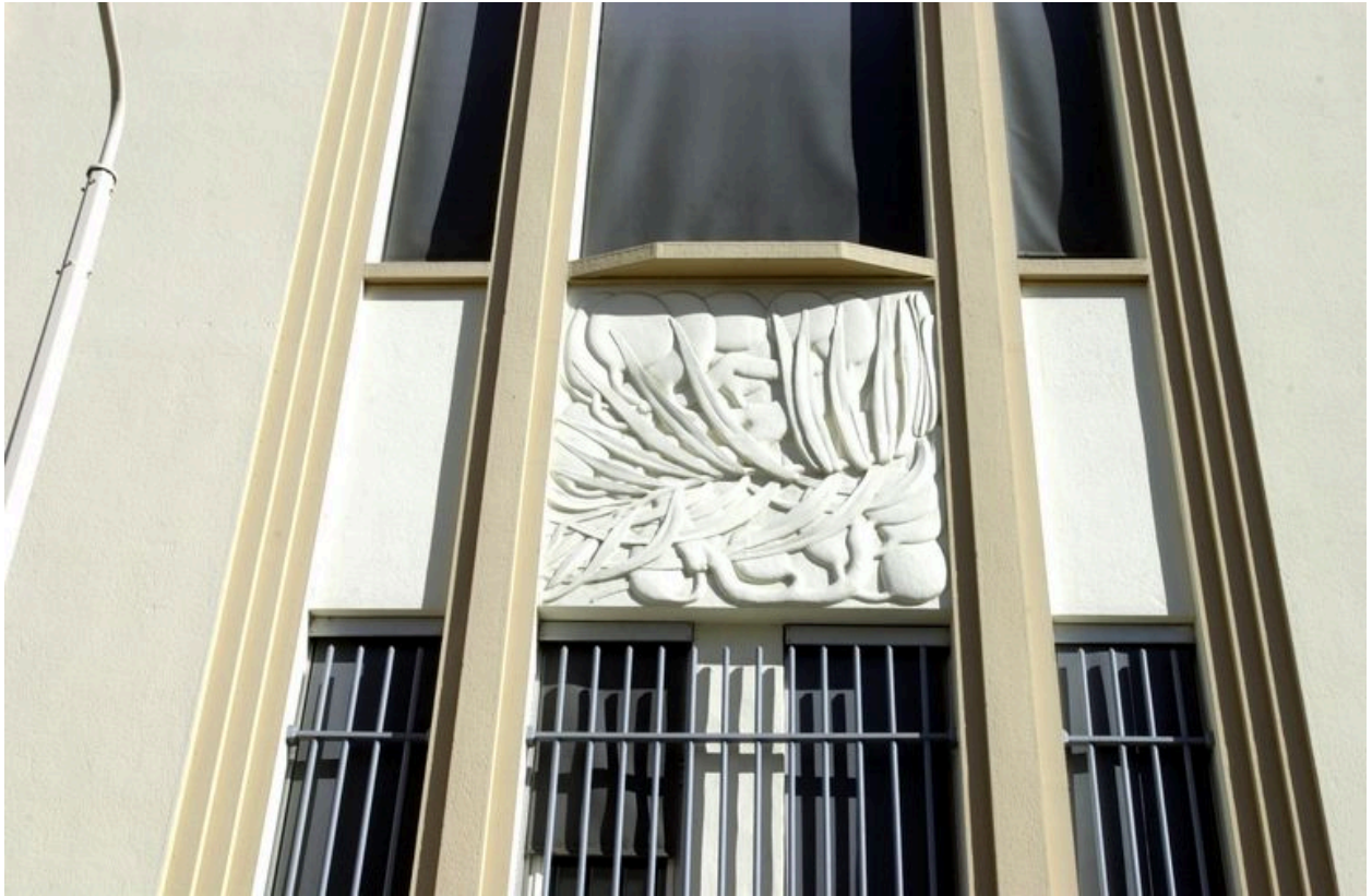
Détail d'un relief