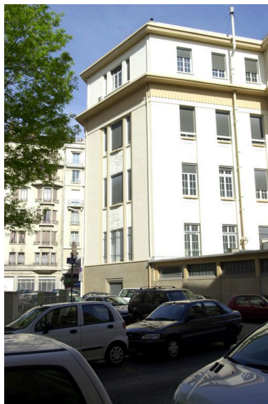
Elévation sud IVR82_20046902090NUCA

IVR82_20046902088NUCA