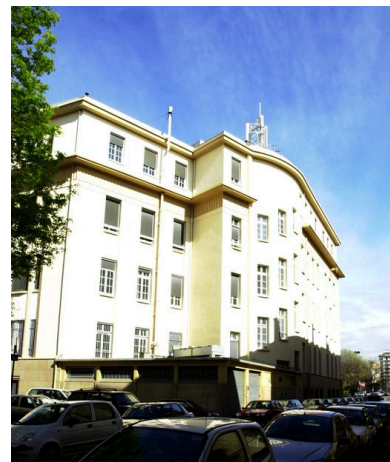
Elévation est IVR82_20046902089NUCA