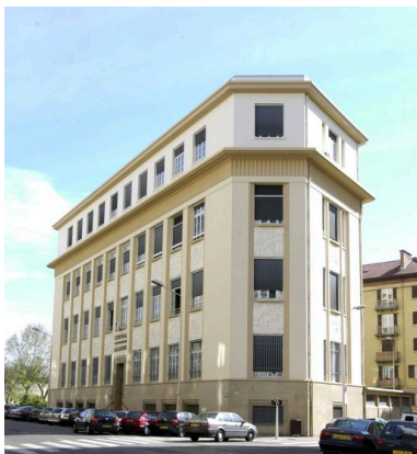
Elévations ouest et sud IVR82_20046902087NUCA