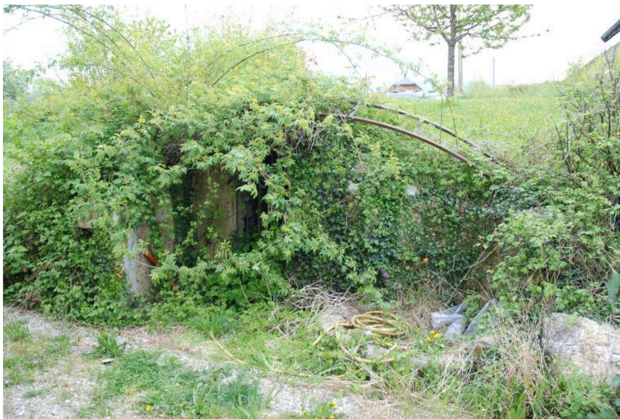
Puits et abreuvoir aux Légers (non cadastré, vers 2013 A7 704).