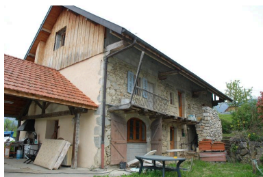
Vue d'une ferme des Légers (2013 A7 708), non repérée. IVR82_20157303035NUCA