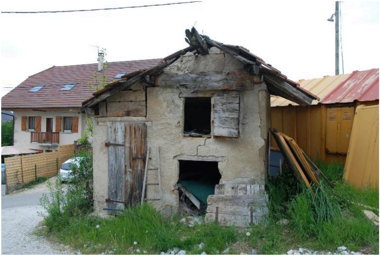
Poulailler et porcherie aux Légers (non cadastré, sur 2013 A7 686).