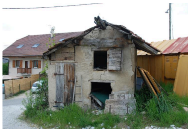
Poulailler et porcherie aux Légers (non cadastré, sur 2013 A7 686).