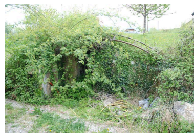
Puits et abreuvoir aux Légers (non cadastré, vers 2013 A7 704).