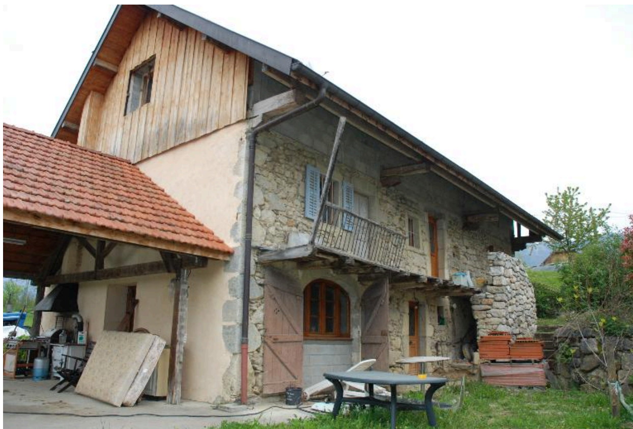
Vue d'une ferme des Légers (2013 A7 708), non repérée.