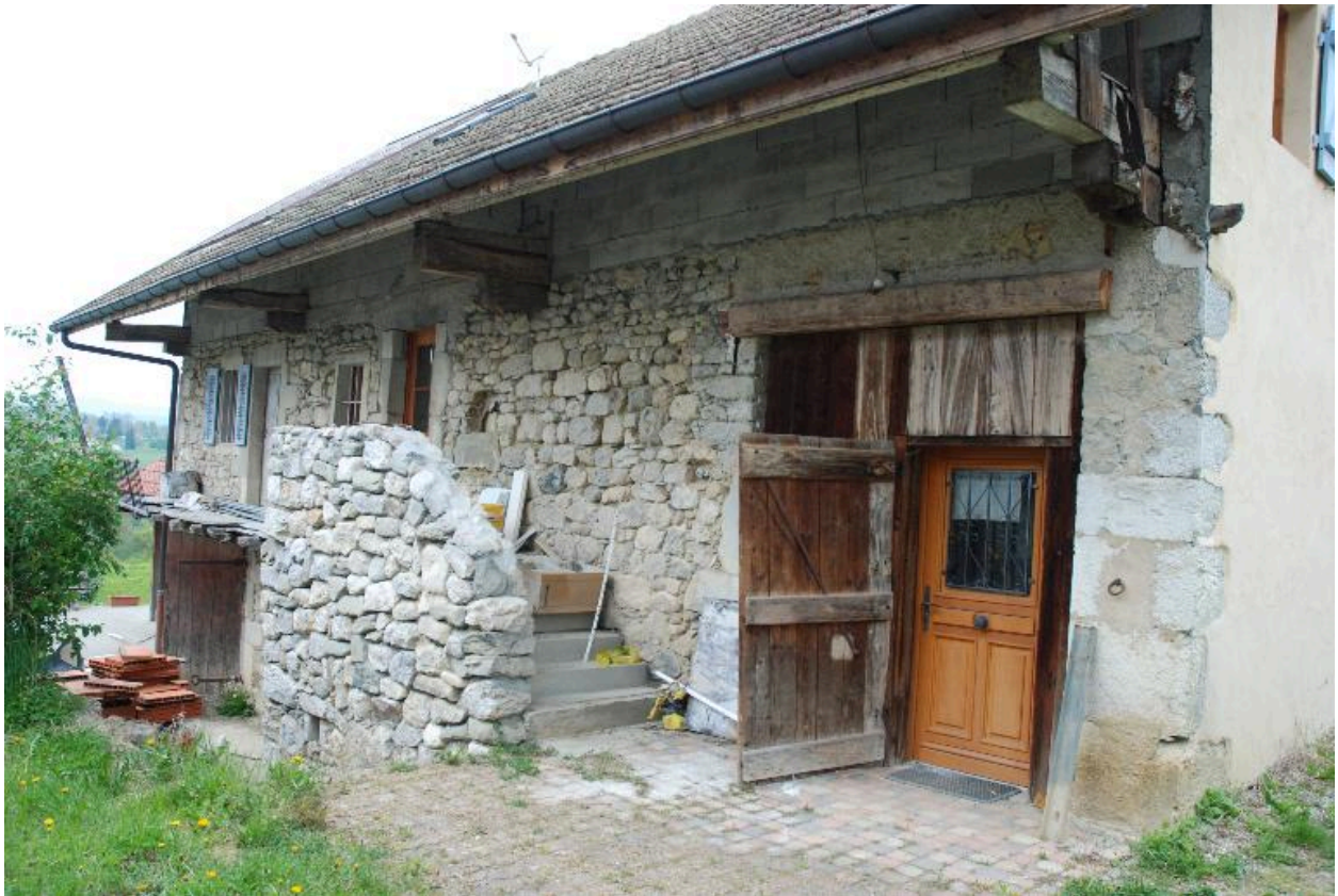
Vue d'une ferme des Légers (2013 A7 708), non repérée.