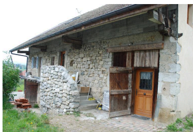
Vue d'une ferme des Légers (2013 A7 708), non repérée.