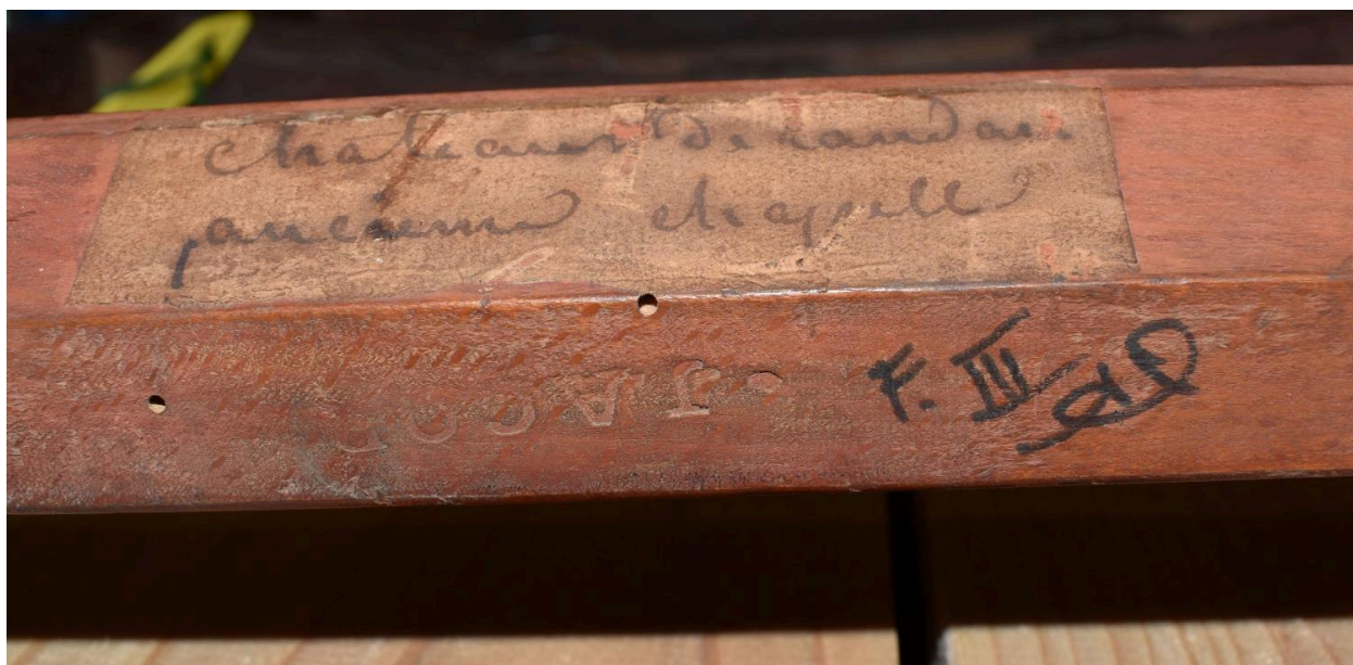
Vue d'une étiquette et de l'estampille