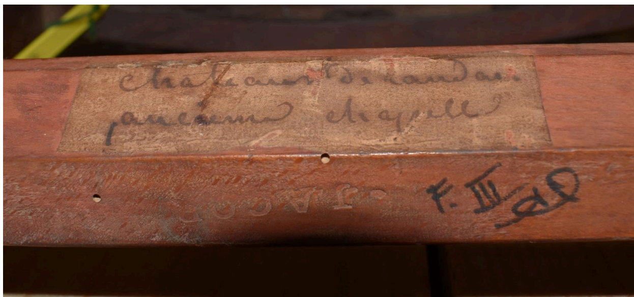
Vue de l'étiquette et de l'estampille