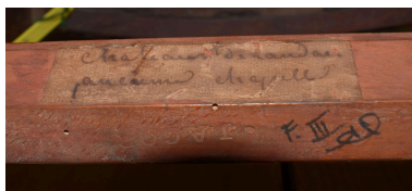
Vue de l'étiquette et de l'estampille