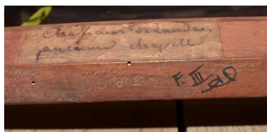
Vue d'une étiquette et de l'estampille IVR84_20226301051NUC4A