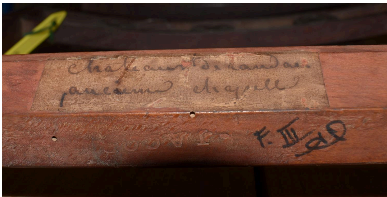
Vue d'une étiquette et de l'estampille