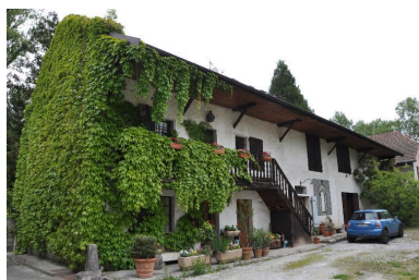
Vue de trois-quart du corps principal depuis le sud-ouest