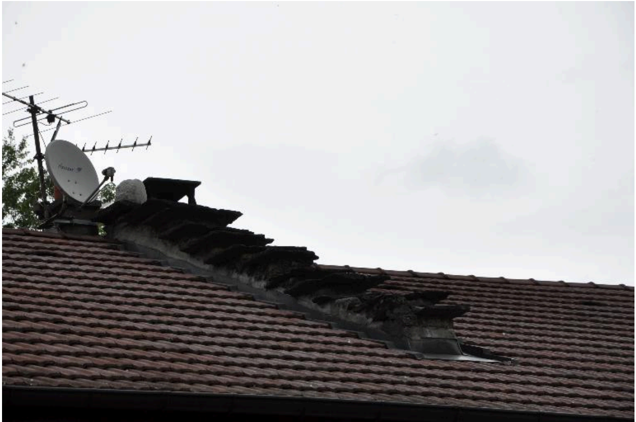
Détail sur un pignon découvert à redents