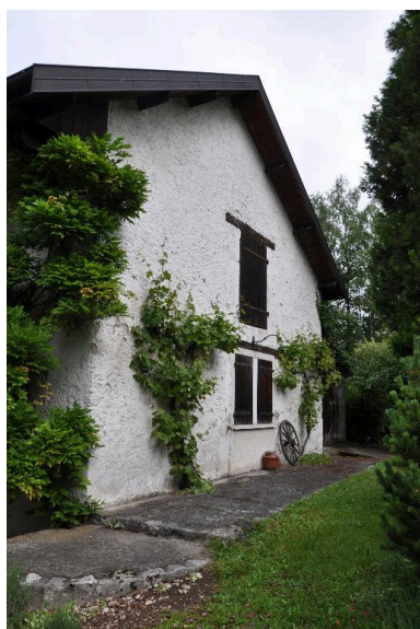
Elévation latérale est de l'ancienne grange IVR82_20137300404NUCA