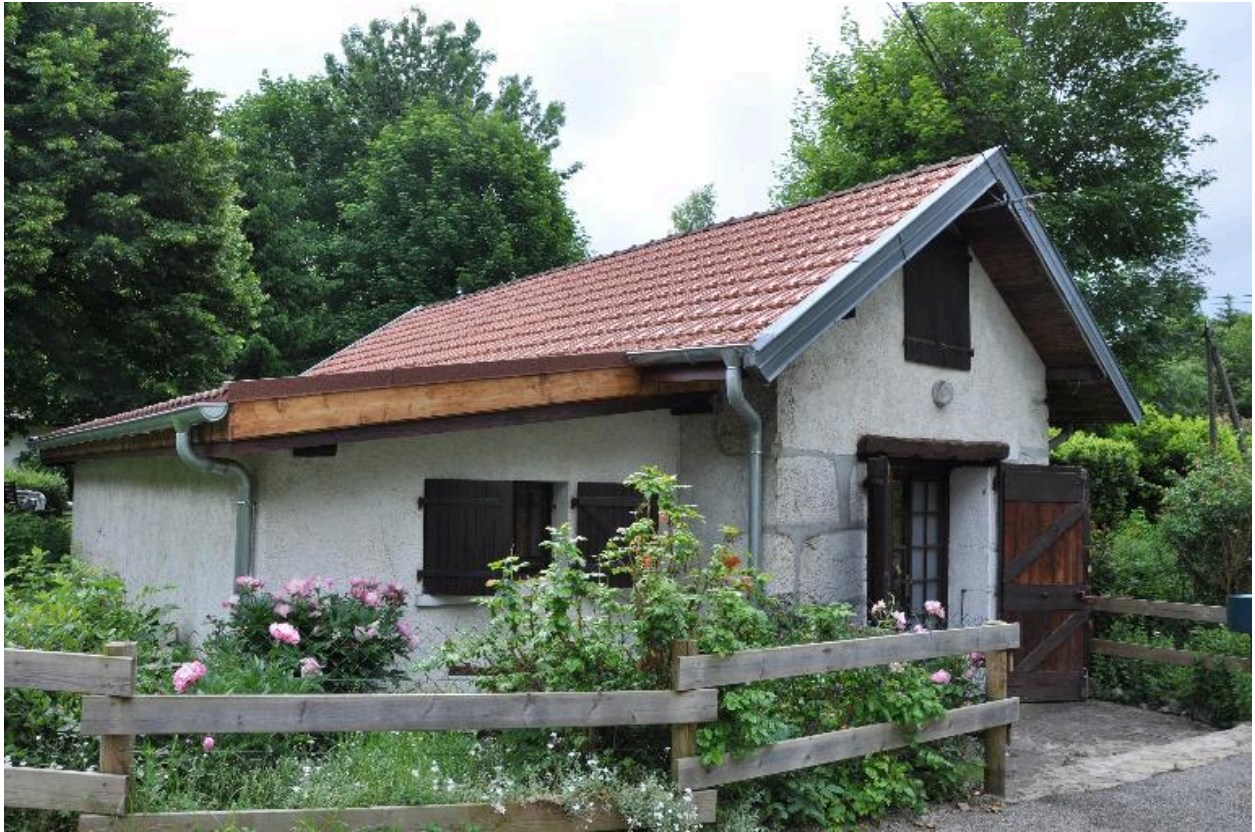
Vue de trois-quart de l'ancien four depuis le nord-ouest