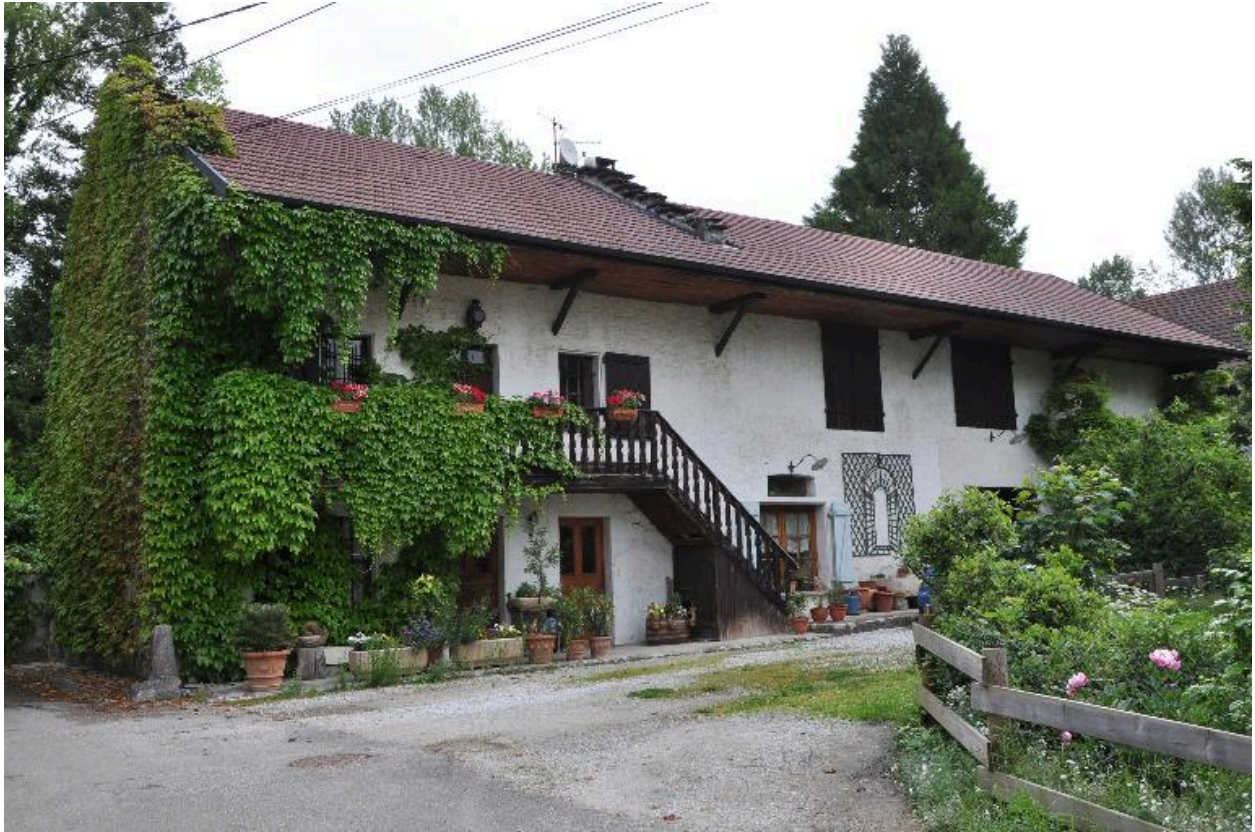
Vue générale des élévations sur cour du corps principal