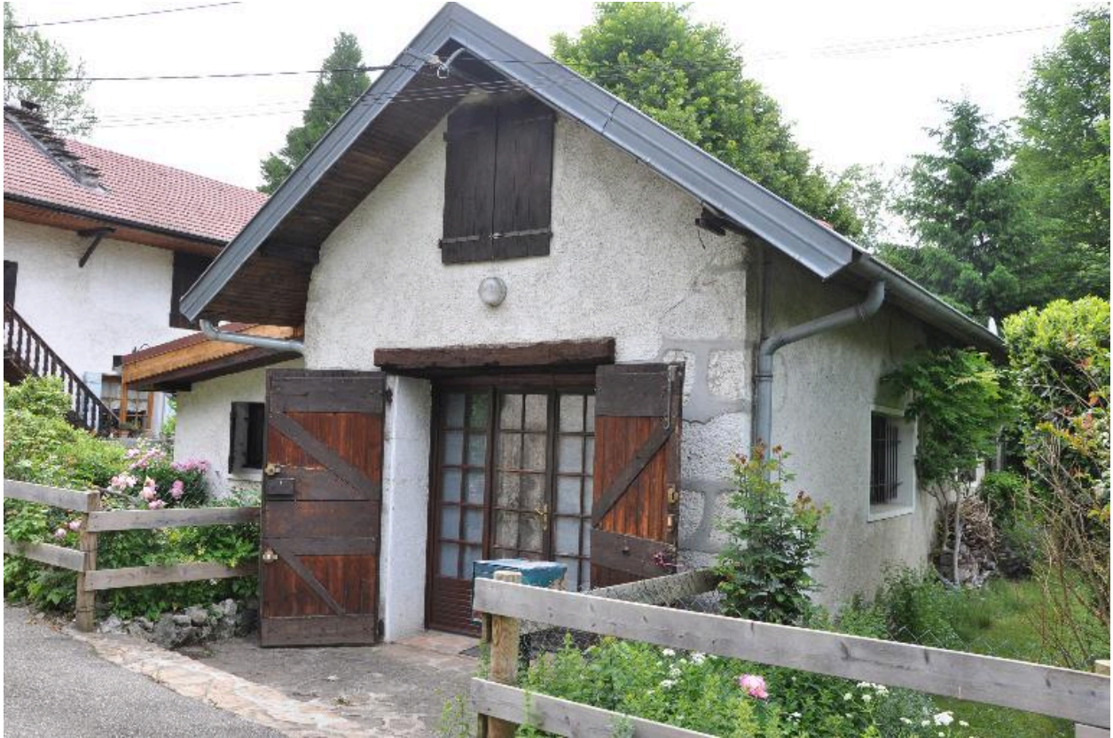
Elevation principale de l'ancien four