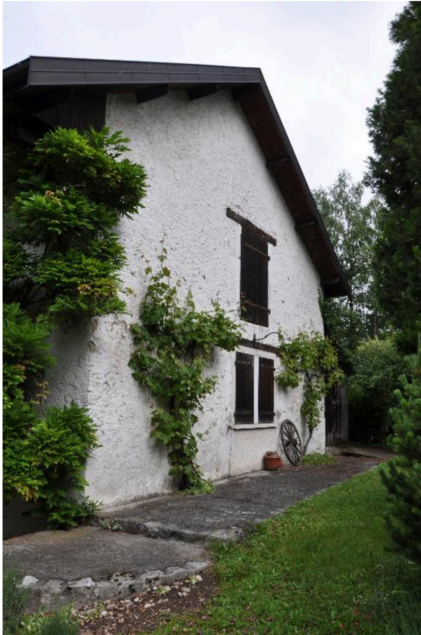
Elévation latérale est de l'ancienne grange