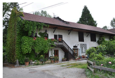
Vue générale des élévations sur cour du corps principal IVR82_20137300402NUCA