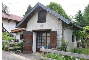
Elevation principale de l'ancien four IVR82_20137300405NUCA