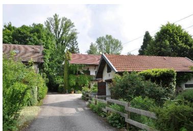
Vue d'ensemble depuis le chemin des Combaruches IVR82_20137300406NUCA