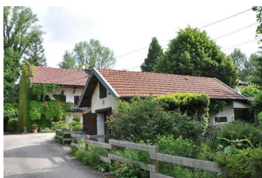
Vue d'ensemble de l'ancien four transformé en habitation IVR82_20137300407NUCA