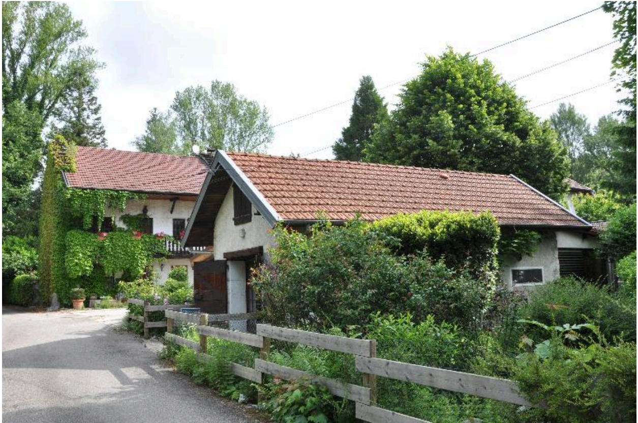
Vue d'ensemble de l'ancien four transformé en habitation