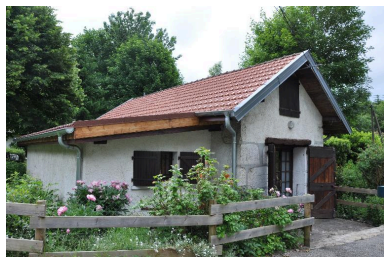
Vue de trois-quart de l'ancien four depuis le nord-ouest