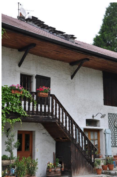
Escalier de distribution extérieur en bois IVR82_20137300403NUCA