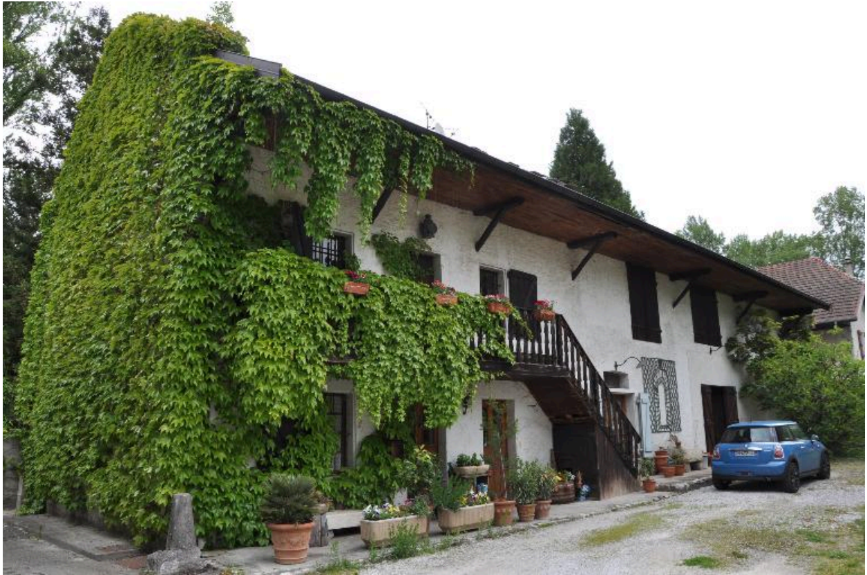
Vue de trois-quart du corps principal depuis le sud-ouest