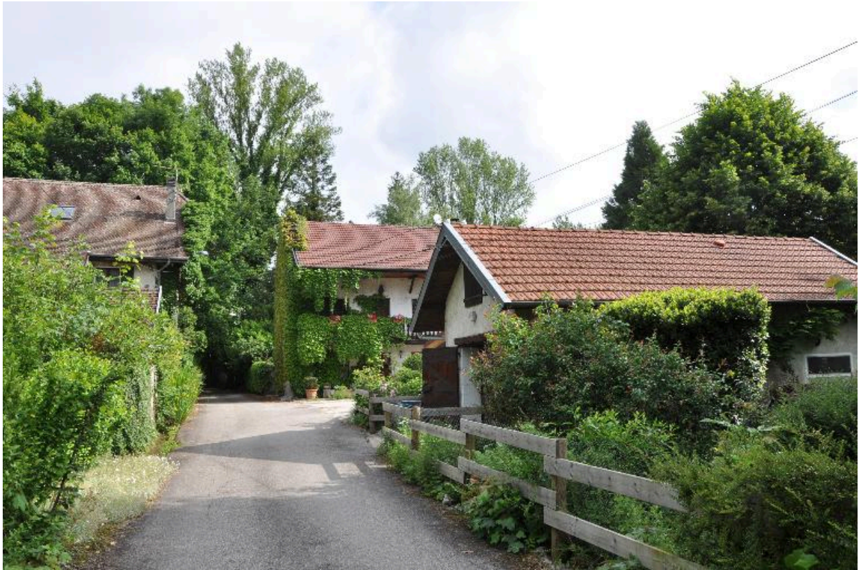
Vue d'ensemble depuis le chemin des Combaruches