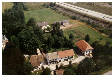
Vue aérienne, vers 1990