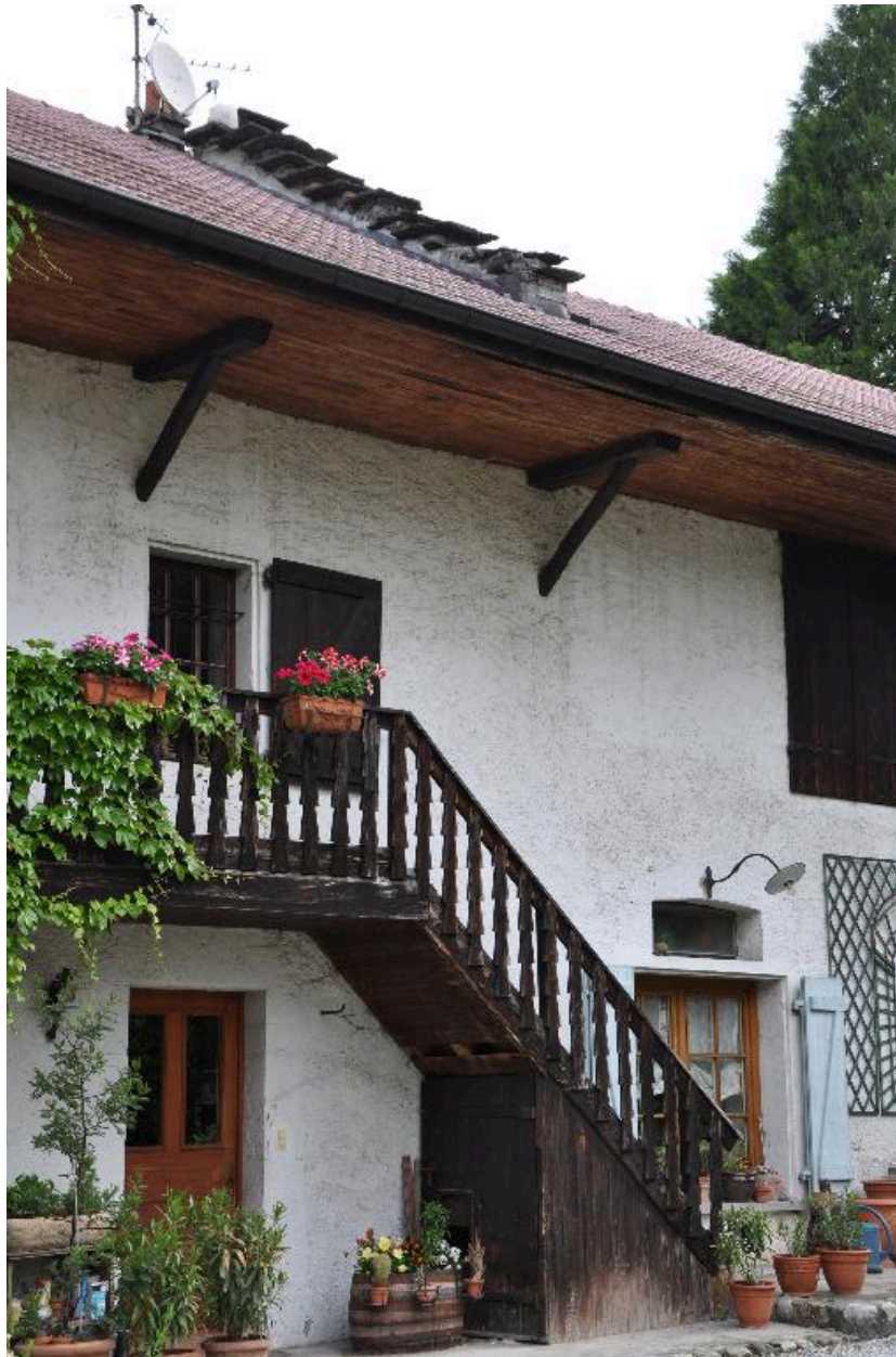
Escalier de distribution extérieur en bois