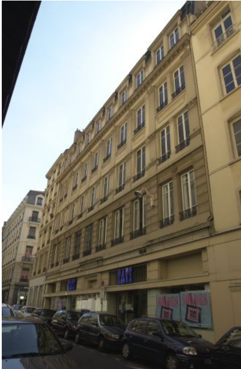
Façade sur rue, vue générale