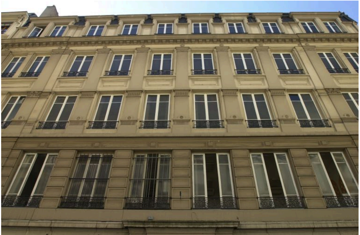
Façade principale, vue par-dessous