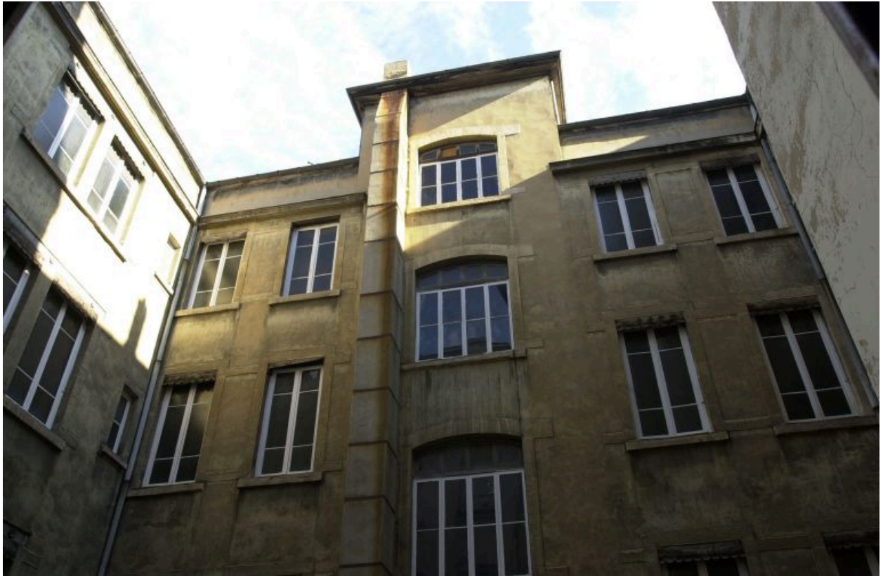
Elévations sur cour du corps principal et d'une partie de l'aile ouest