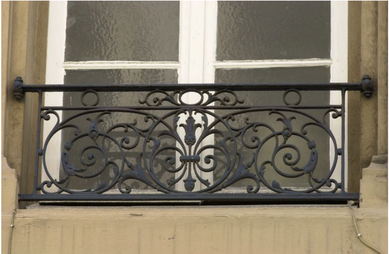
Façade principale, 2e niveau, garde-corps de la 2e fenêtre