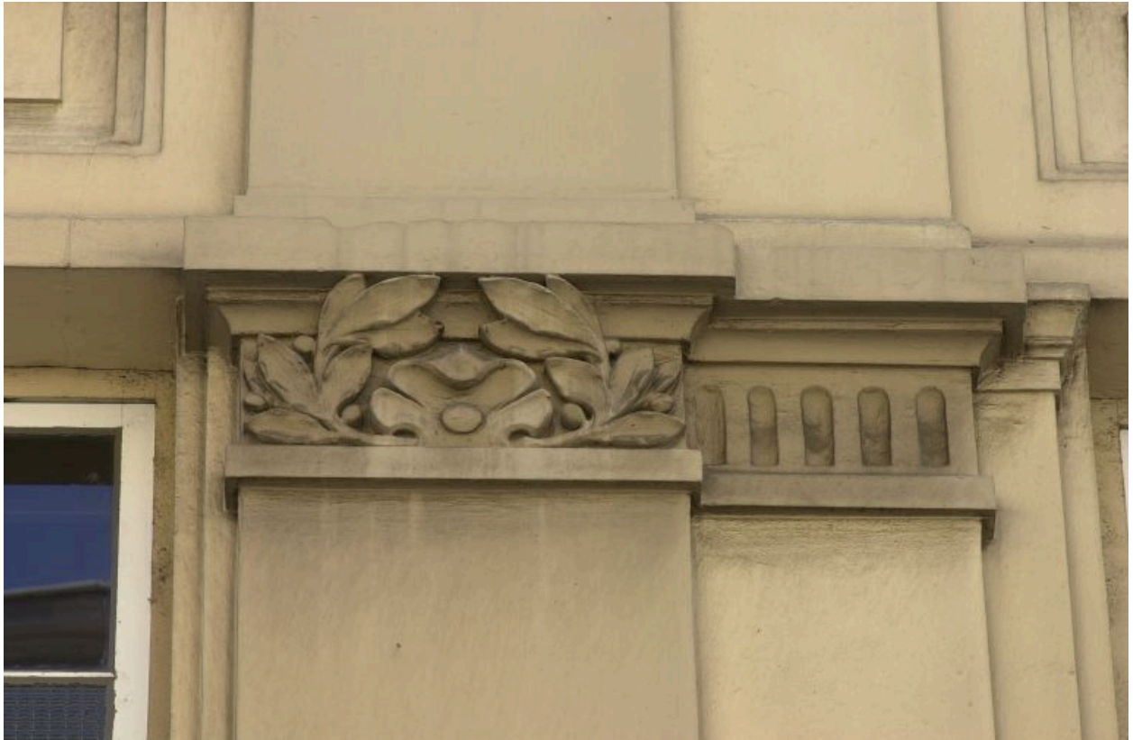
Façade principale, 3e niveau, motif sculpté entre les 2e et 3e travées