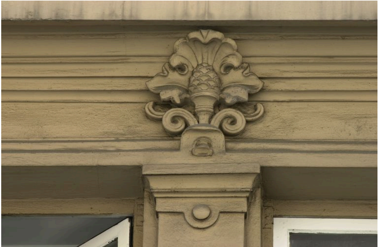
Façade principale, 2e niveau, motif sculpté entre la 1ère et la 2e fenêtre