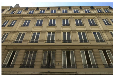
Façade principale, vue par-dessous IVR82_20046900892NUCA