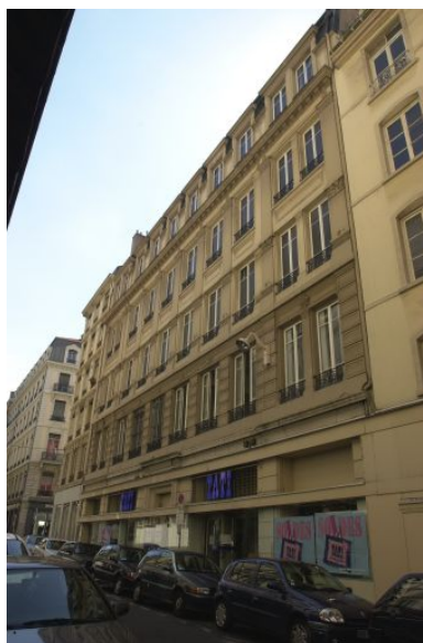
Façade sur rue, vue générale IVR82_20046900891NUCA