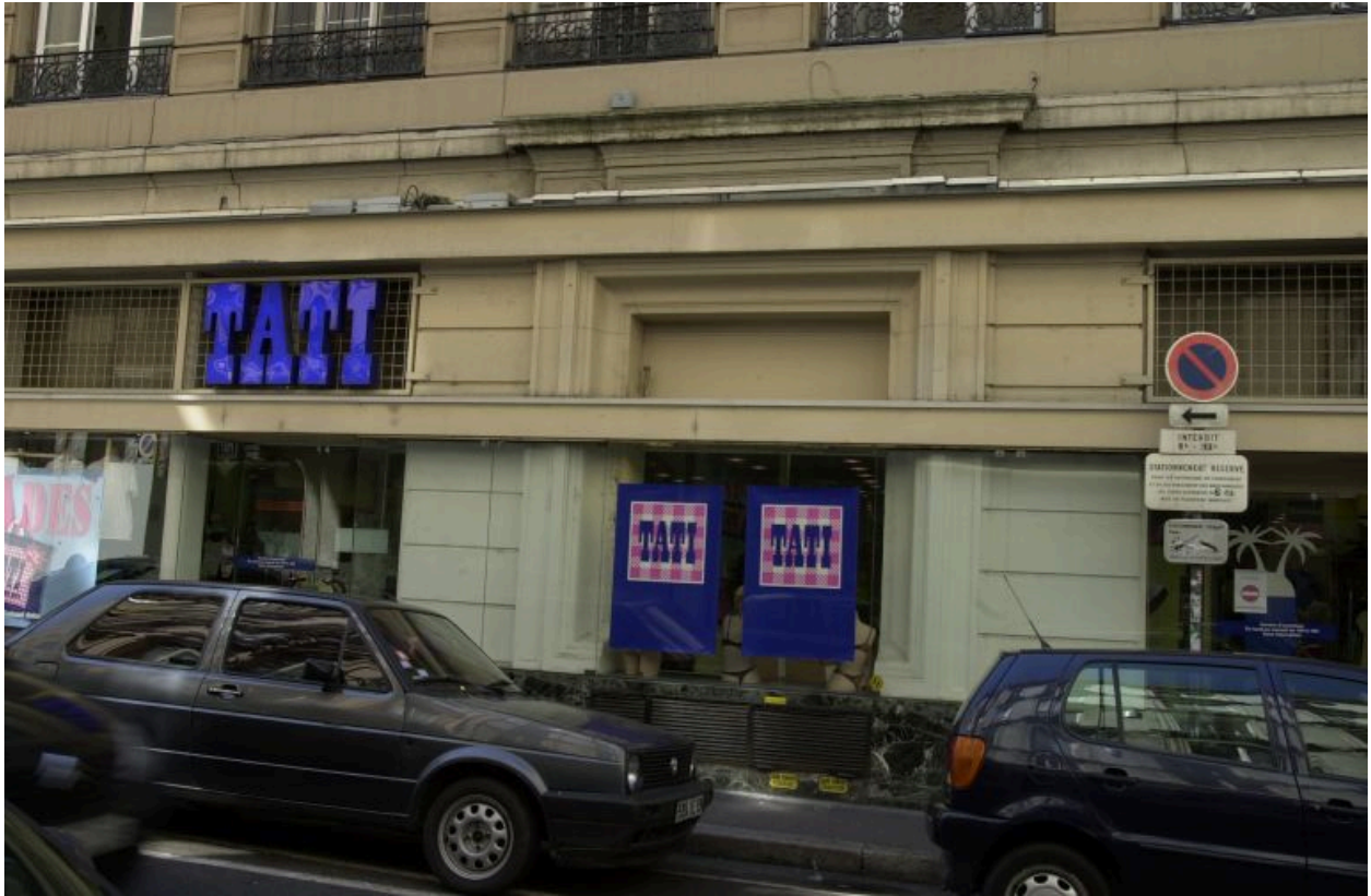
Façade principale, ancienne porte