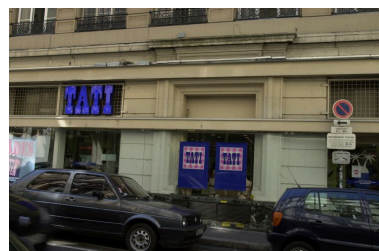
Façade principale, ancienne porte