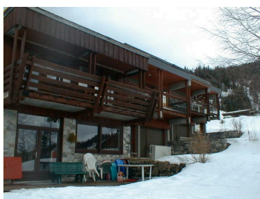
Vue d'ensemble, le chalet Quey à l'extrême droite