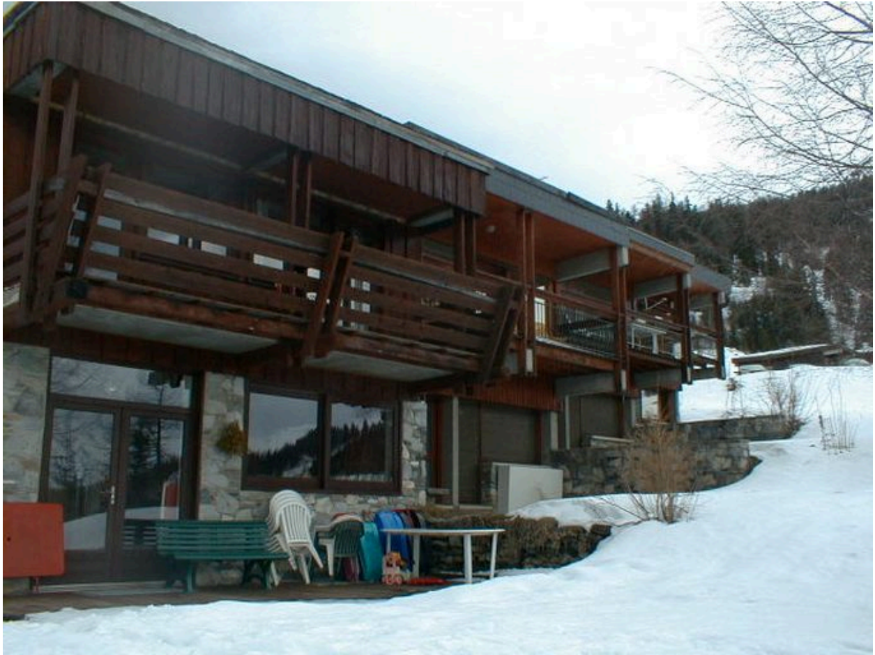
Vue d'ensemble, le chalet Quey à l'extrême droite