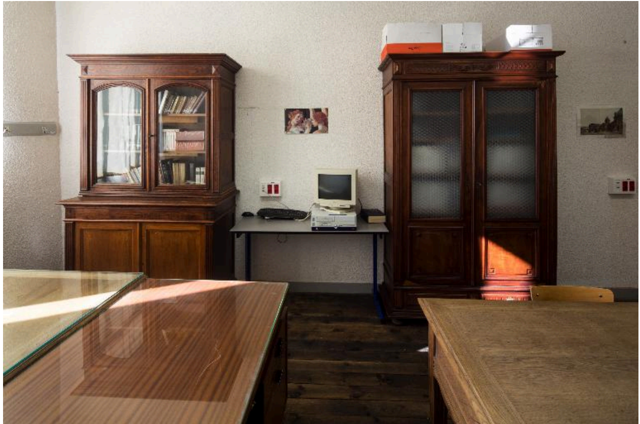
Armoires-bibliothèques dans la salle de repos des professeurs de Lettres