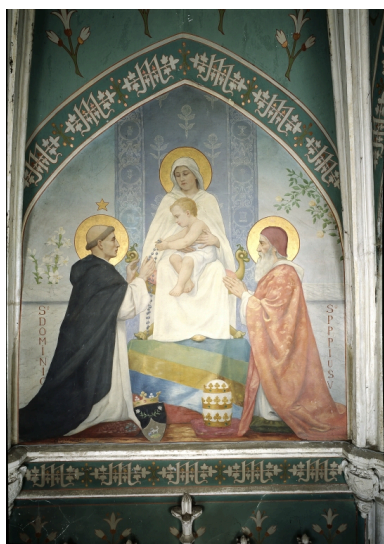
Chapelle de la Vierge : mur ouest. IVR82_19910100875PA