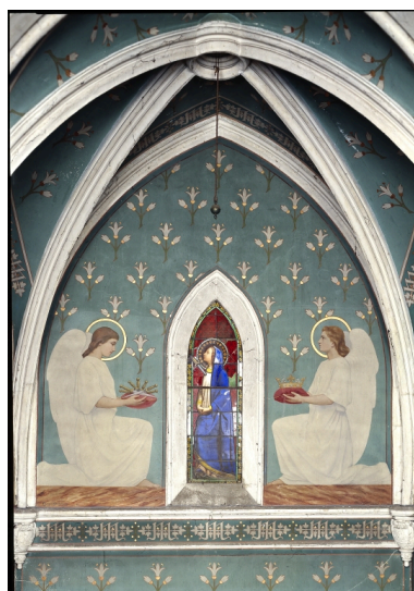
Chapelle de la Vierge : mur nord. IVR82_19910100873PA