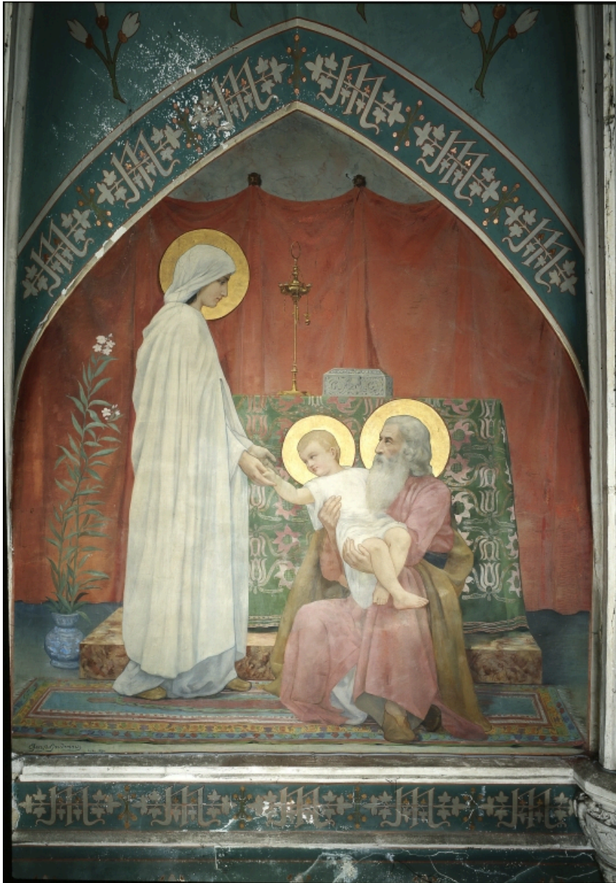
Chapelle de la Vierge : mur est.