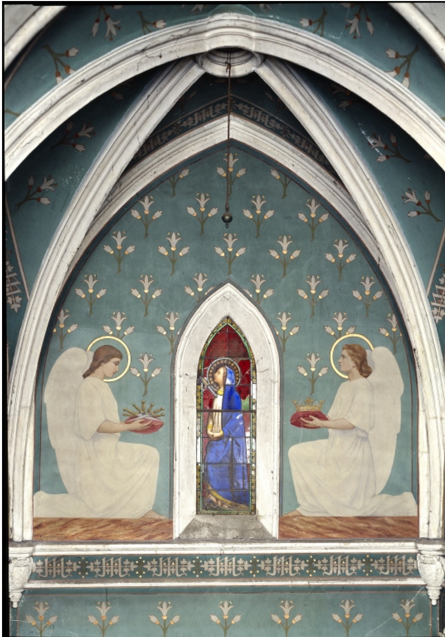
Chapelle de la Vierge : mur nord.