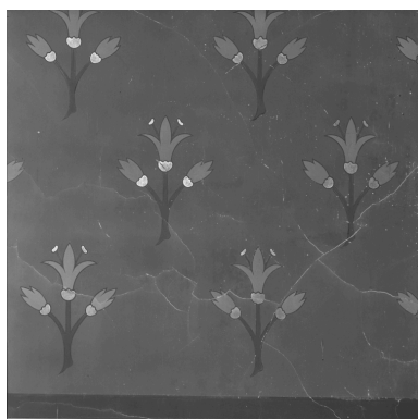
Chapelle de la Vierge, décor au pochoir de fleur de lys.