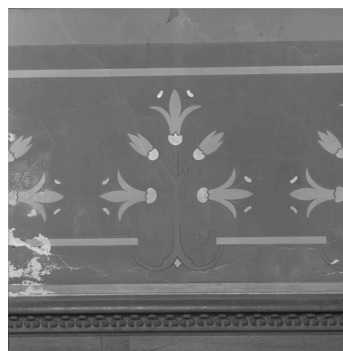
Chapelle de la Vierge, décor au pochoir de fleur de lys.