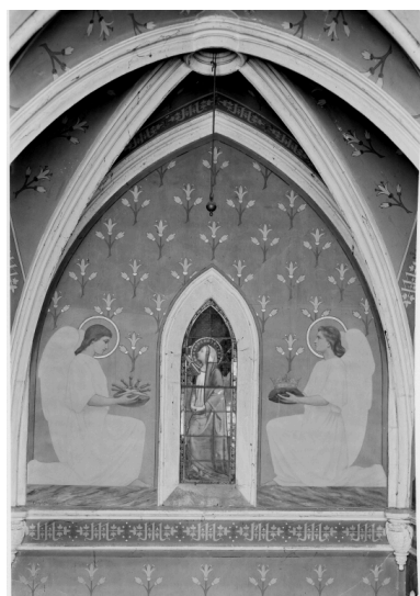
Chapelle de la Vierge : mur nord. IVR82_19910100872P