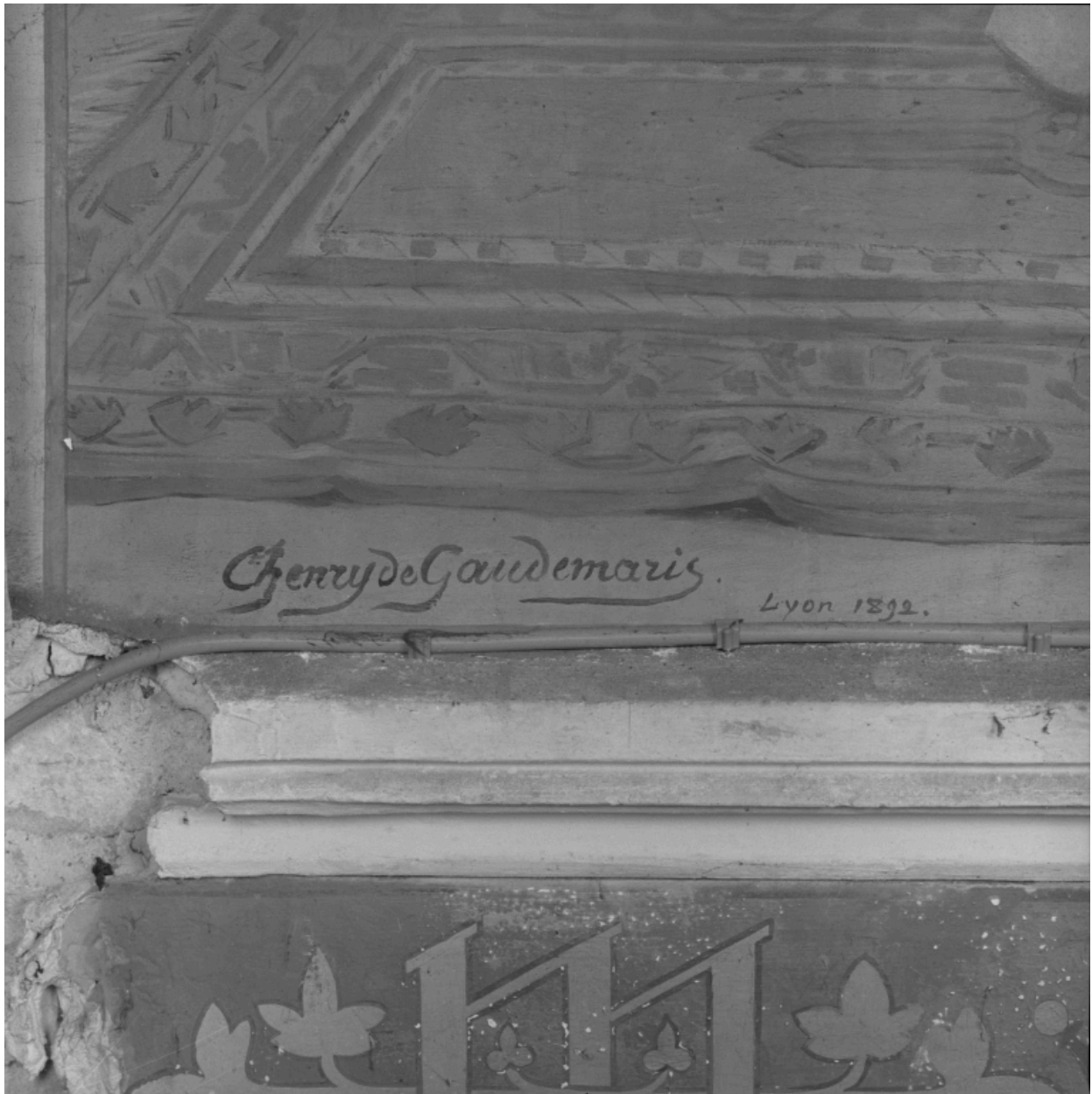
Chapelle de la Vierge : signature.