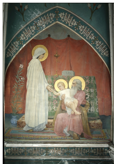
Chapelle de la Vierge : mur est.