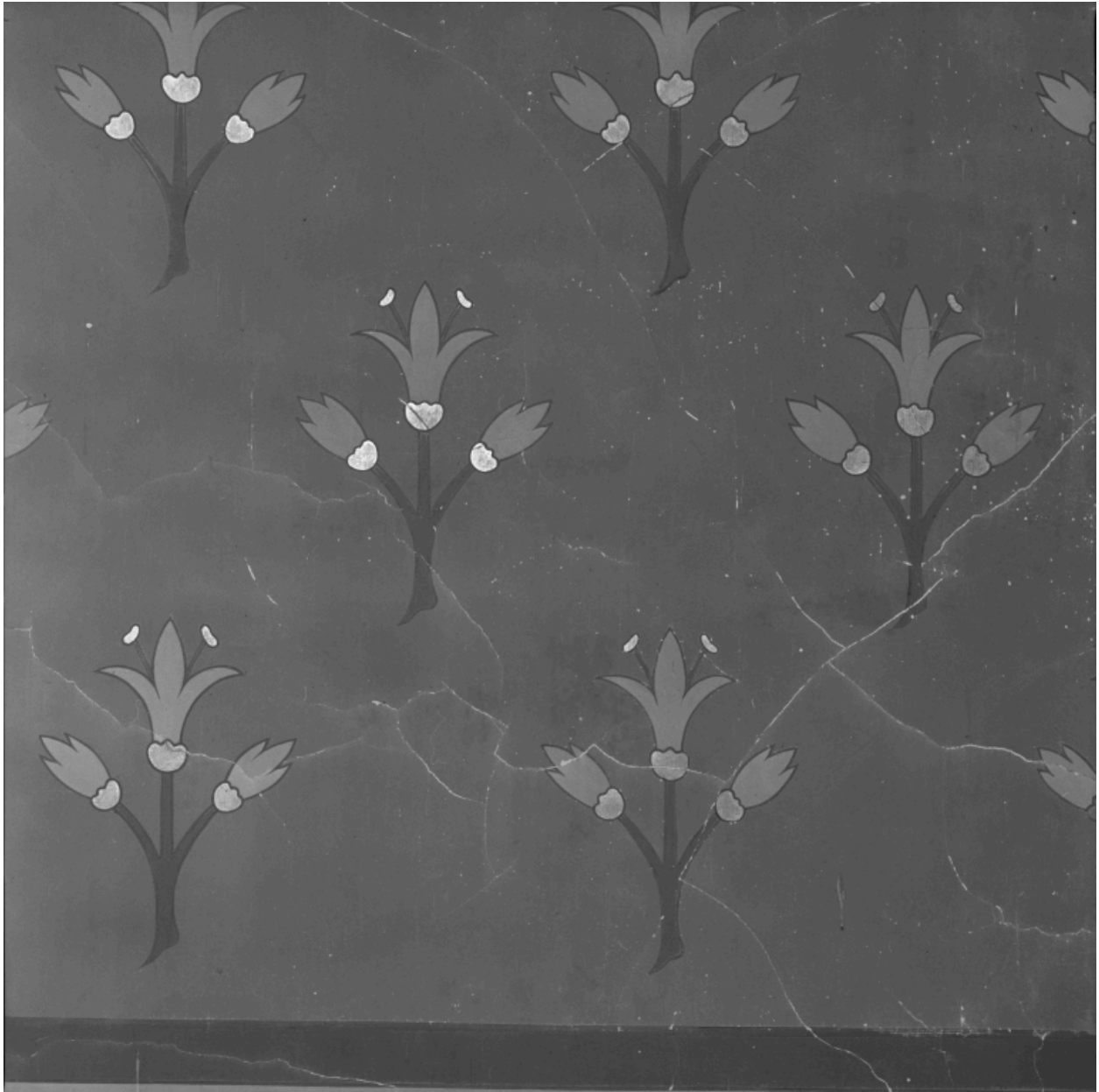
Chapelle de la Vierge, décor au pochoir de fleur de lys.