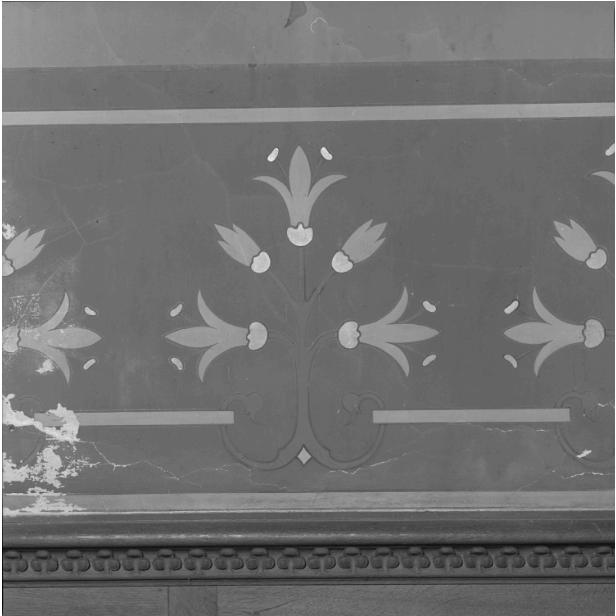
Chapelle de la Vierge, décor au pochoir de fleur de lys.