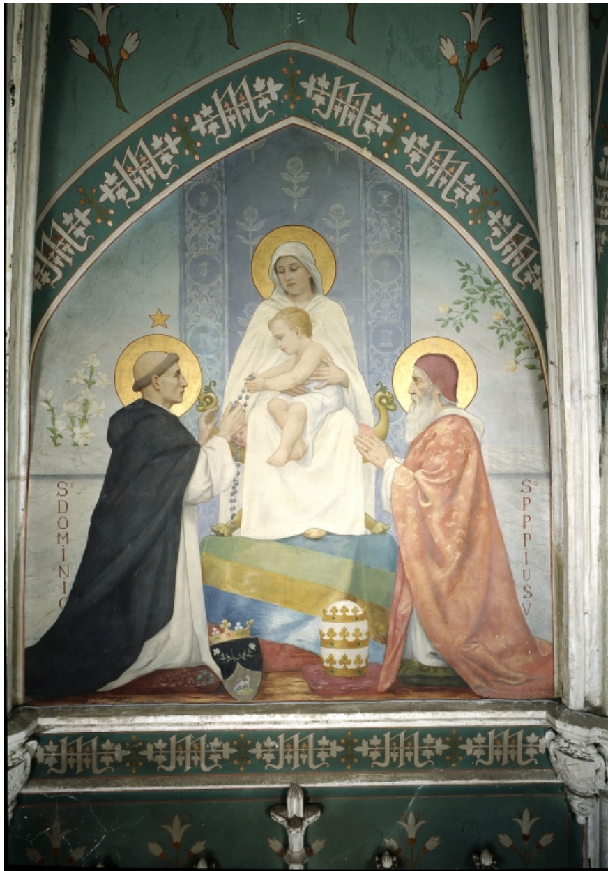
Chapelle de la Vierge : mur ouest.