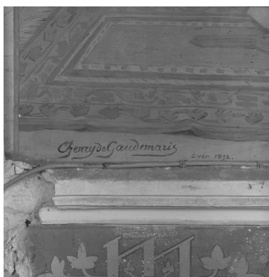
Chapelle de la Vierge : signature. IVR82_19910100878X