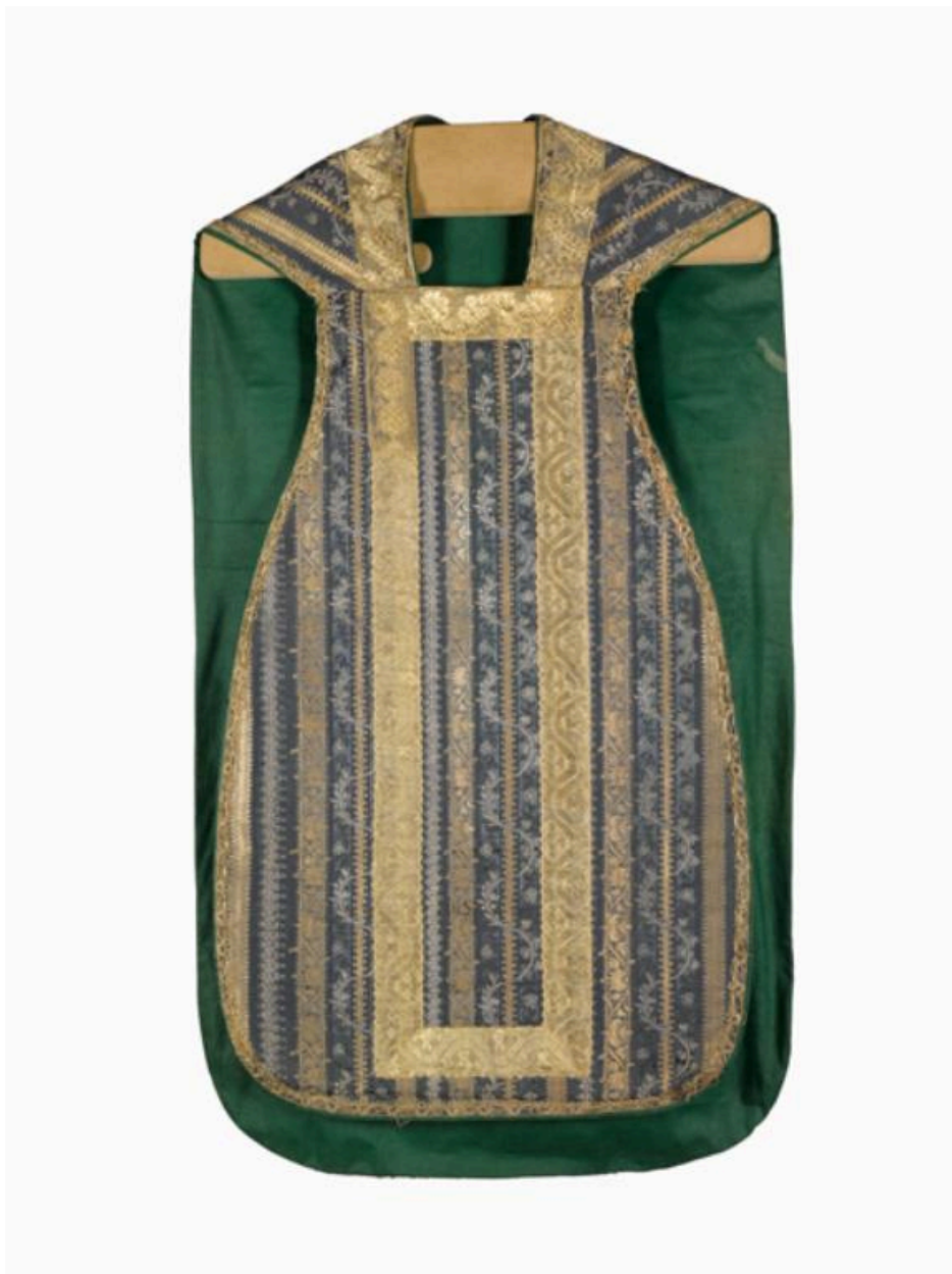
Vue du devant de la chasuble