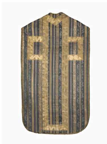
Vue du dos de la chasuble