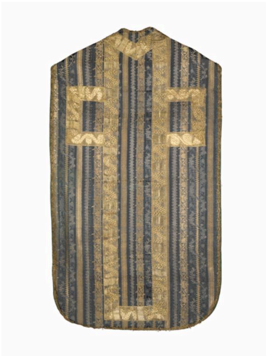
Vue du dos de la chasuble