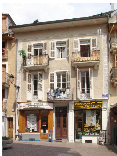
Façade IVR82_20057300518NUCA