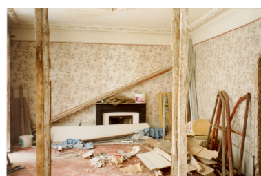
Travaux intérieurs IVR82_20057300921NUCB