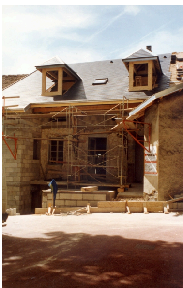
Travaux de surélévation IVR82_20057300920NUCB