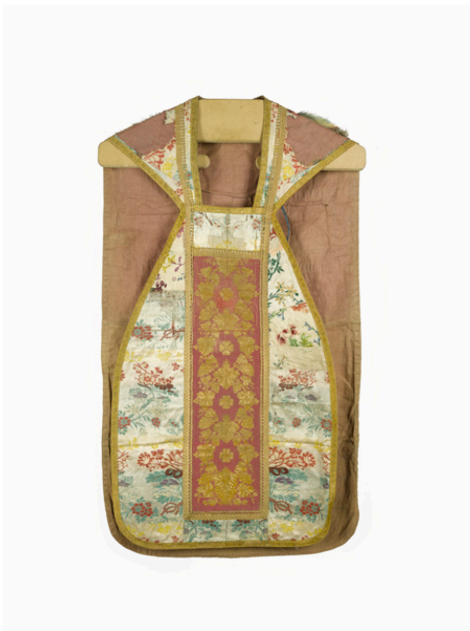
Vue du devant de la chasuble