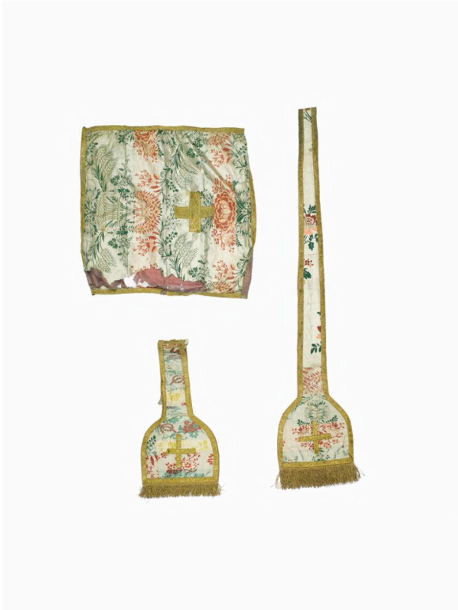
Vue du voile de calice, de l'étole et du manipule