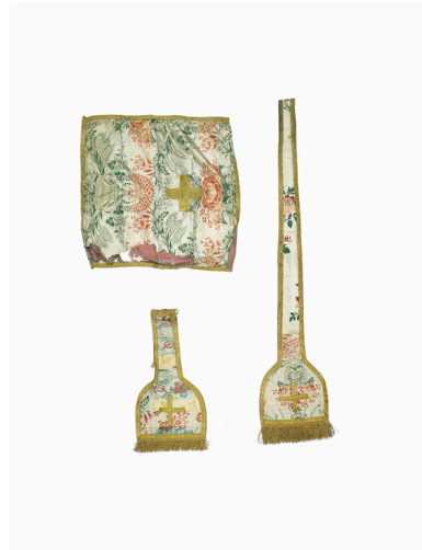
Vue du voile de calice, de l'étole et du manipule IVR84_20181500296NUC4A