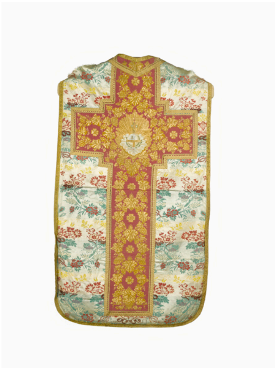
Vue du dos de la chasuble