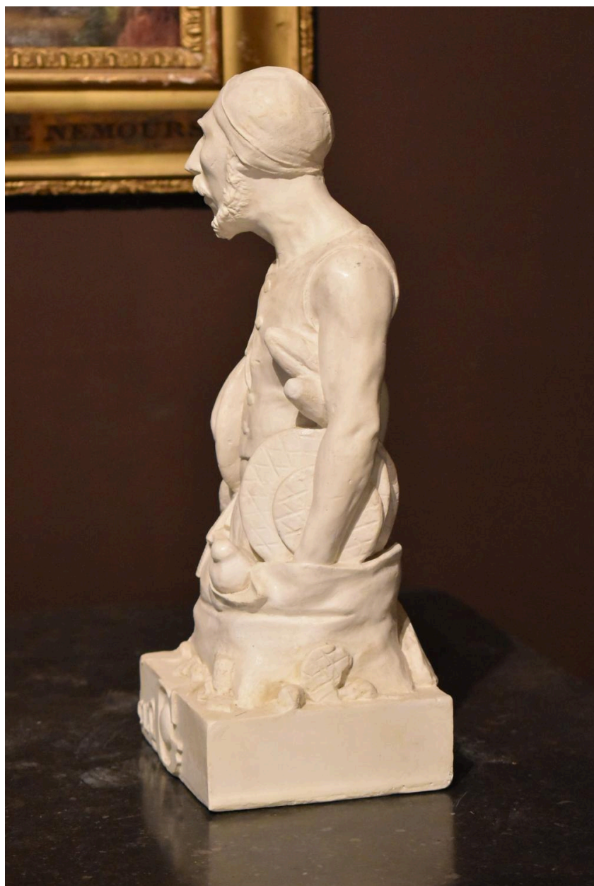
Vue de profil