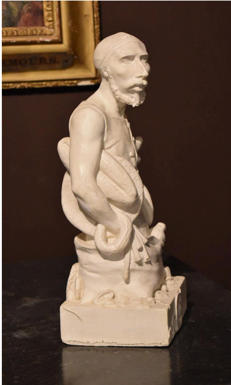
Vue de profil