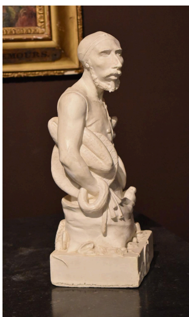
Vue de profil IVR84_20216301343NUC4A