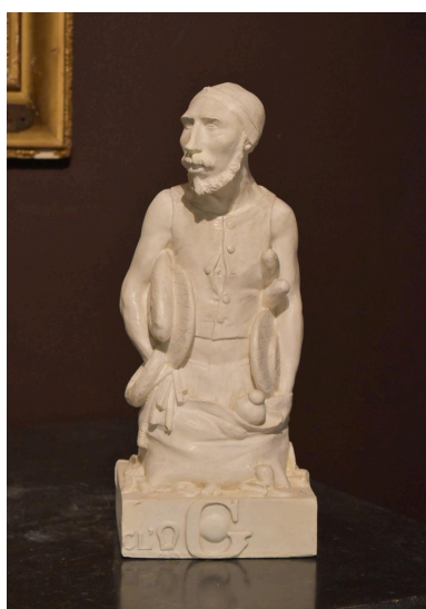
Vue de face IVR84_20216301342NUC4A