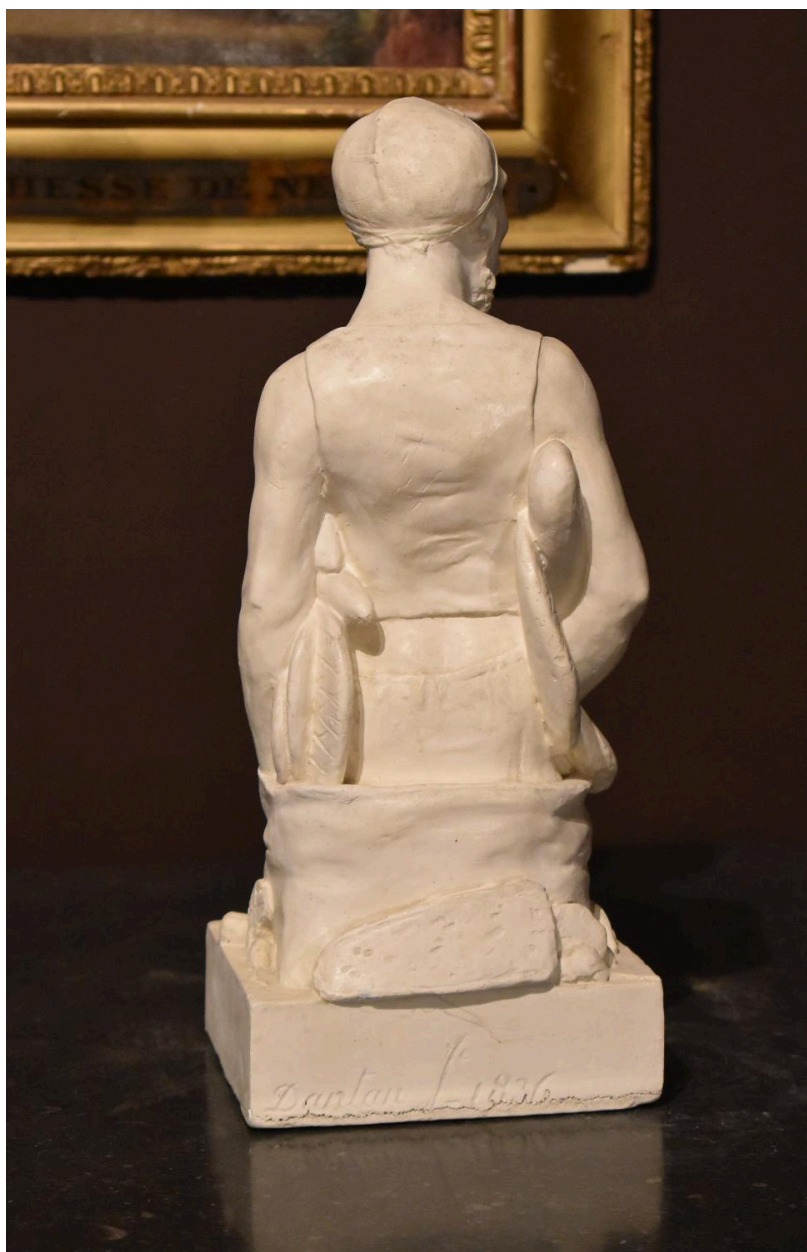
Vue de dos