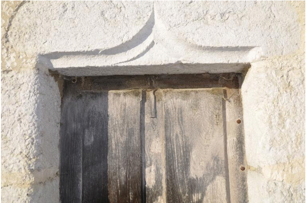
Détail du lindeau en accolade de la ferme IA73003358.