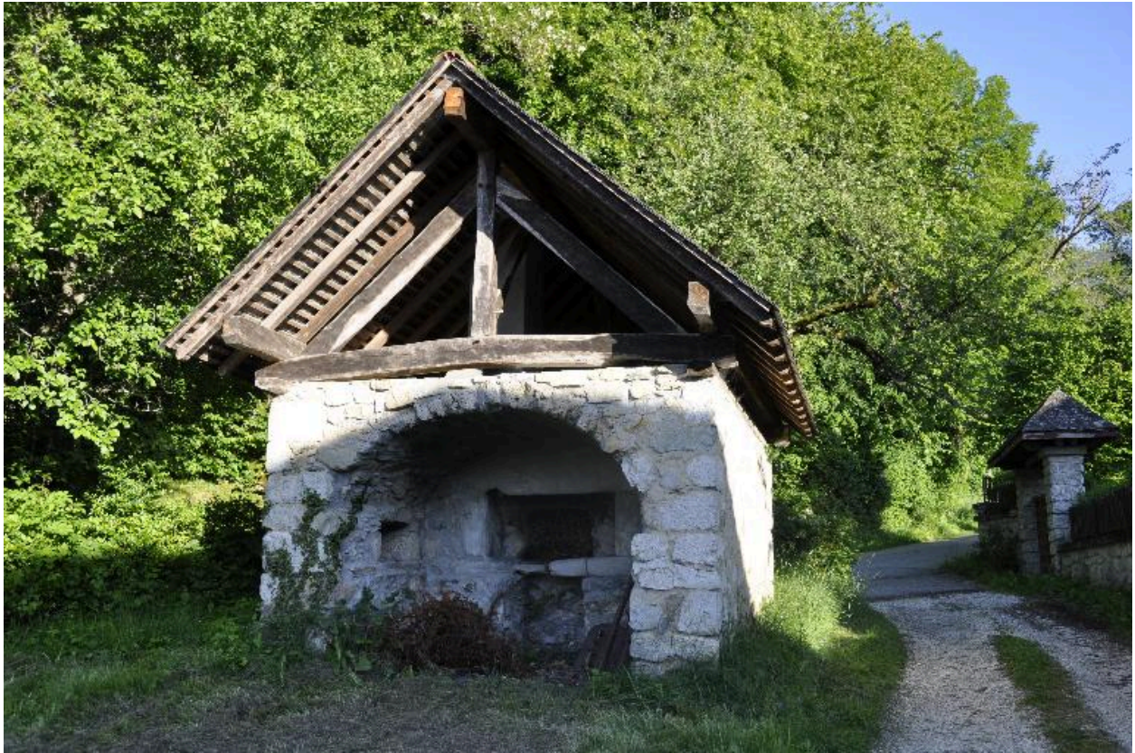
Vue du four à pain IA73003359.