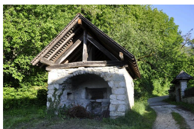
Vue du four à pain IA73003359. IVR84_20167302339NUCA