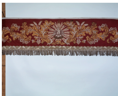
Vue partielle. IVR82_20002600615XA