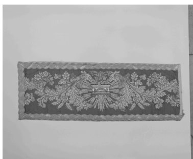
Panneau supplémentaire assorti, plus court. IVR82_20002600616X