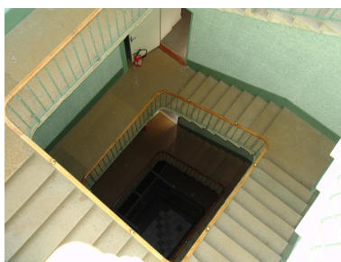
Escalier principal