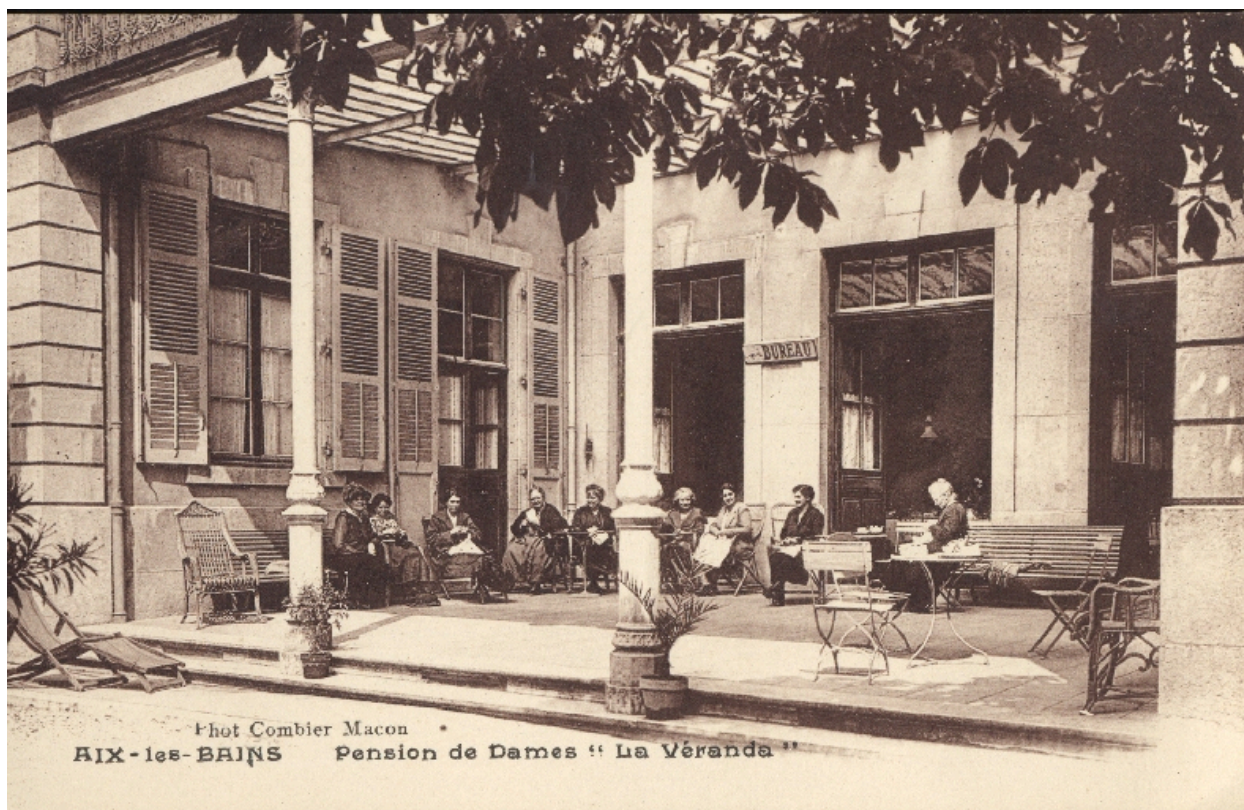
Pension de Dames : la véranda