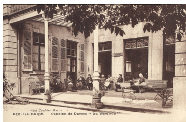
Pension de Dames : la véranda IVR82_20047300222NUCB