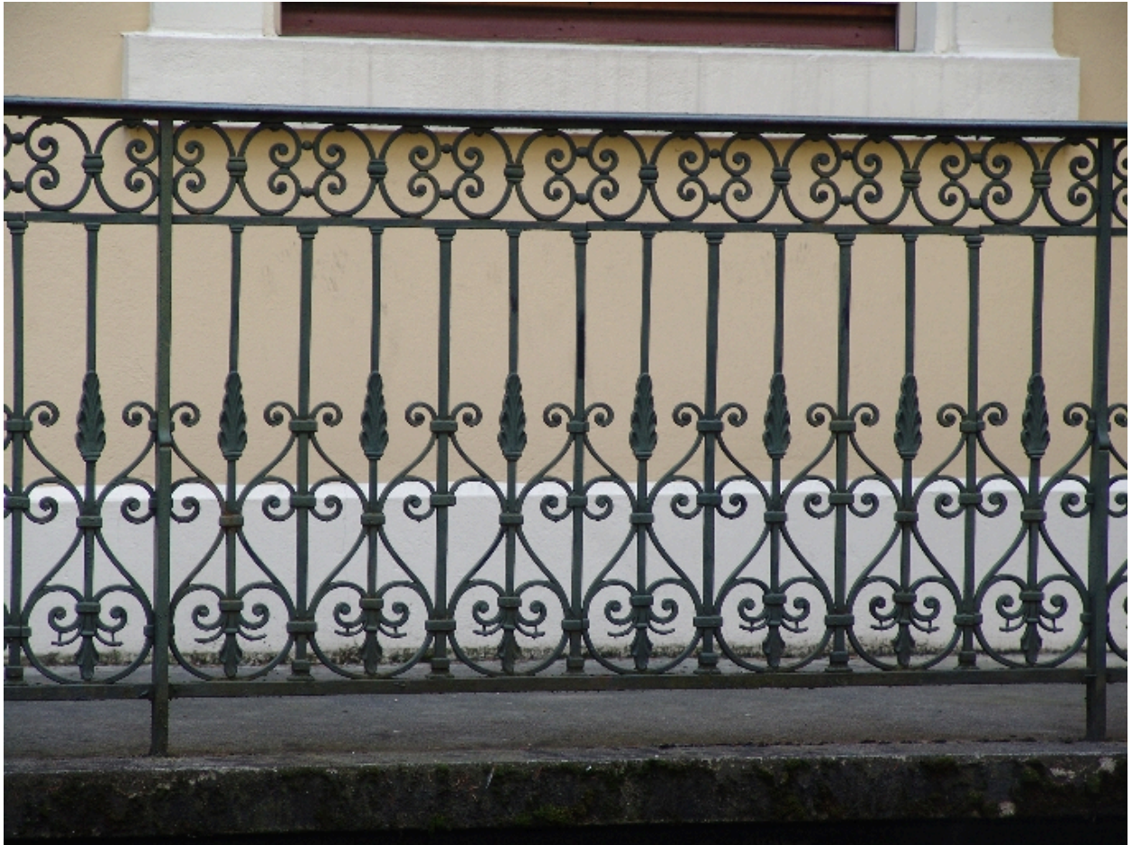
Garde-corps d'une passerelle