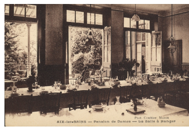
Pension de Dames : la salle à manger IVR82_20047300221NUCB