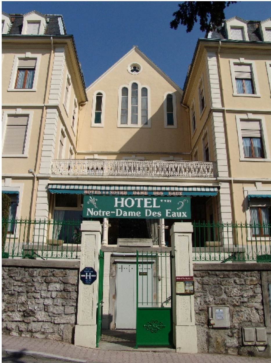
Façade : travée centrale