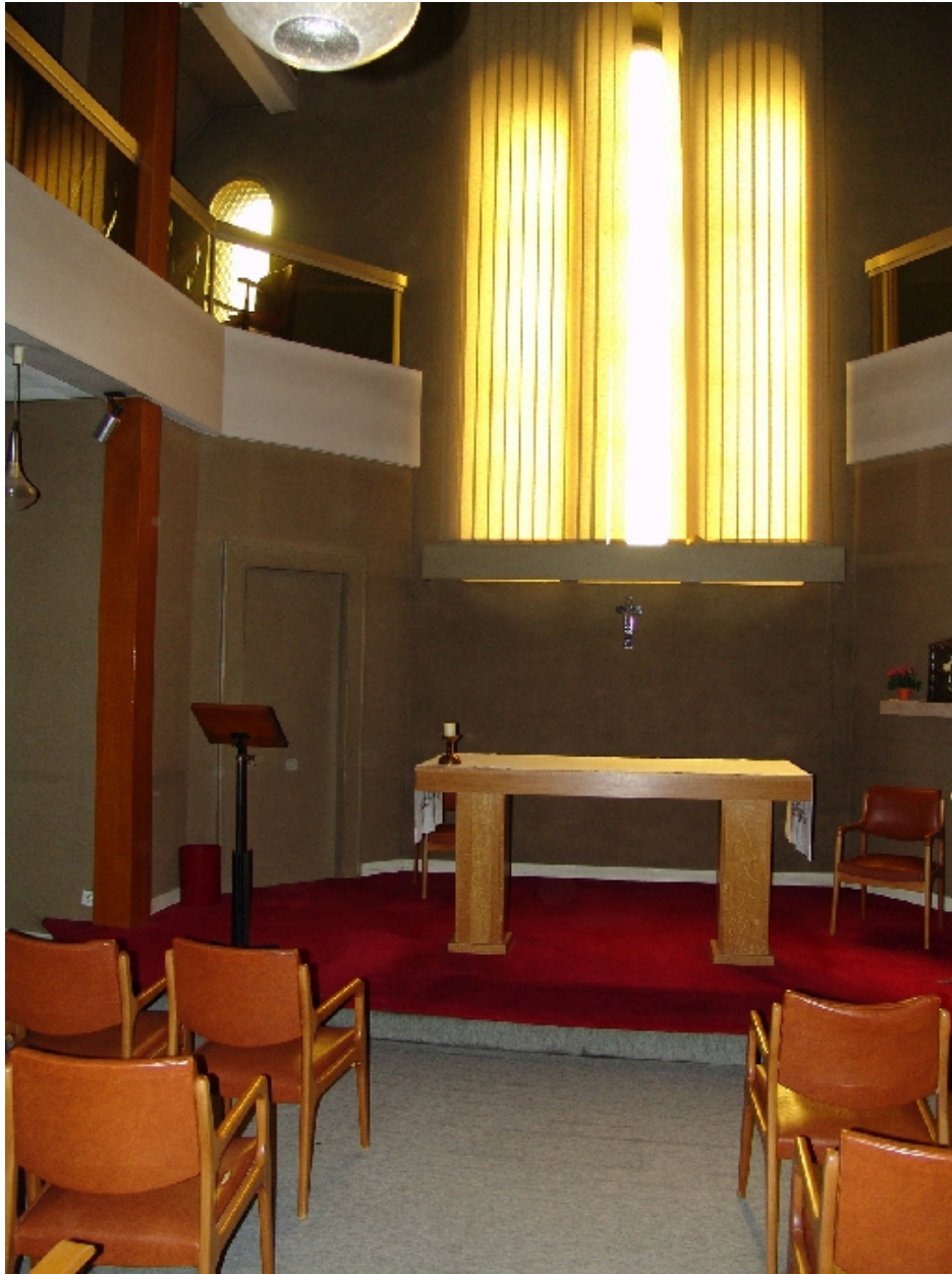
Chapelle : vue intérieure