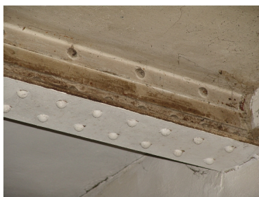
Détail d'une poutrelle métallique