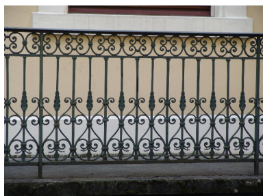
Garde-corps d'une passerelle IVR82_20057300788NUCA