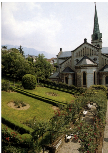
Vue du jardin IVR82_20047300219NUCA