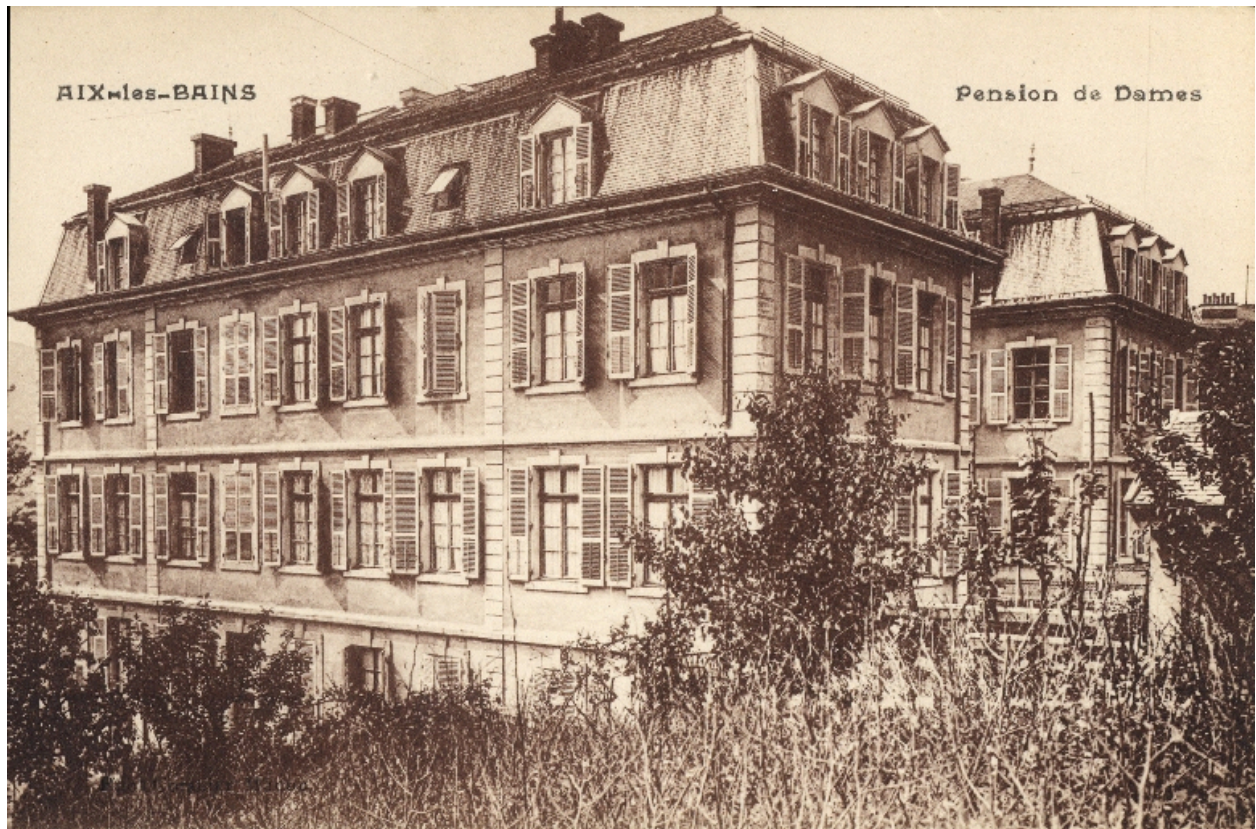
Pension de Dames : vue d'ensemble