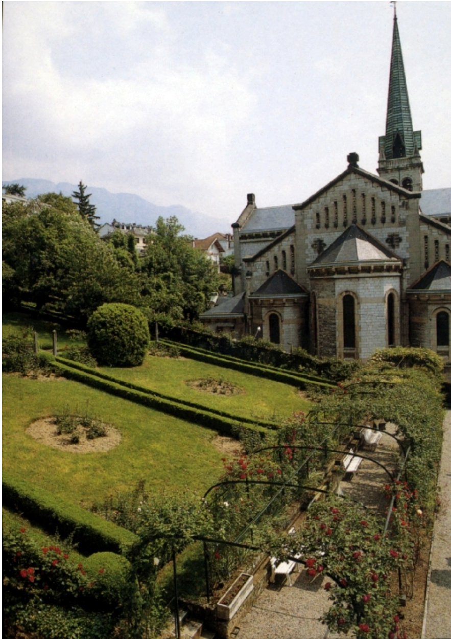
Vue du jardin