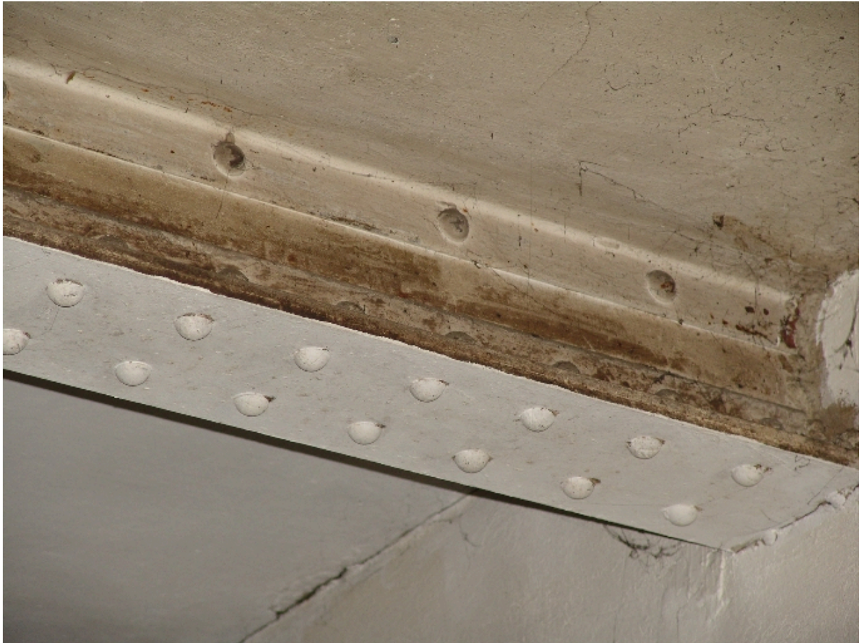
Détail d'une poutrelle métallique