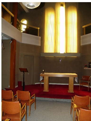
Chapelle : vue intérieure IVR82_20057300786NUCA