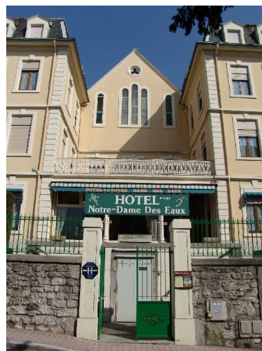
Façade : travée centrale IVR82_20057300784NUCA