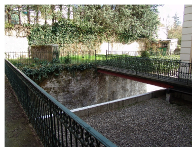
Passerelles IVR82_20057300787NUCA