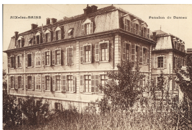
Pension de Dames : vue d'ensemble