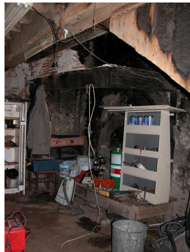
Fournil : vue d'ensemble du four à pain. IVR82_20144200328NUCA