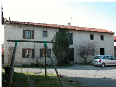
Vue d'ensemble du logis.

L'HOPITAL-le-GRAND (Loire) - Ferme des Aureaux.