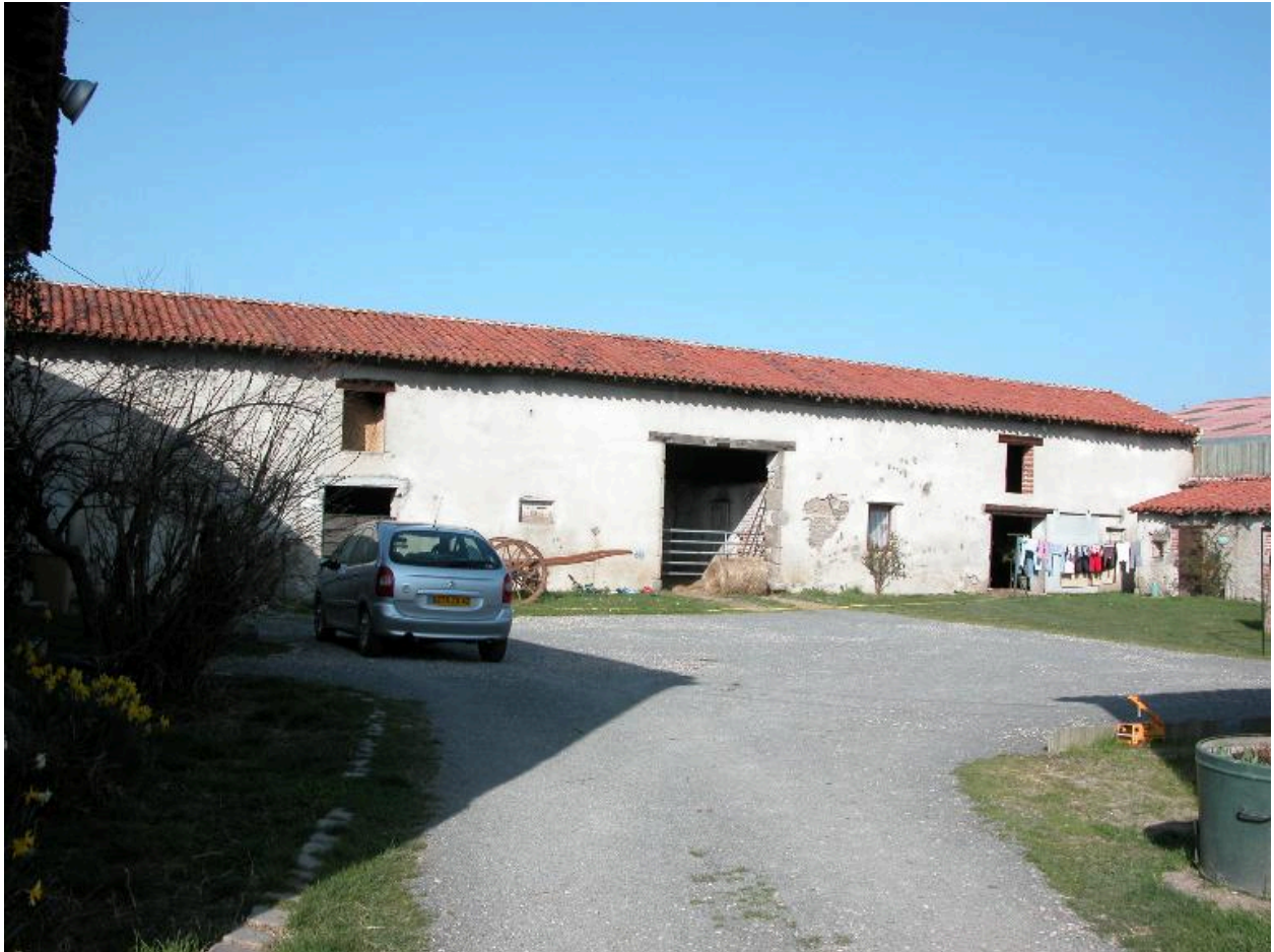
Vue d'ensemble de la grange-étable.