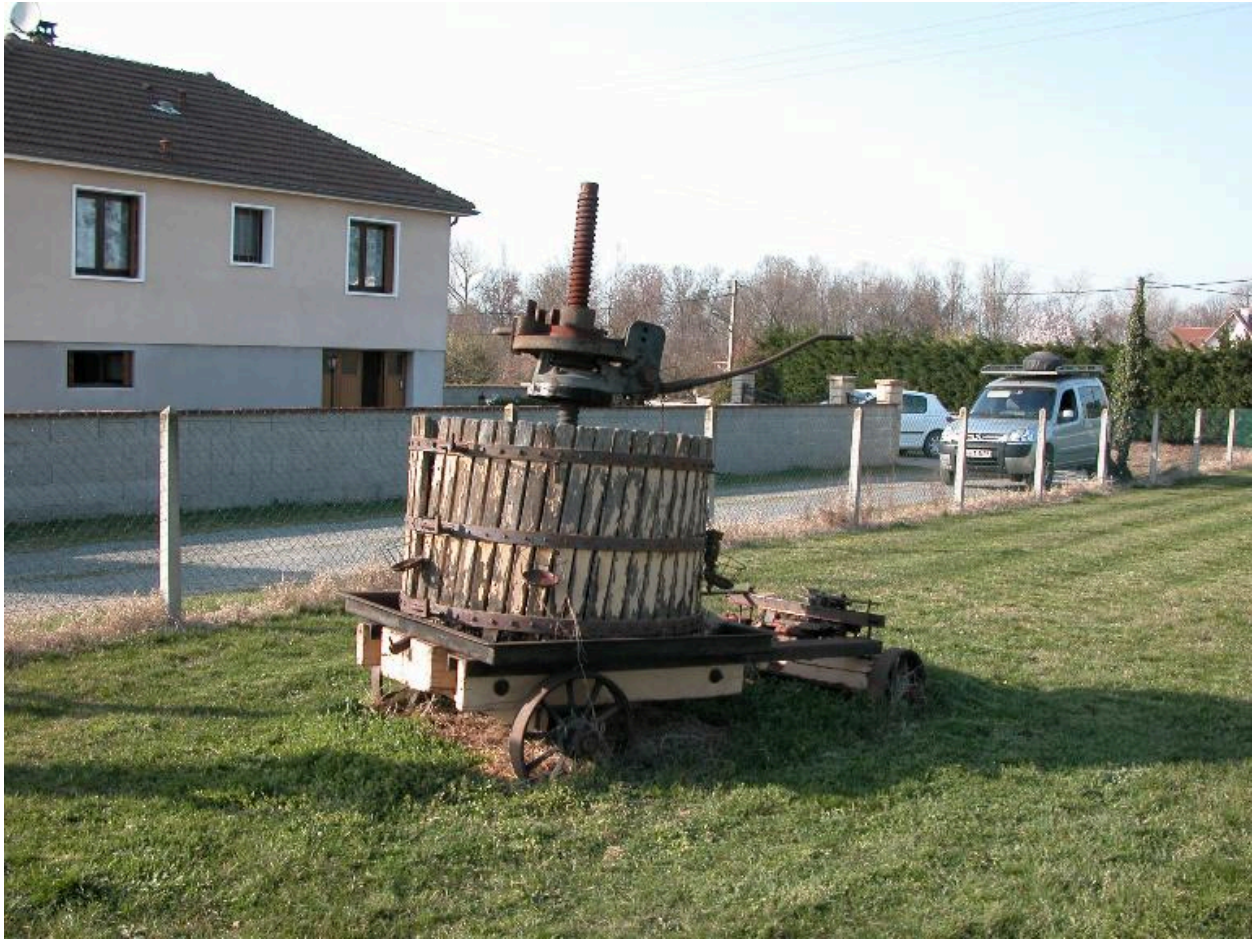
Exemple de pressoir mobile.