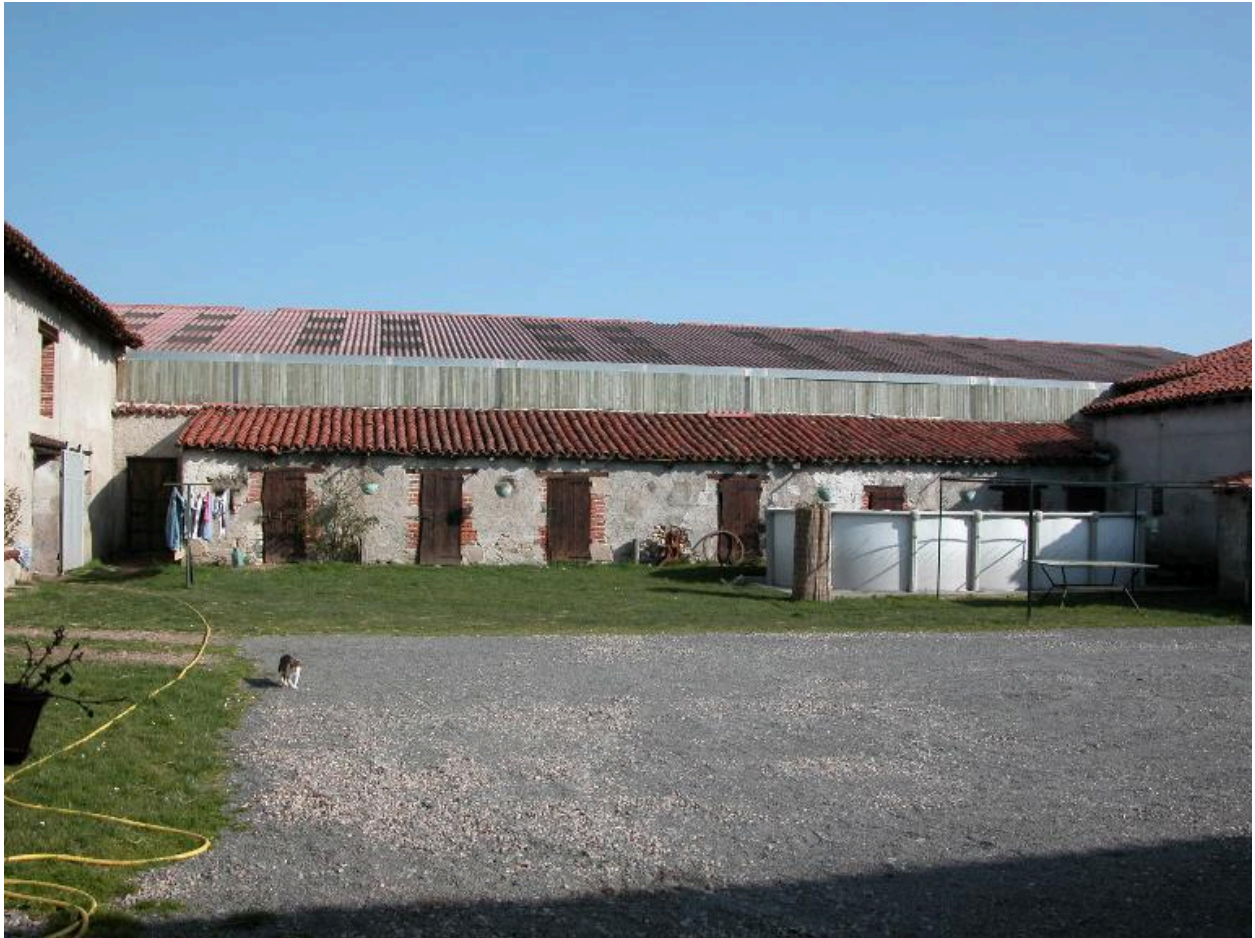
Vue d'ensemble de la porcherie.