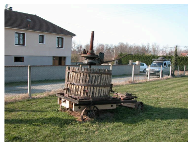
Exemple de pressoir mobile.