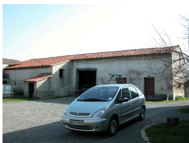
Vue d'ensemble de la seconde grange-étable.