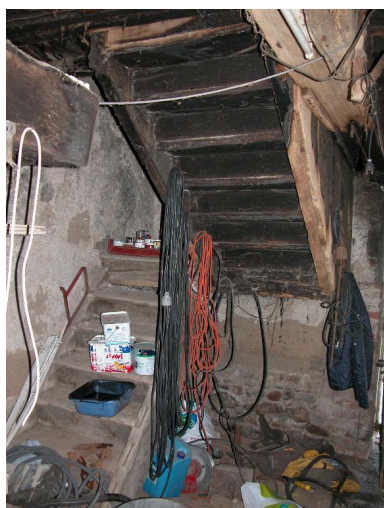
Fournil : vue d'ensemble de l'escalier. IVR82_20144200329NUCA