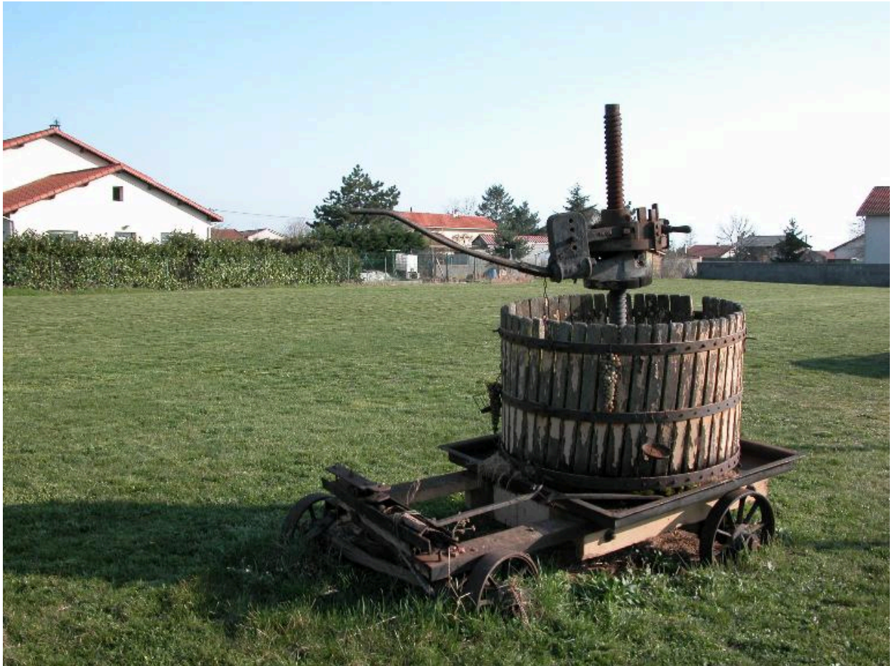
Exemple de pressoir mobile.