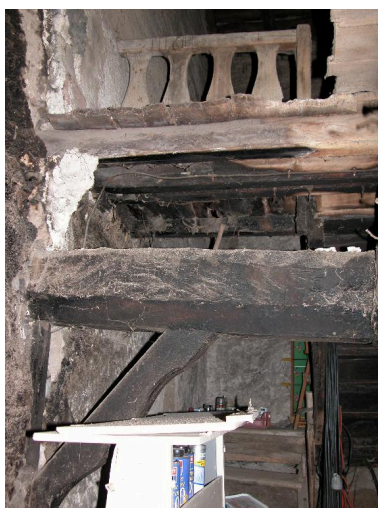
Fournil : vue d'ensemble intérieure IVR82_20144200330NUCA