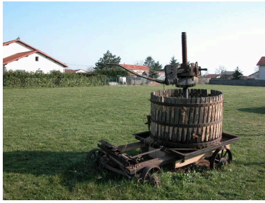
Exemple de pressoir mobile.