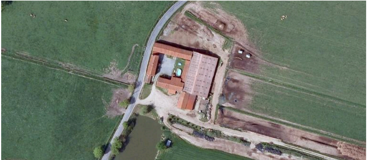
Vue aérienne de la ferme des Horods.