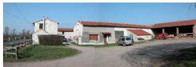
Vue panoramique de la ferme depuis le sud-ouest.

L'HOPITAL-le-GRAND (Loire) - Ferme des Aureaux.