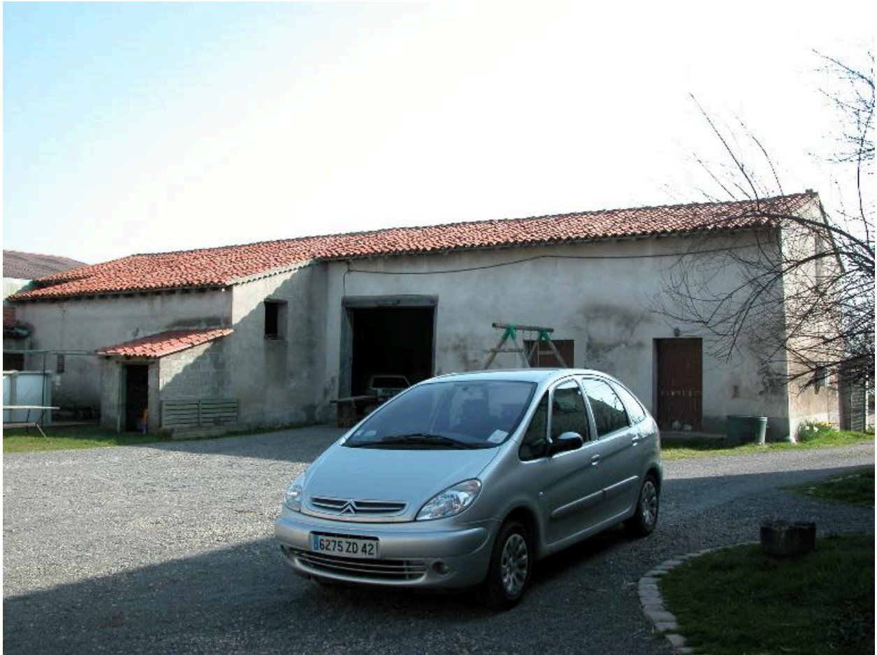
Vue d'ensemble de la seconde grange-étable.