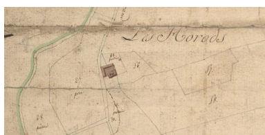
Plan de situation ancien de la ferme, cadastre 1808.