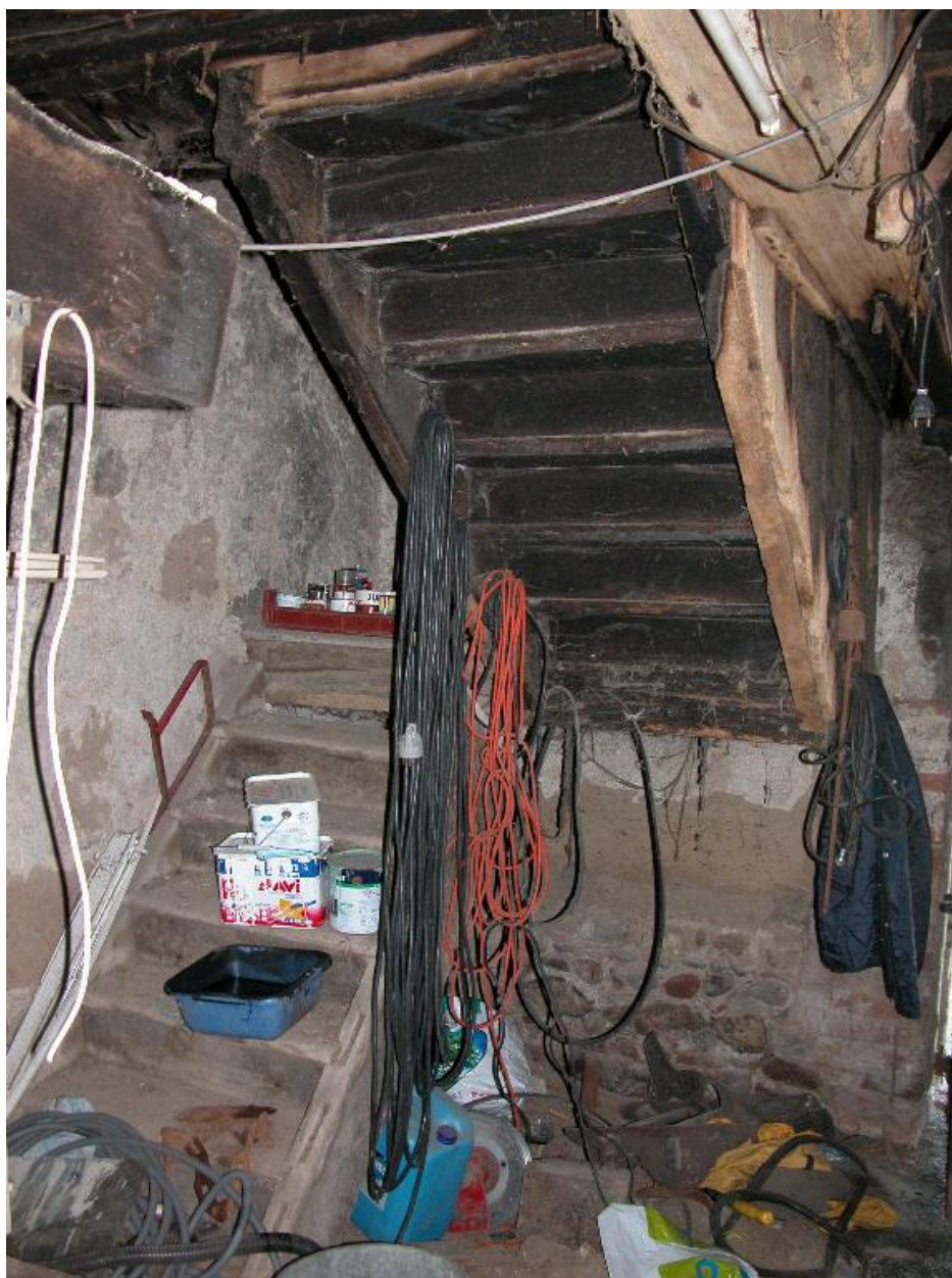
Fournil : vue d'ensemble de l'escalier.