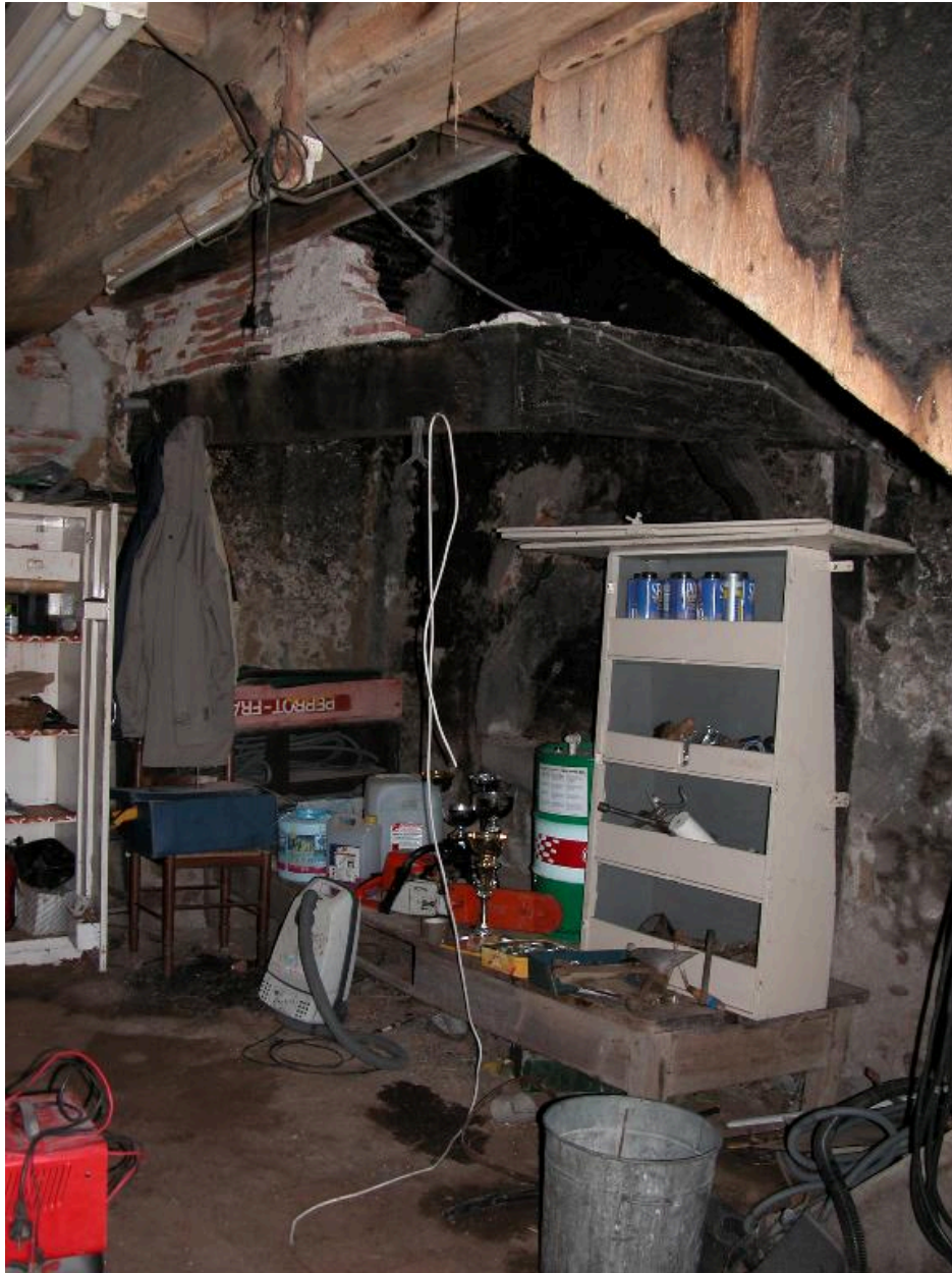
Fournil : vue d'ensemble du four à pain.