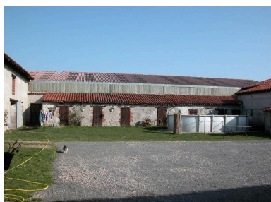
Vue d'ensemble de la porcherie. IVR82_20144200332NUCA