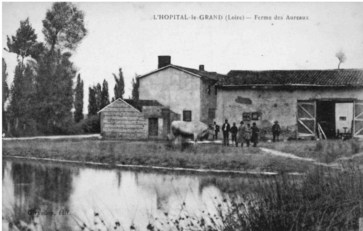
L'HOPITAL-le-GRAND (Loire) - Ferme des Aureaux.