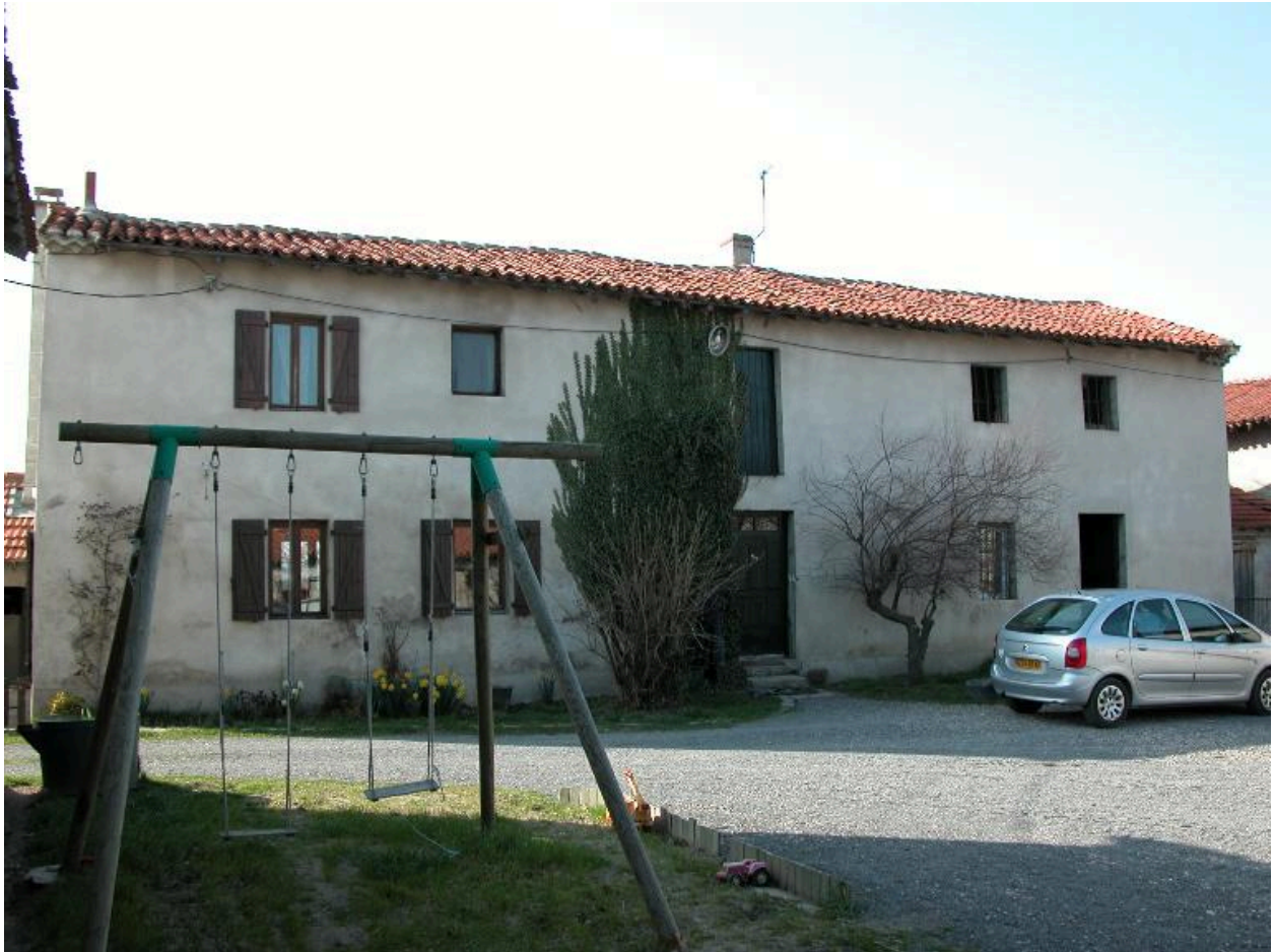
Vue d'ensemble du logis.