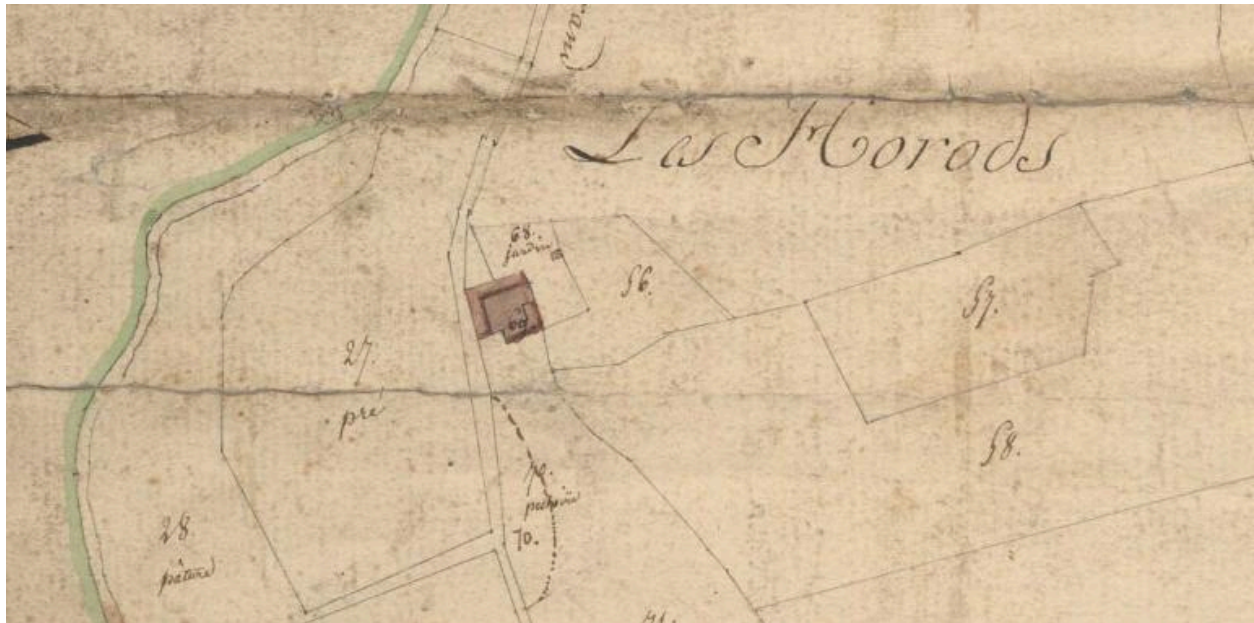
Plan de situation ancien de la ferme, cadastre 1808.