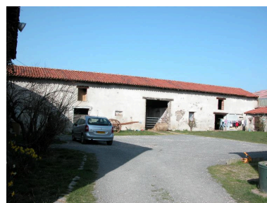
Vue d'ensemble de la grange-étable. IVR82_20144200331NUCA