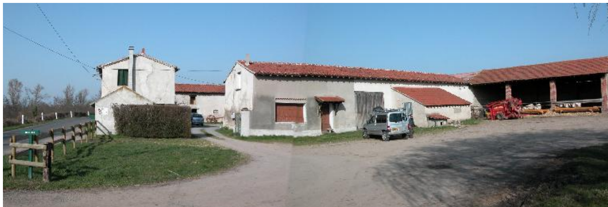
Vue panoramique de la ferme depuis le sud-ouest.