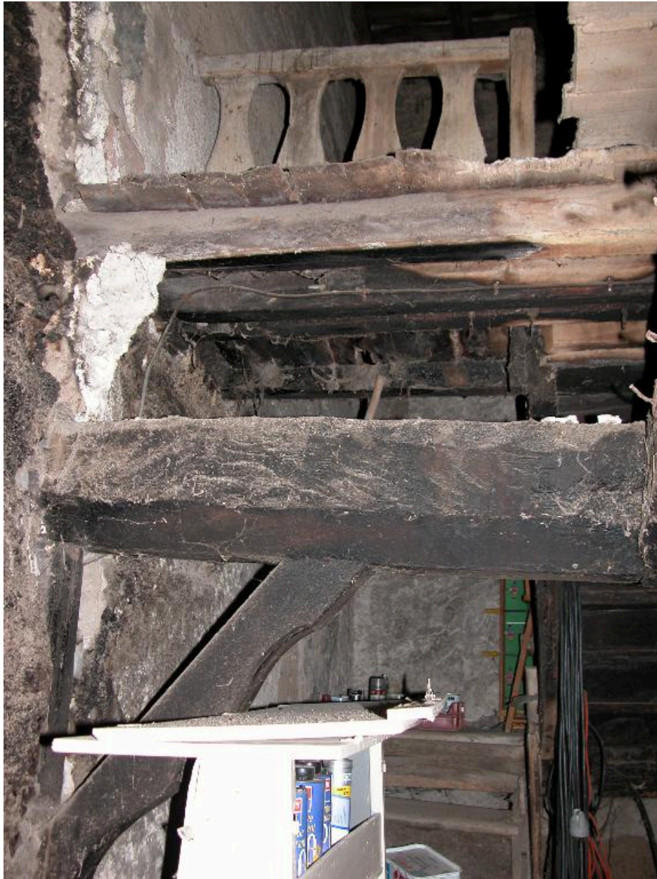
Fournil : vue d'ensemble intérieure