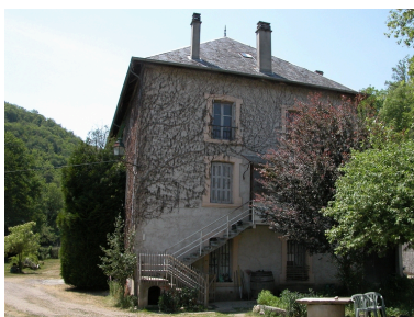
Vue du mur pignon ouest.

Plan de situation, sur fond de plan cadastral, section AT, échelle originale 1:2500. Source : Direction générale des Finances Publiques - Cadastre ; mise à jour : 2009.