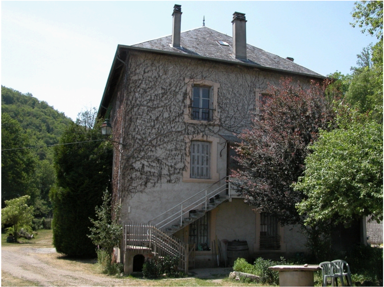
Vue du mur pignon ouest.