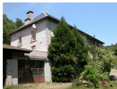
Vue d'ensemble depuis le sud-ouest. IVR82_20144200258NUCA