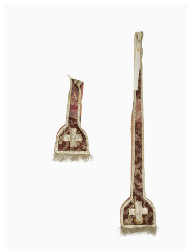
Vue de l'étole et du manipule IVR84_20181500361NUC4A