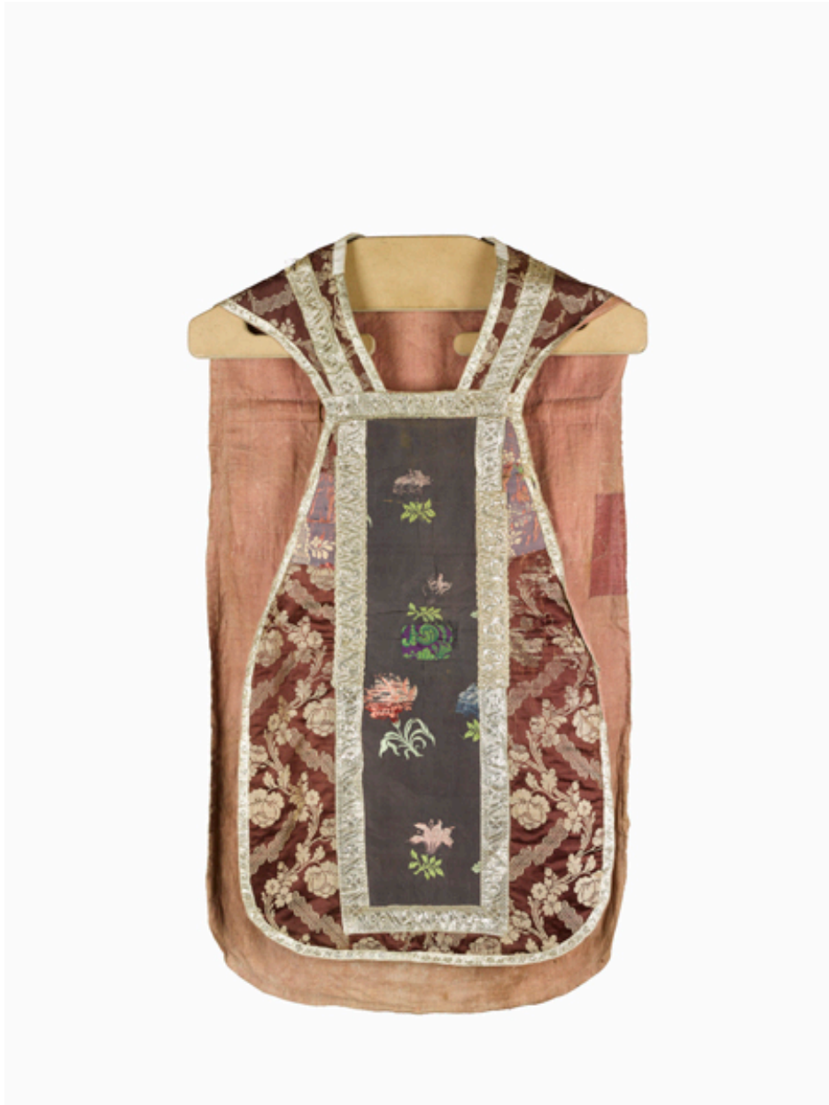
Vue du devant de la chasuble