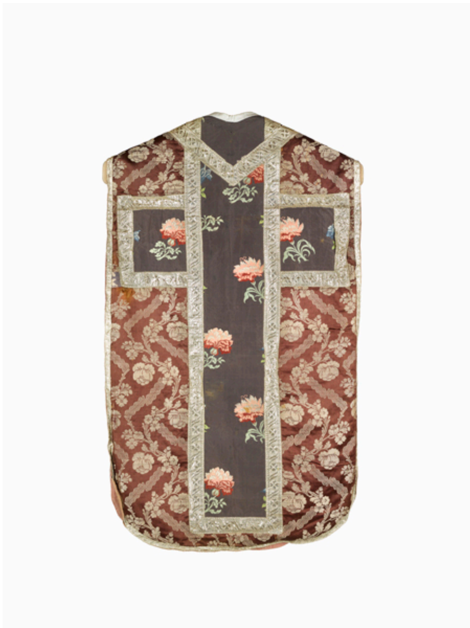
Vue du dos de la chasuble