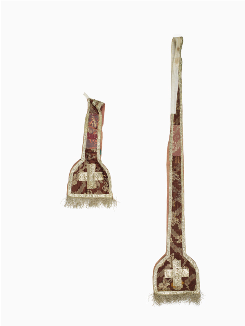
Vue de l'étole et du manipule