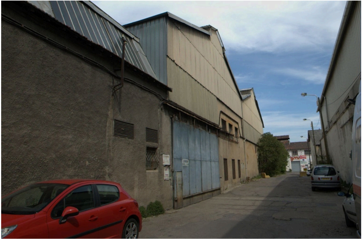
Impasse Faugier, vue ouest