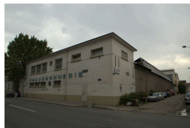
Vue sud-ouest, et enseigne IVR82_20086900495NUCA