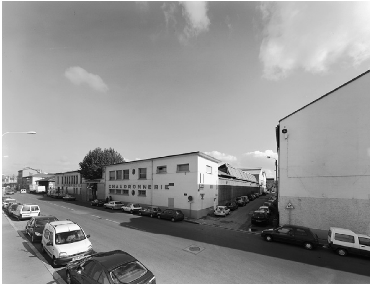
Vue générale ouest