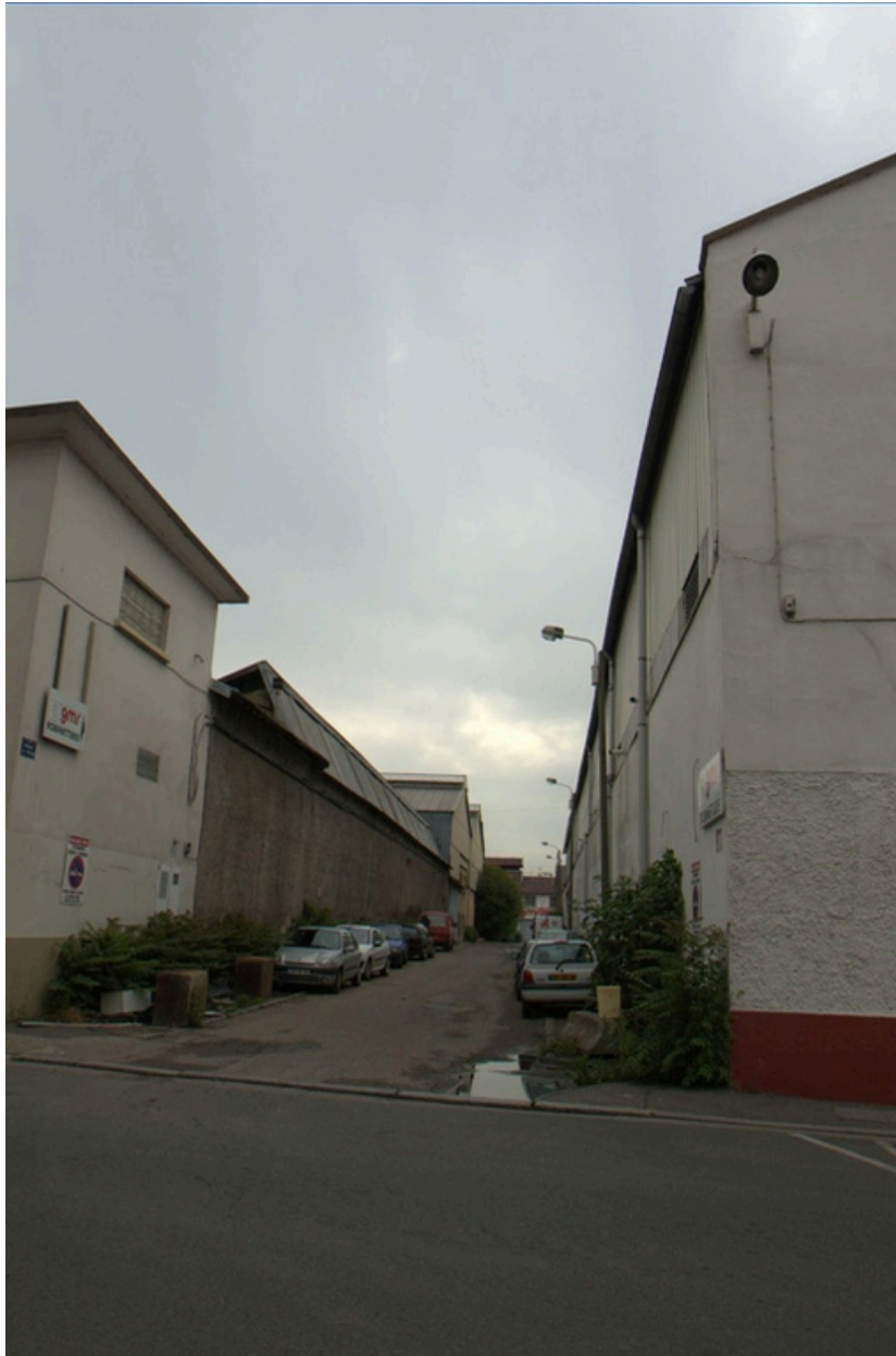
Façade sud (impasse de l'Asphalte)