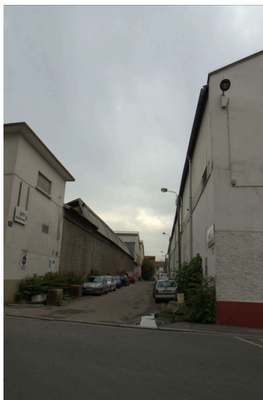
Façade sud (impasse de l'Asphalte) IVR82_20086900494NUCA