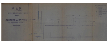
Elévations usine des alliages blancs 1950 (AC Lyon 345W217) IVR84_20246901349NUCA