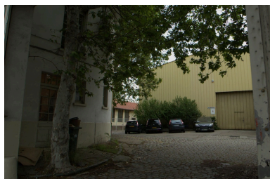
Vue sud de l'entrée IVR82_20086900493NUCA