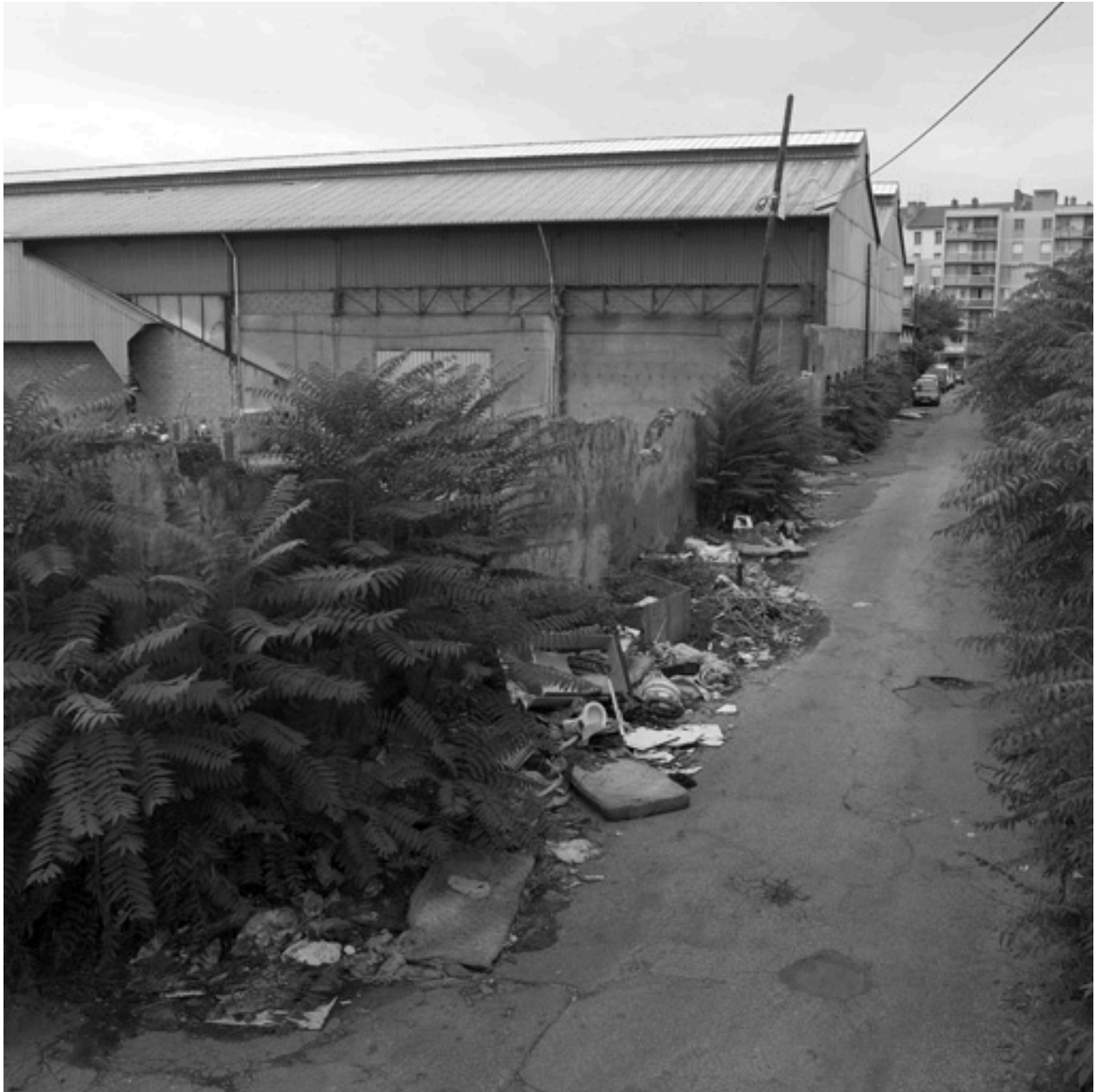
Vue est de l'impasse de l'Asphalte