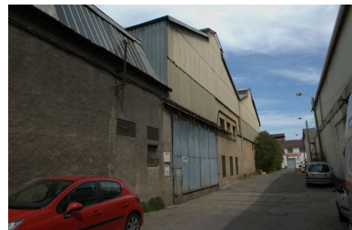
Impasse Faugier, vue ouest IVR82_20086900476NUCA