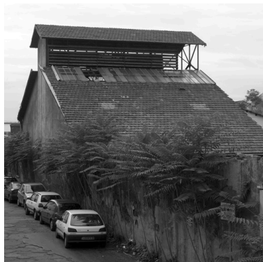
Vue sud-est de l'atelier avec aérateur en bois IVR82_20056900040NUC