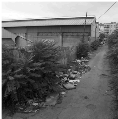
Vue est de l'impasse de l'Asphalte IVR82_20056900038NUC