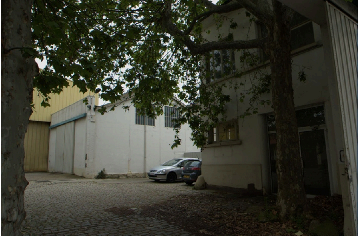
Entrée principale, cour, vue est