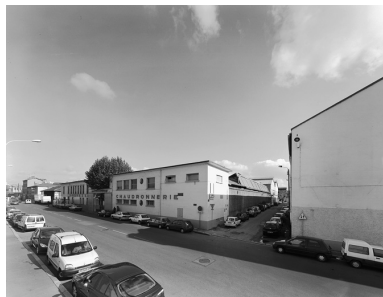
Vue générale ouest IVR82_20026904523V