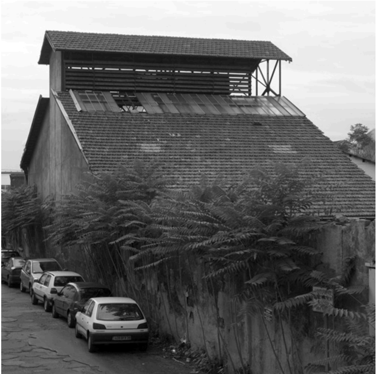
Vue sud-est de l'atelier avec aérateur en bois