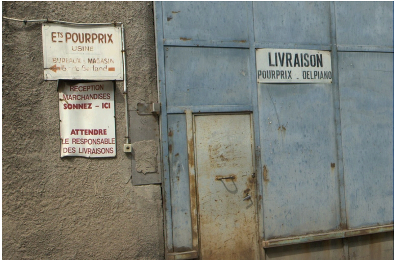
Portail livraison : enseigne