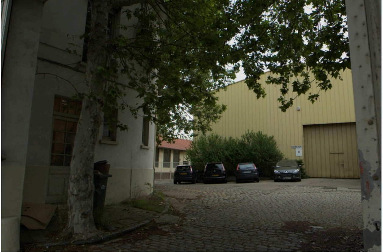
Vue sud de l'entrée