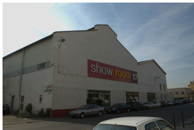
Vue nord-ouest