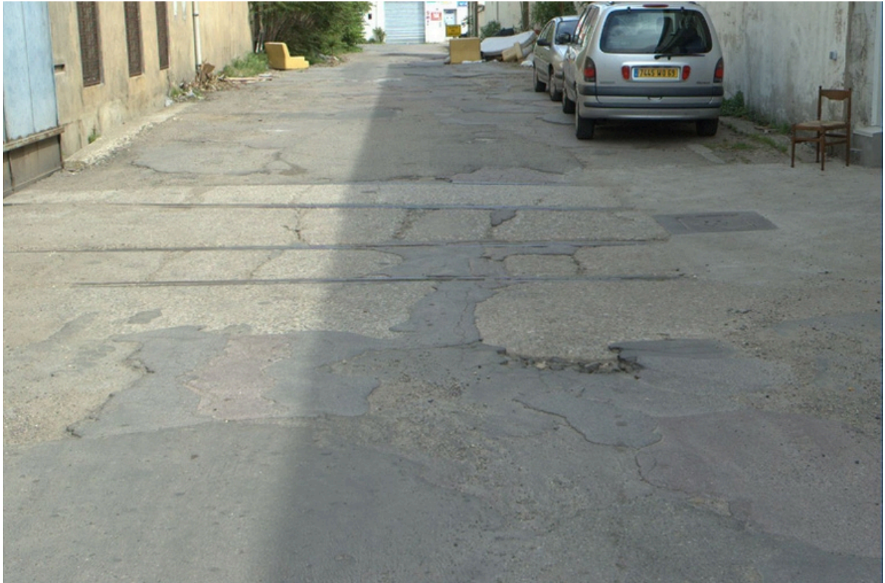
Traces de raccordement ferroviaire