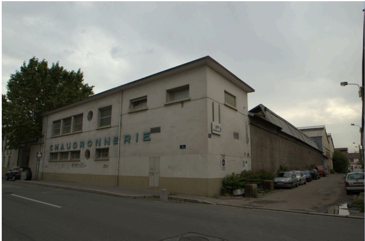
Vue sud-ouest, et enseigne