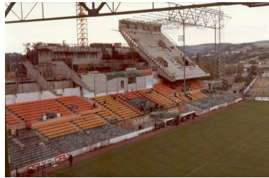
Vue générale. Rénovation du stade IVR82_20094201012NUCA