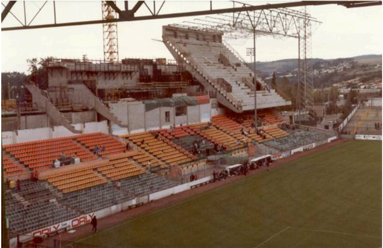
Vue générale. Rénovation du stade