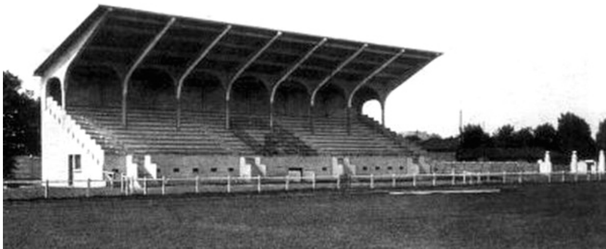
Vue de la tribune en 1931.