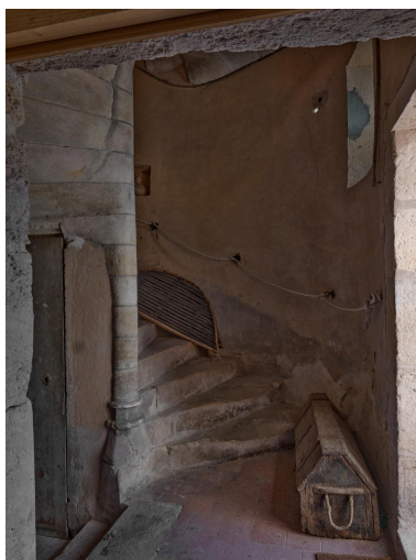
Vue de la base de l'escalier en vis.