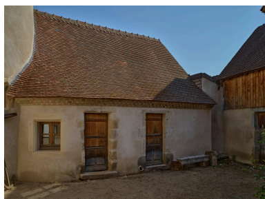
Vue de détail de la façade méridionale côté cour après restauration. IVR84_20240300265NUC4A