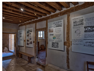
Musée, espace d'exposition n°2. IVR84_20240300263NUC4A