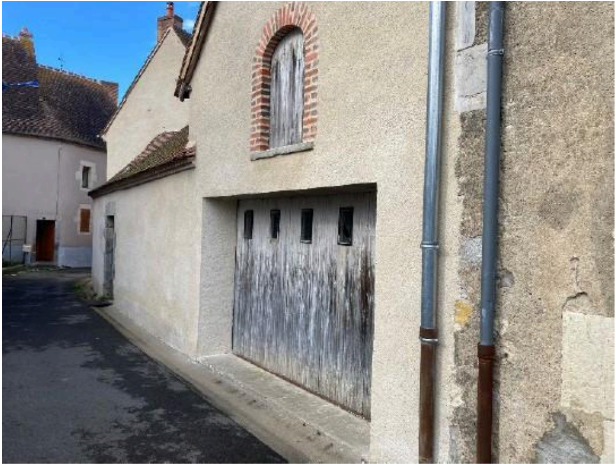
Détail du pignon du bâtiment de la parcelle 1341 sur la rue du Trou Gandou, actuellement salle d'exposition et de la construction sur la parcelle 1120. En 2024, avant restauration de 2025.