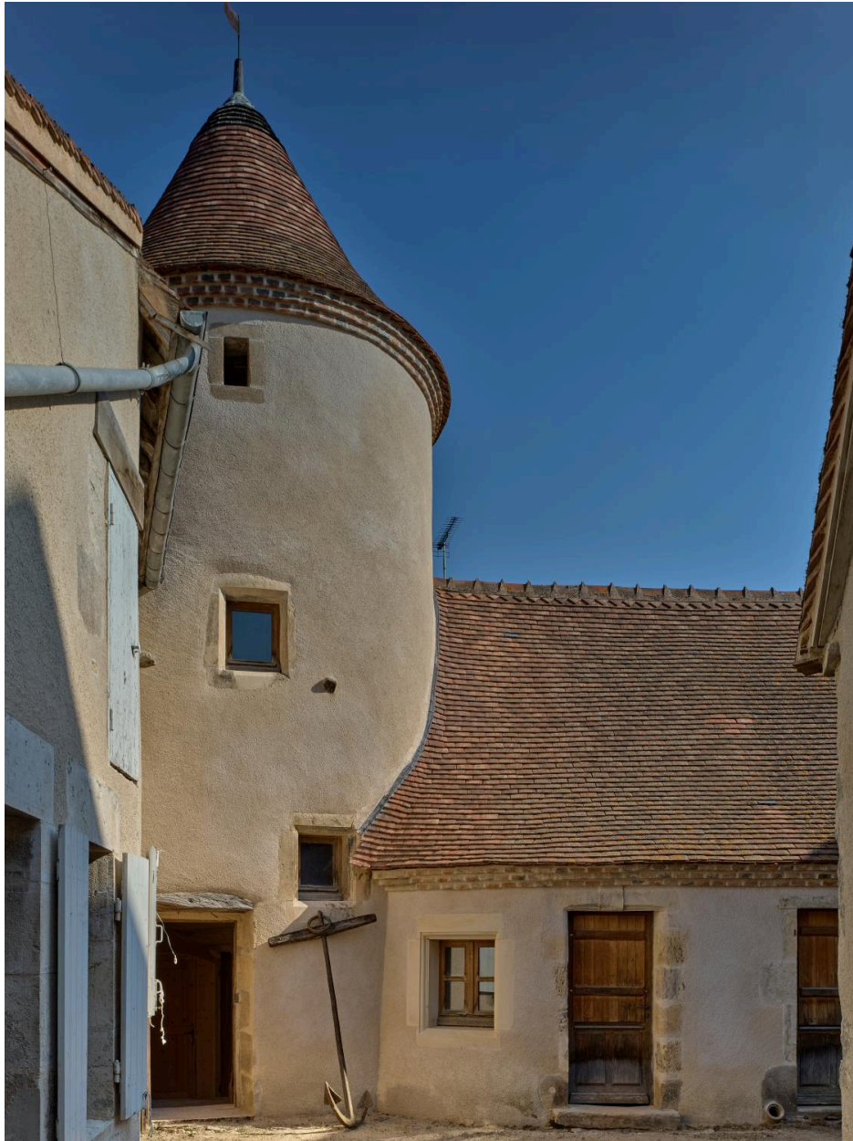
Vue de détail de la façade méridionale du bâtiment côté cour après restauration.