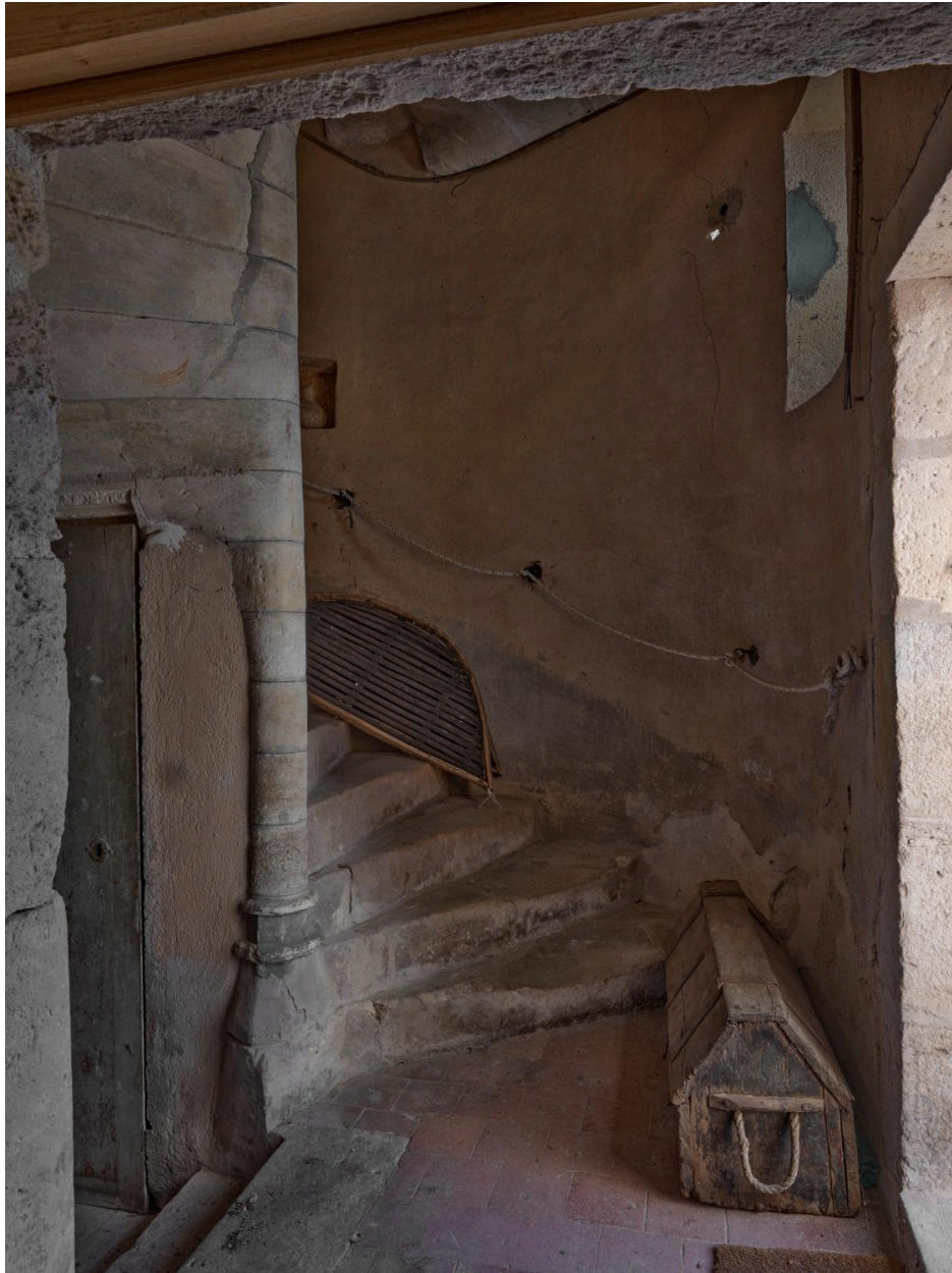
Vue de la base de l'escalier en vis.