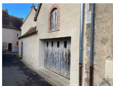
Détail du pignon du bâtiment de la parcelle 1120 sur la rue du Trou Gandou, actuellement salle d'exposition et de la construction sur la parcelle 1120. En 2024, avant restauration de 2025. IVR84_20260300388NUCA