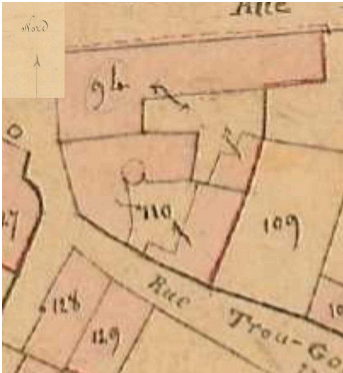
Extrait du plan cadastral dit napoléonien : AD03 : 3P3151, 1831