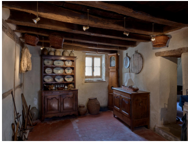
Musée, espace d'exposition n°3 IVR84_20240300276NUC4A