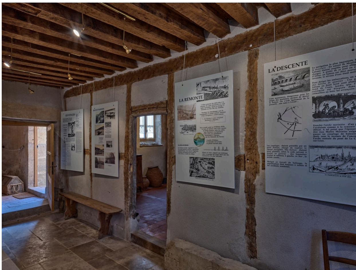
Musée, espace d'exposition n°2.