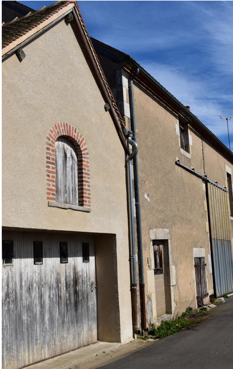
Détail du pignon du bâtiment de la parcelle 1341 sur la rue du Trou Gandou, actuellement salle d'exposition. En 2024, avant restauration de 2025.