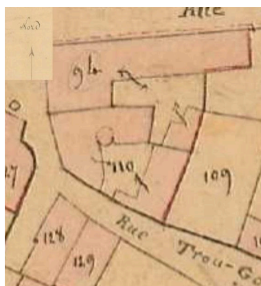
Extrait du plan cadastral dit napoléonien : AD03 : 3P3151, 1831 IVR84_20250300663NUCA