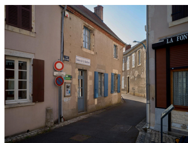
Vue de la façade sur la rue du Trou-Gandou.