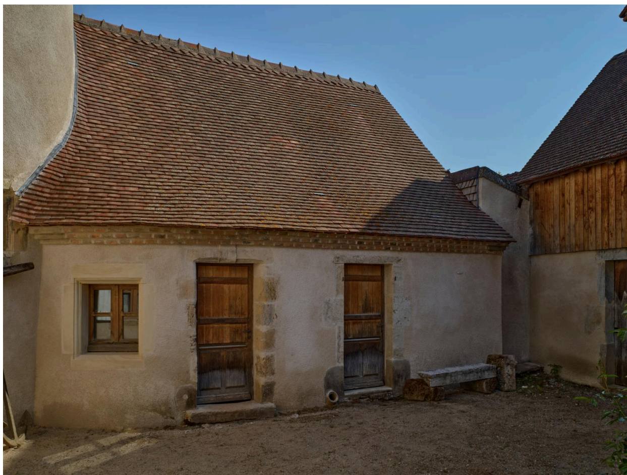
Vue de détail de la façade méridionale côté cour après restauration.