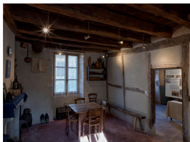
Musée, espace d'exposition n°1. IVR84_20240300260NUC4A