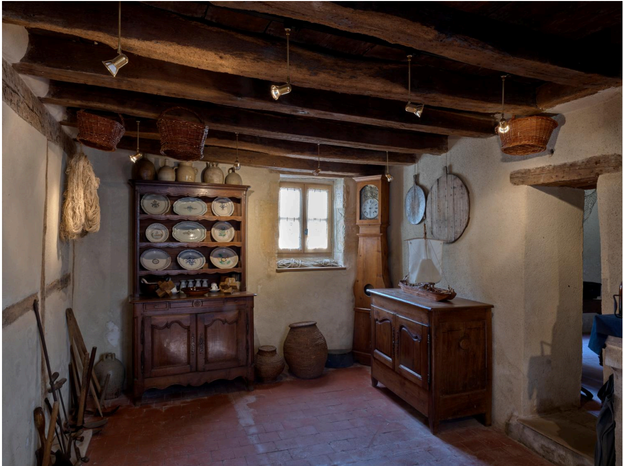
Musée, espace d'exposition n°3