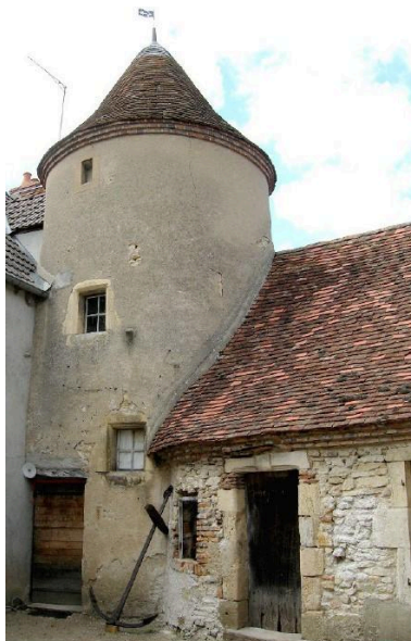
Façade méridionale du bâtiment sur cour avant restauration IVR84_20260300386NUCA