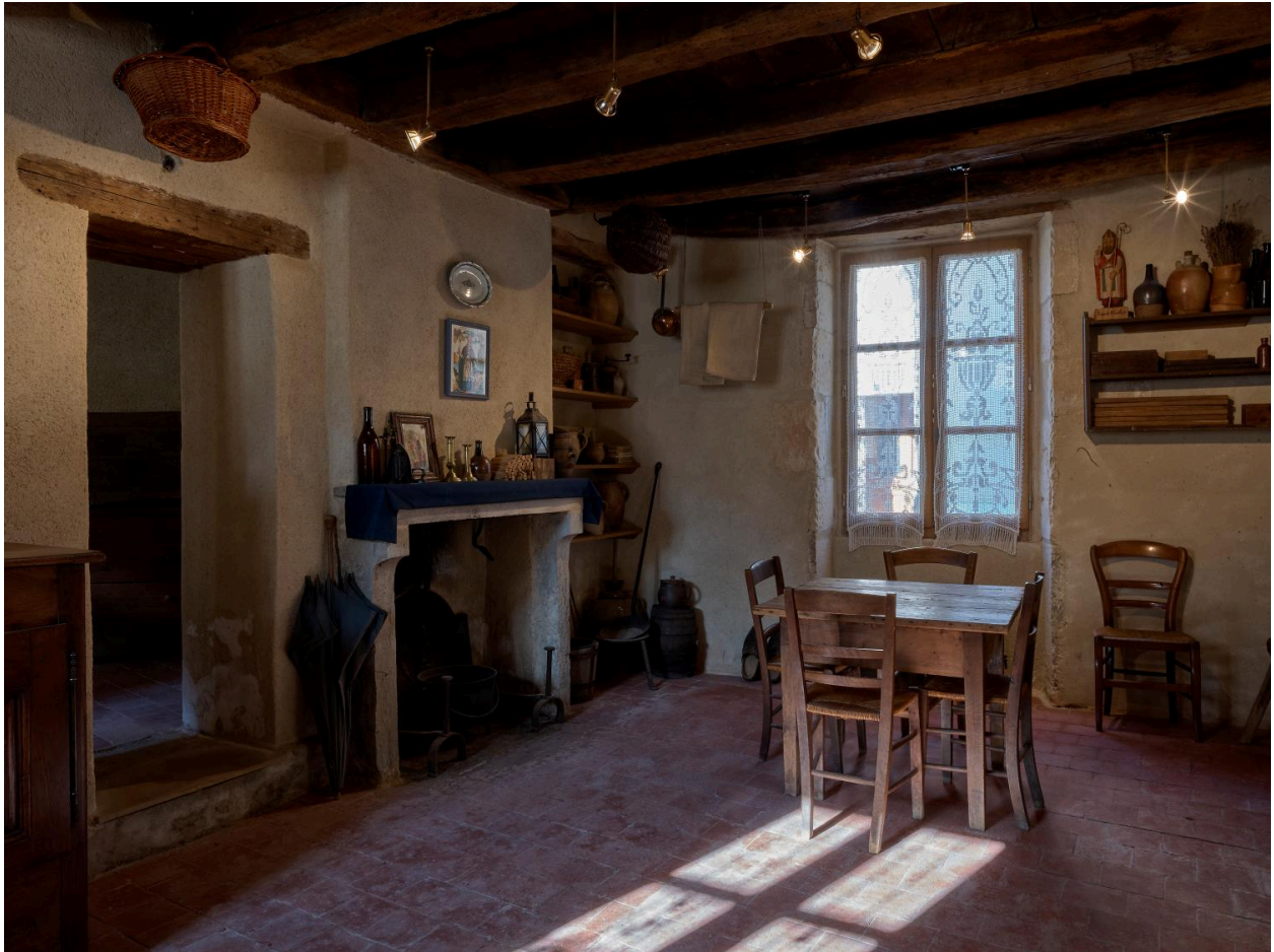
Musée, espace d'exposition n°1.