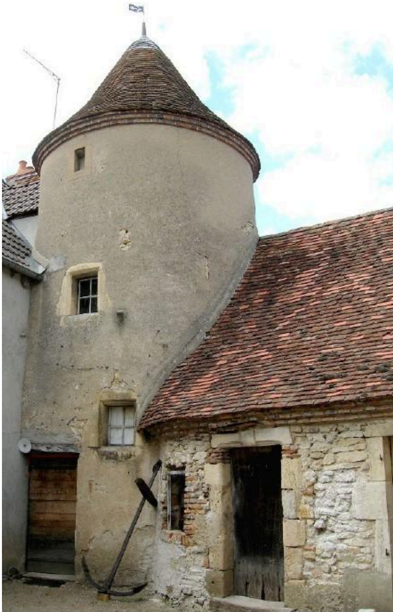
Façade méridionale du bâtiment sur cour avant restauration