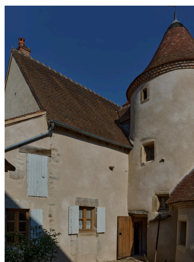
Vue de détail de l'édifice sur la cour. IVR84_20240300266NUCA4A