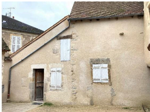
Façade est du bâtiment sur cour avant et après restauration.