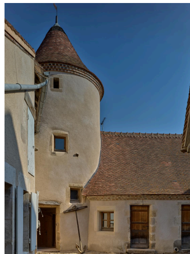
Vue de détail de la façade méridionale du bâtiment côté cour après restauration. IVR84_20240300264NUC4A