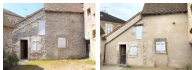
Façade est du bâtiment sur cour avant et après restauration. IVR84_20260300387NUCA