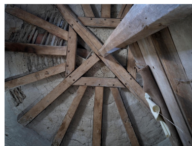
Détail de l'enrayure de la charpente conique au sommet de l'escalier.