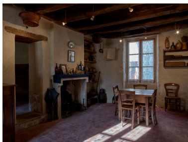
Musée, espace d'exposition n°1. IVR84_20240300261NUC4A