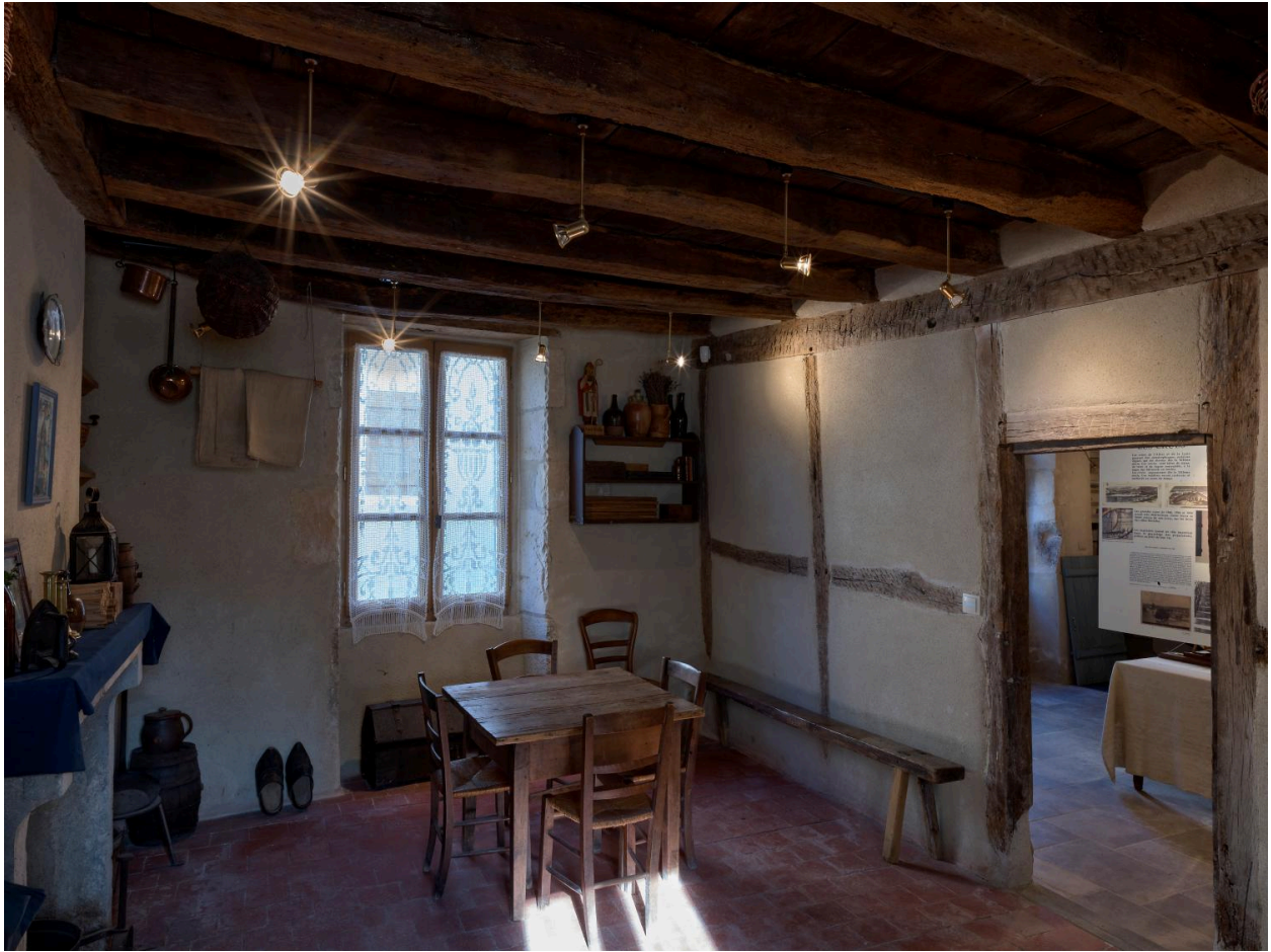
Musée, espace d'exposition n°1.