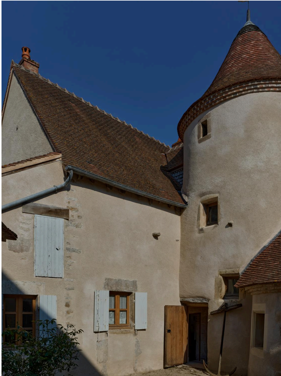
Vue de détail de l'édifice sur la cour.