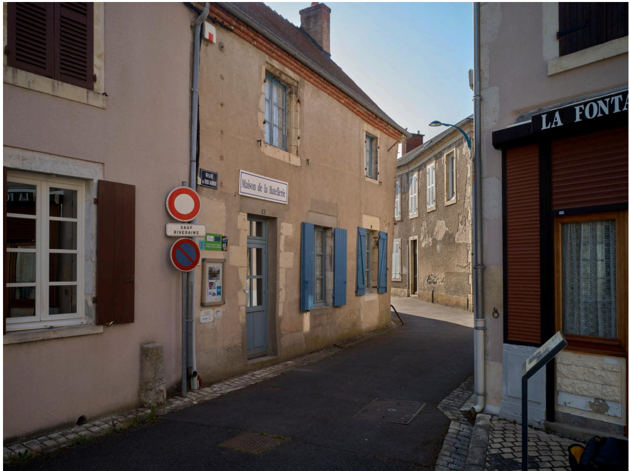
Vue de la façade sur la rue du Trou-Gandou.