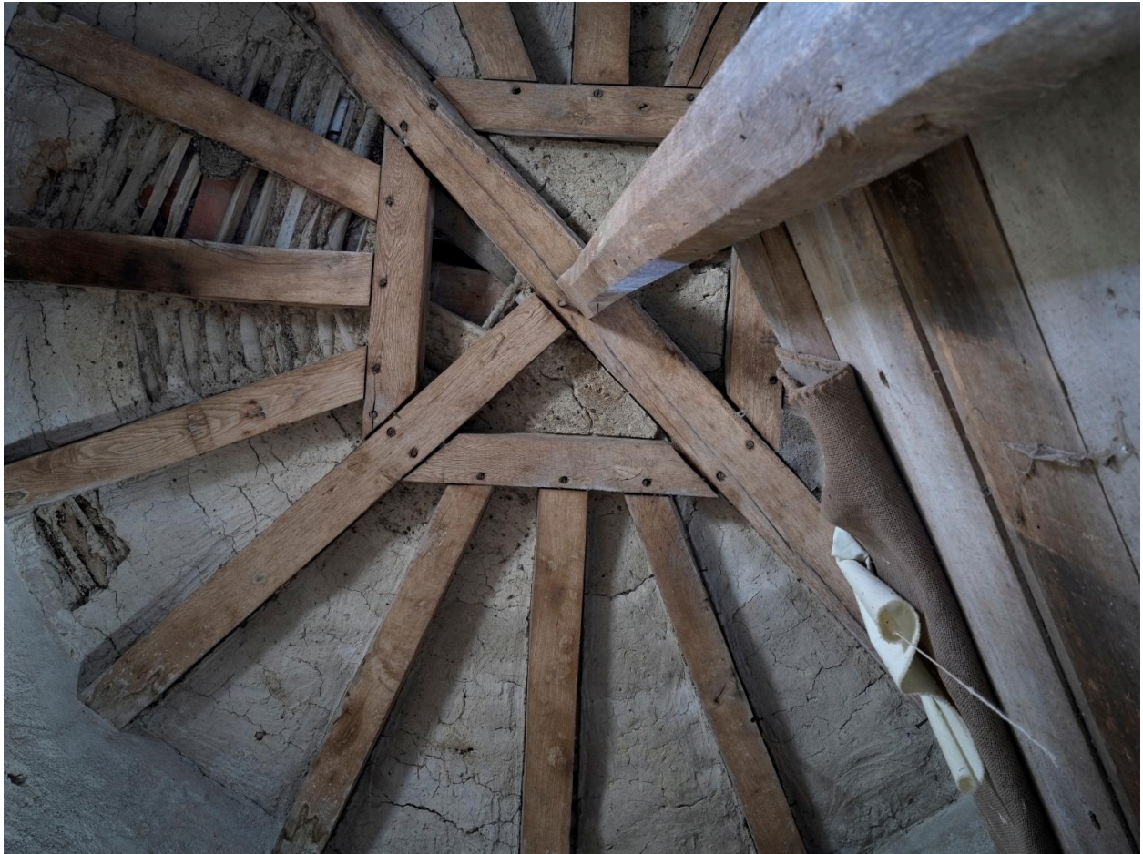
Détail de l'enrayure de la charpente conique au sommet de l'escalier.