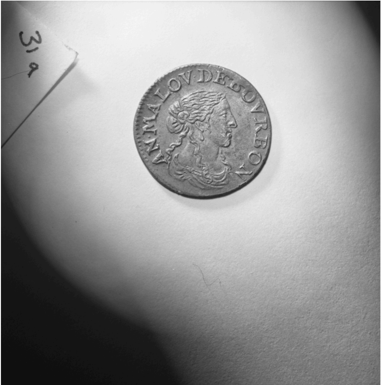
Pièces n° 85 et 86, douzième d'écu ou 5 sols, avers.