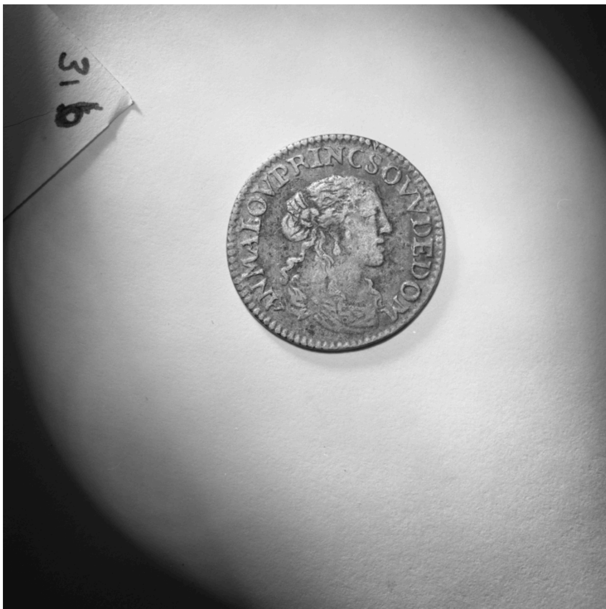
Pièces n° 81 à 83, douzième d'écu ou 5 sols, avers.