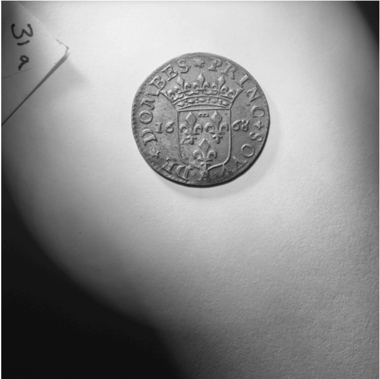
Pièces n° 85 et 86, douzième d'écu ou 5 sols, revers.