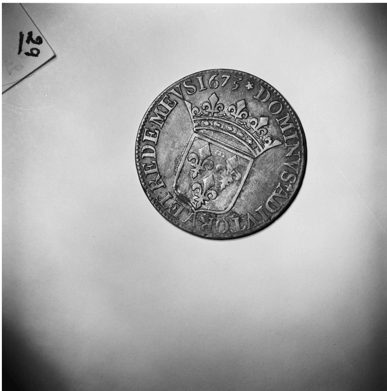
Pièce n° 80, quart d'écu, revers.