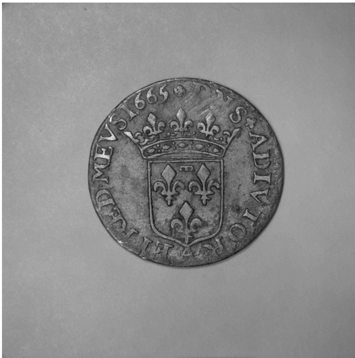
Pièce n° 84, douzième d'écu ou 5 sols, revers.