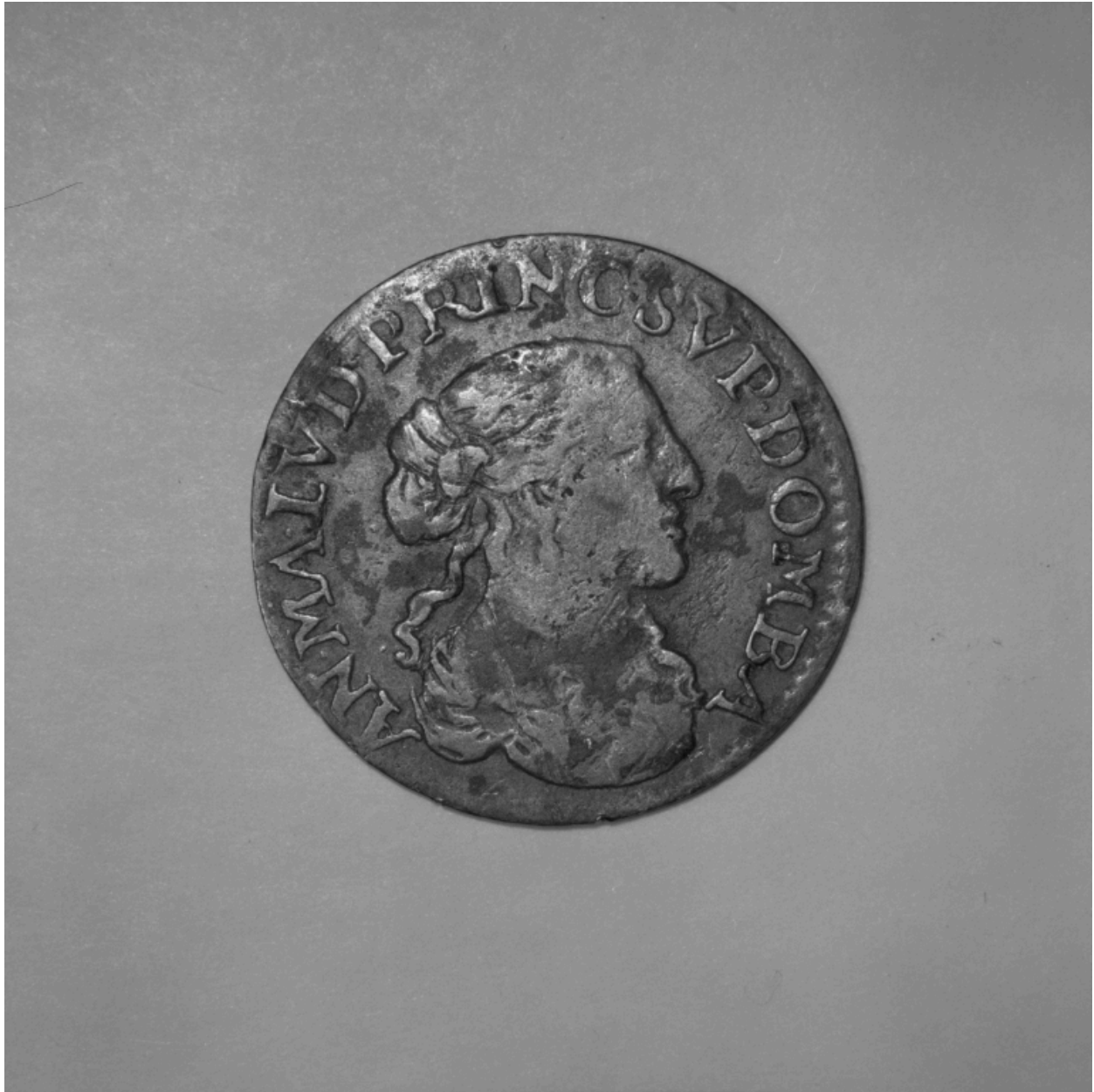
Pièce n° 84, douzième d'écu ou 5 sols, avers.