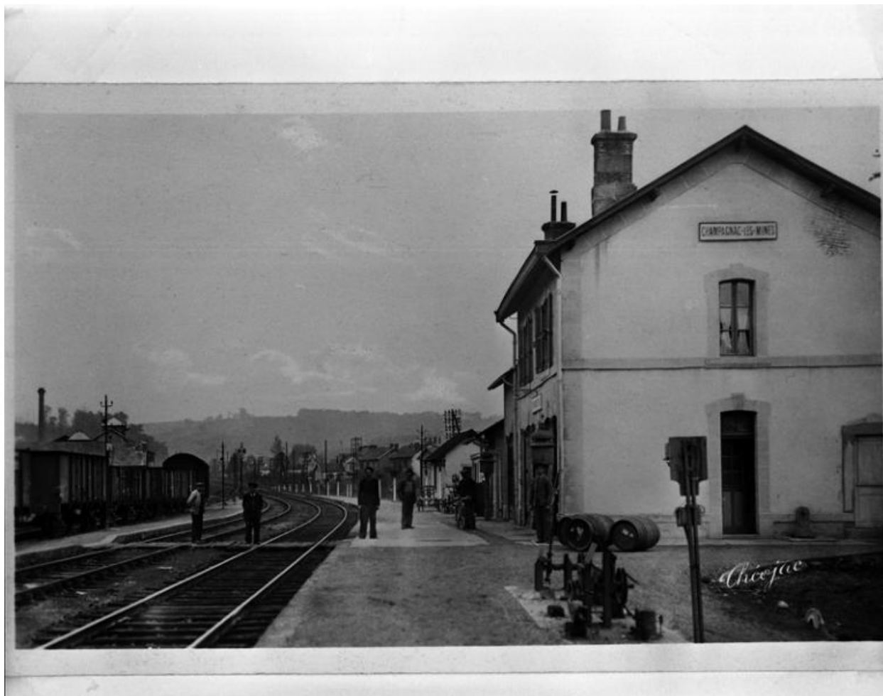
L'ancienne gare dite de Champagnac-les-Mines, à Ydes-l'Hôpital.