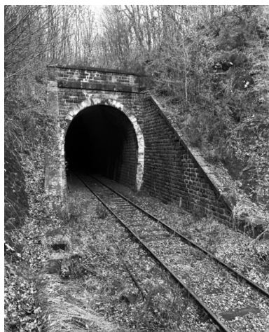
Tunnel de Prensol depuis la voie ferrée. Jusque dans les années 1920, les guides mentionnent systématiquement (souvent avec leurs longueurs respectives) les deux grands tunnels franchis par la ligne de chemin de fer à proximité de Vendes. Celui de Prensol, avec 534 m, est le plus long de deux.