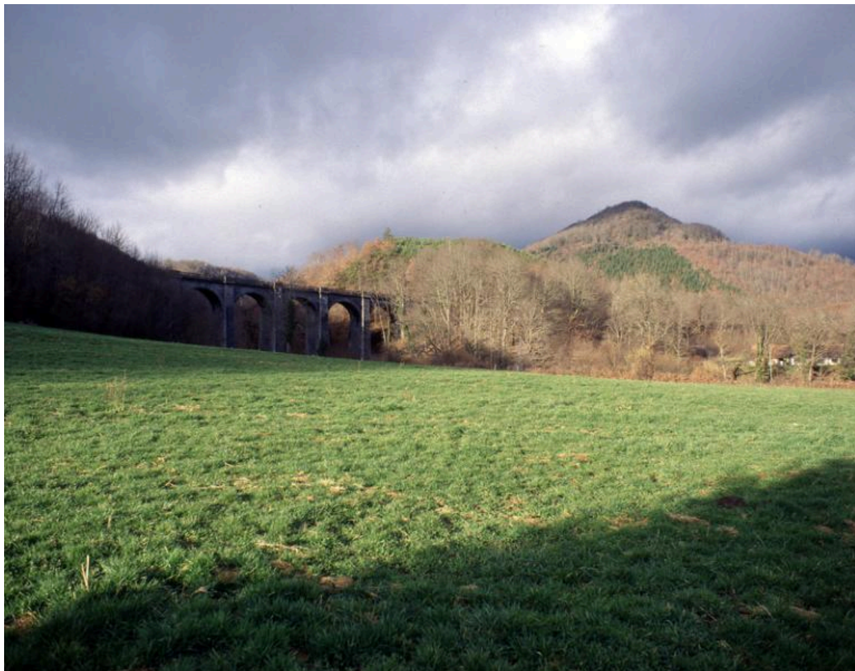
Site du viaduc ferroviaire de Bassignac. A l'arrière-plan, le puy de Frousty.