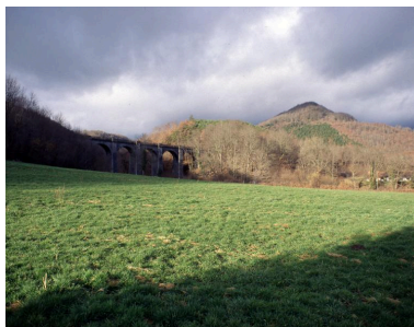
Site du viaduc ferroviaire de Bassignac. A l'arrière-plan, le puy de Frousty. IVR83_19951500356XA