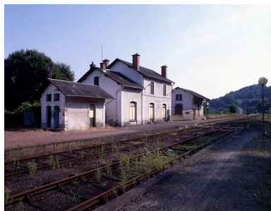
La gare dite de Champagnac à Ydes-l'Hôpital, côté voies. Champagnac est désignée par les guides de toutes les époques (jusque dans les années 1950, l'exploitation de la mine ayant cessé en 1959) comme Champagnac-les-Mines, le hameau de l'Hôpital étant au centre du bassin houiller de Champagnac.