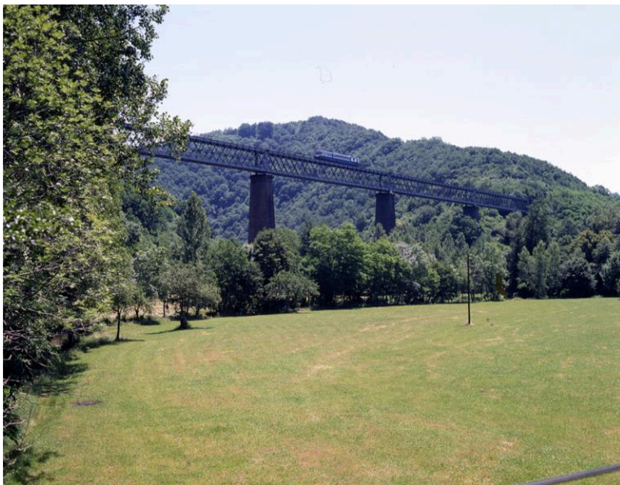
Vue du viaduc de la Sumène lors du passage de l'un des derniers trains de voyageurs, en 1994.