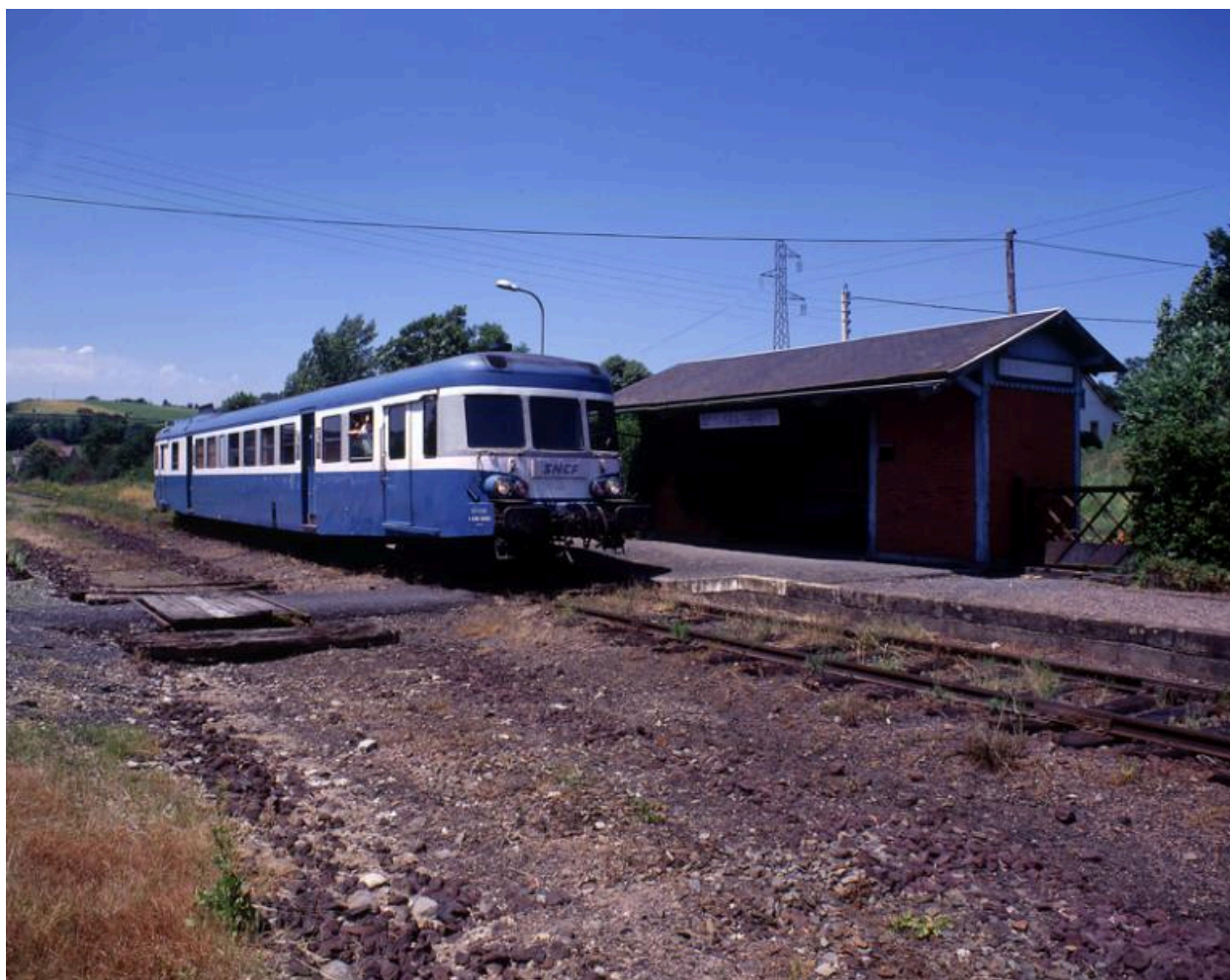
L'un des derniers trains de voyageurs en gare de Saignes - Ydes, en 1994.