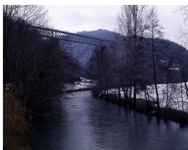
Site du viaduc ferroviaire de la Sumène, depuis les abords de la