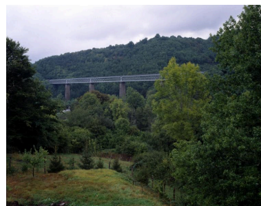
Un des ouvrages d'art de la ligne : le viaduc de la Sumène, sur la commune de Bassignac.