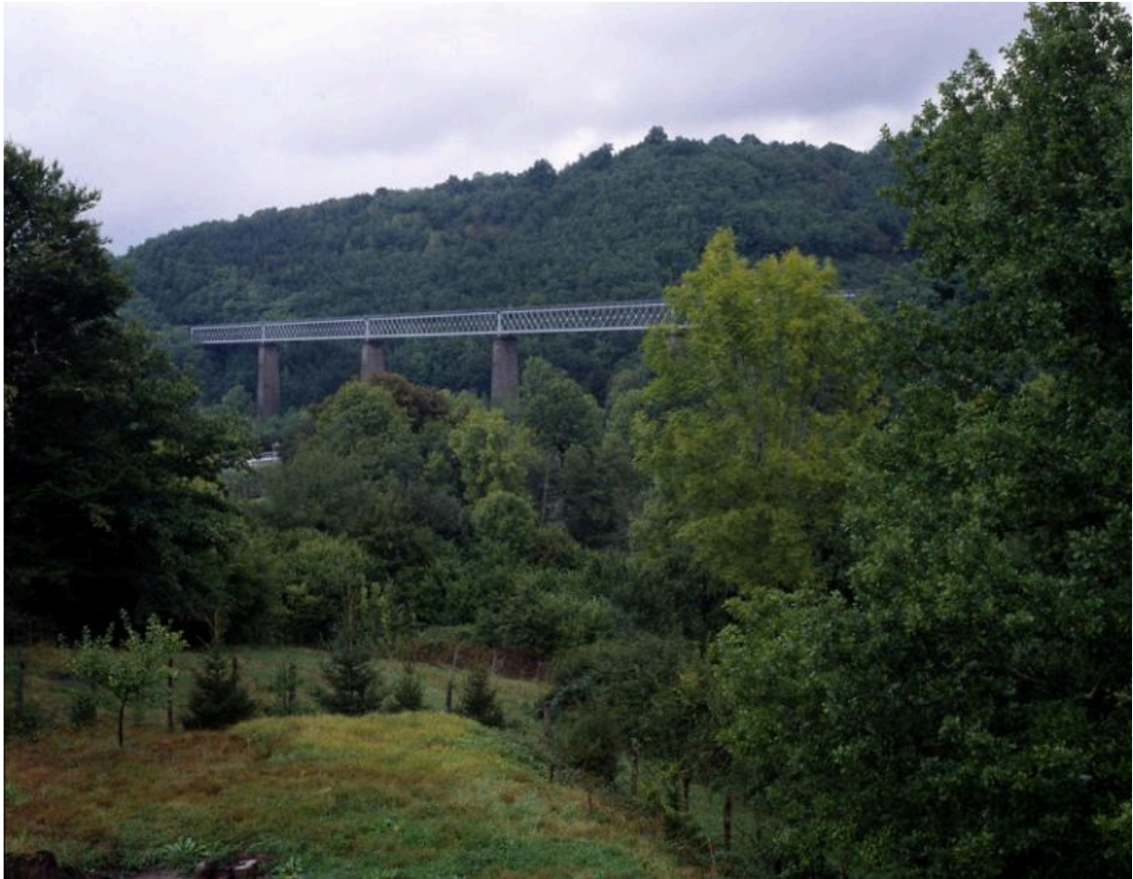
Un des ouvrages d'art de la ligne : le viaduc de la Sumène, sur la commune de Bassignac.