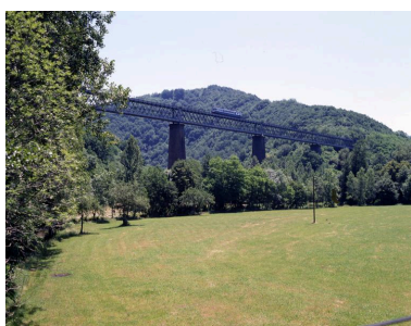
Vue du viaduc de la Sumène lors du passage de l'un des derniers trains de voyageurs, en 1994.