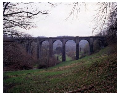
Viaduc ferroviaire de Bassignac. Aucun guide ne mentionne ce viaduc, délaissé au profit d'un autre ouvrage d'art plus important sur la Sumène, à quelques kilomètres de là (voir illustrations dans ce dossier).