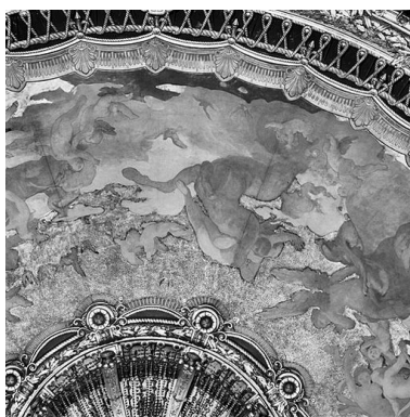
Détail de l'enlèvement d'une femme par un centaure et d'une femme ailée