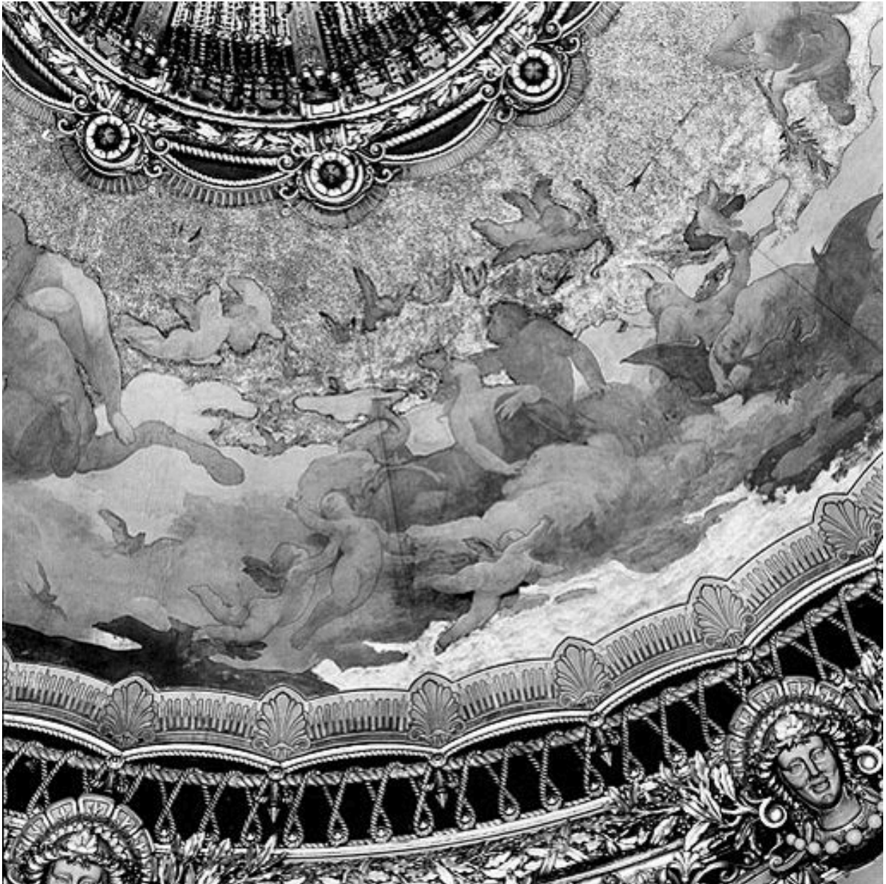
Détail des figures de la Nuit, du Rêve et de la chauve-souris ainsi que d'un couple se regardant