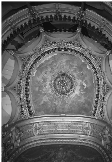
Vue générale IVR82_19786900171P