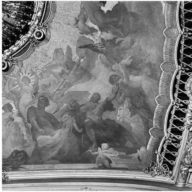
Détail des figures de Praxitèle, d'Aristophane, de la Vérité et de Mercure IVR82_19786900190X