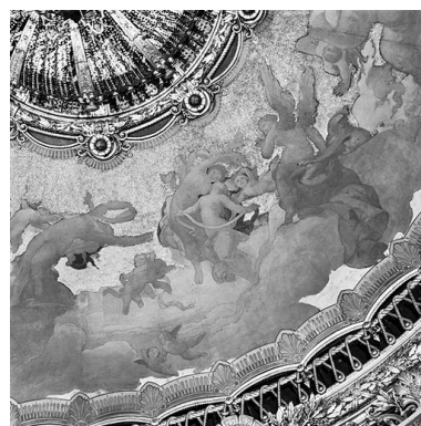
Détail d'une femme tenant un phylactère et d'une femme ailée IVR82_19786900184X