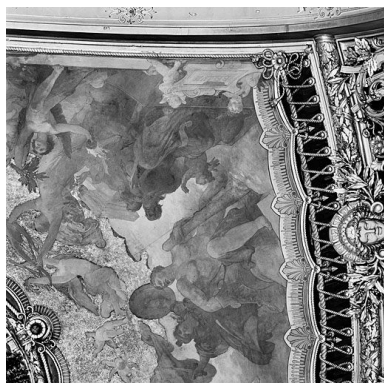
Détail des figures de la Renommée, de la Musique, d'Hercule et de Mars IVR82_19786900187X