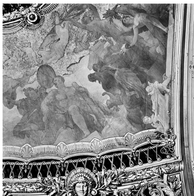
Détail des figures de la Renommée, de la Musique, d'Hercule et de Mars IVR82_19786900186X