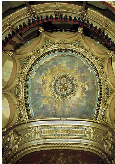
Vue générale IVR82_19786900172PA