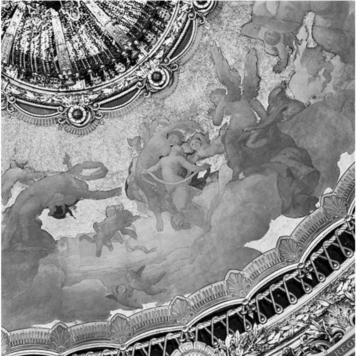
Détail d'une femme tenant un phylactère et d'une femme ailée