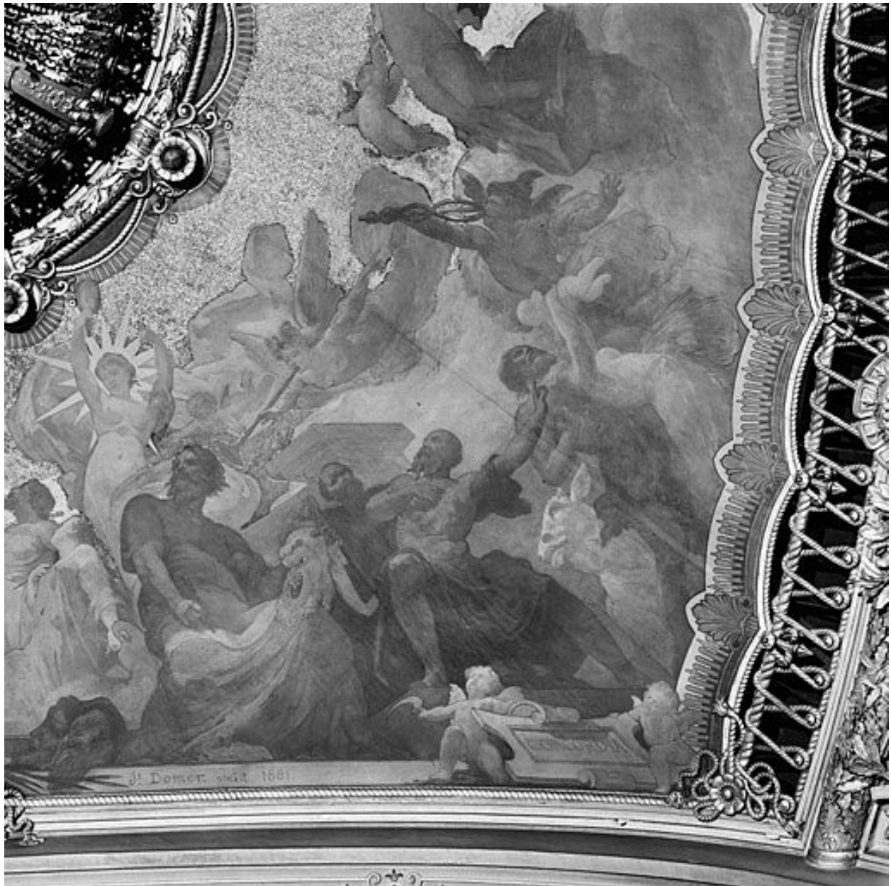
Détail des figures de Praxitèle, d'Aristophane, de la Vérité et de Mercure