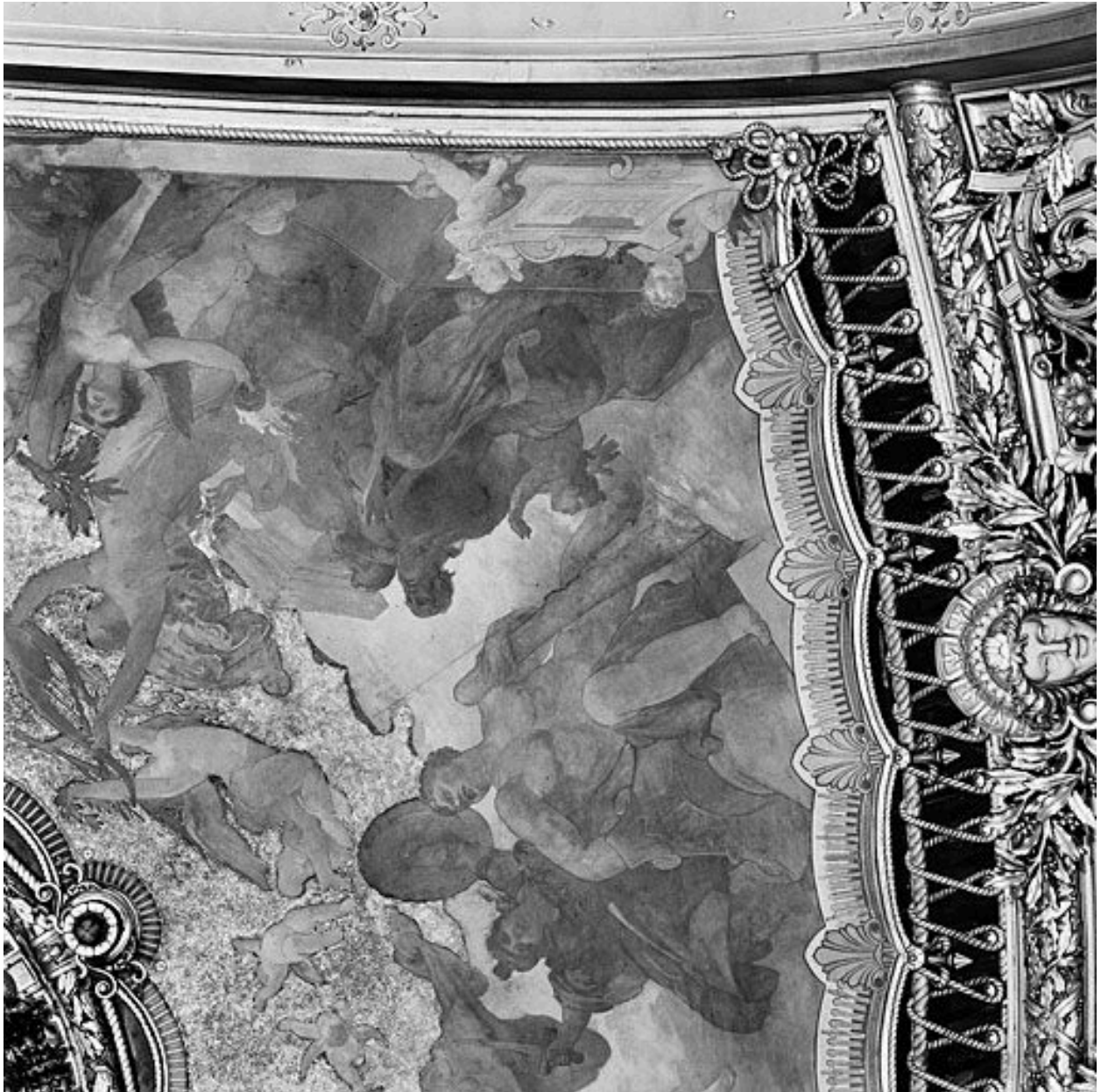
Détail des figures de la Renommée, de la Musique, d'Hercule et de Mars