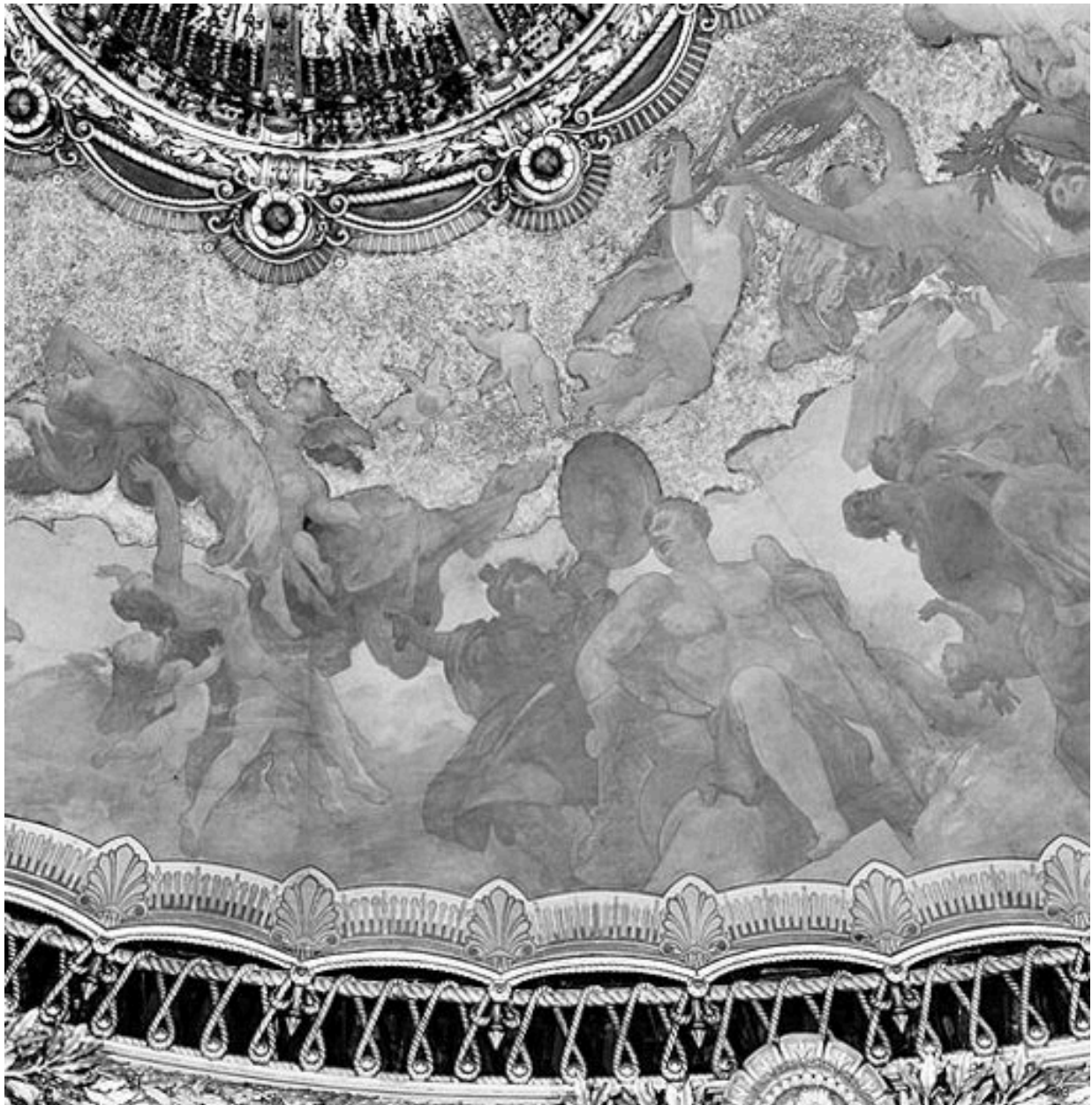
Détail des figures d'Hercule, de Mars et d'une femme renversée soutenue par des putti