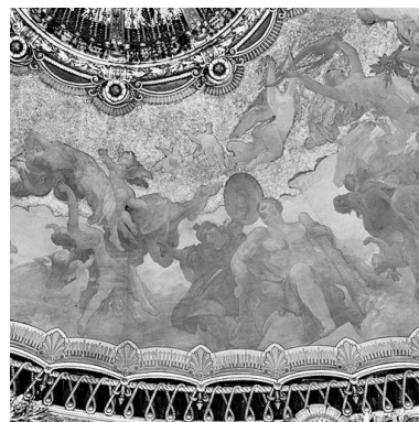
Détail des figures d'Hercule, de Mars et d'une femme renversée soutenue par des putti IVR82_19786900188X