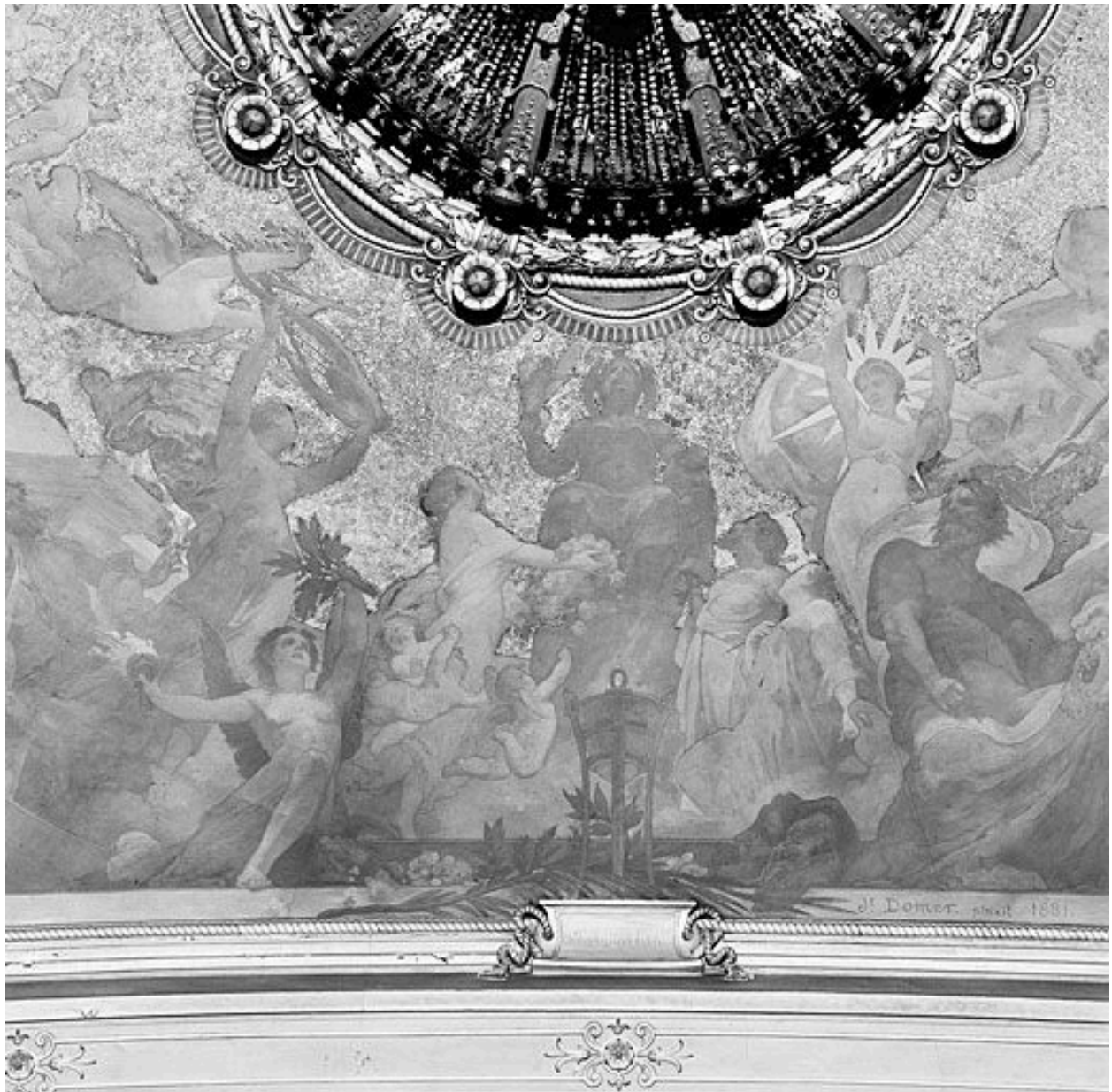
Détail du groupe central dominé par Athéna