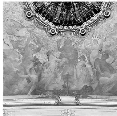
Détail du groupe central dominé par Athéna