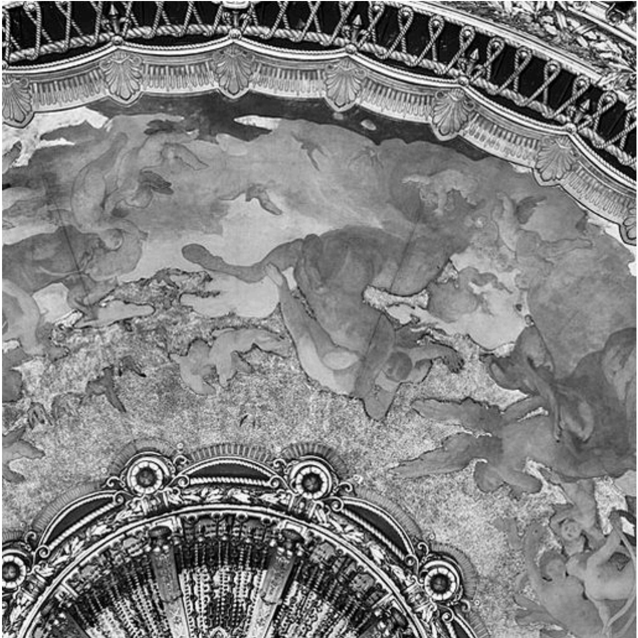
Détail de l'enlèvement d'une femme par un centaure et d'une femme ailée