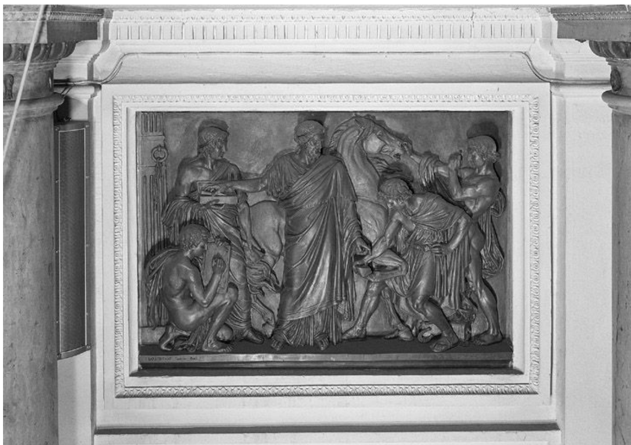
Cours de soin d'une patte de cheval