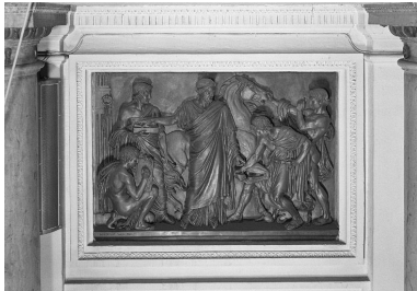
Cours de soin d'une patte de cheval IVR82_19776900007P