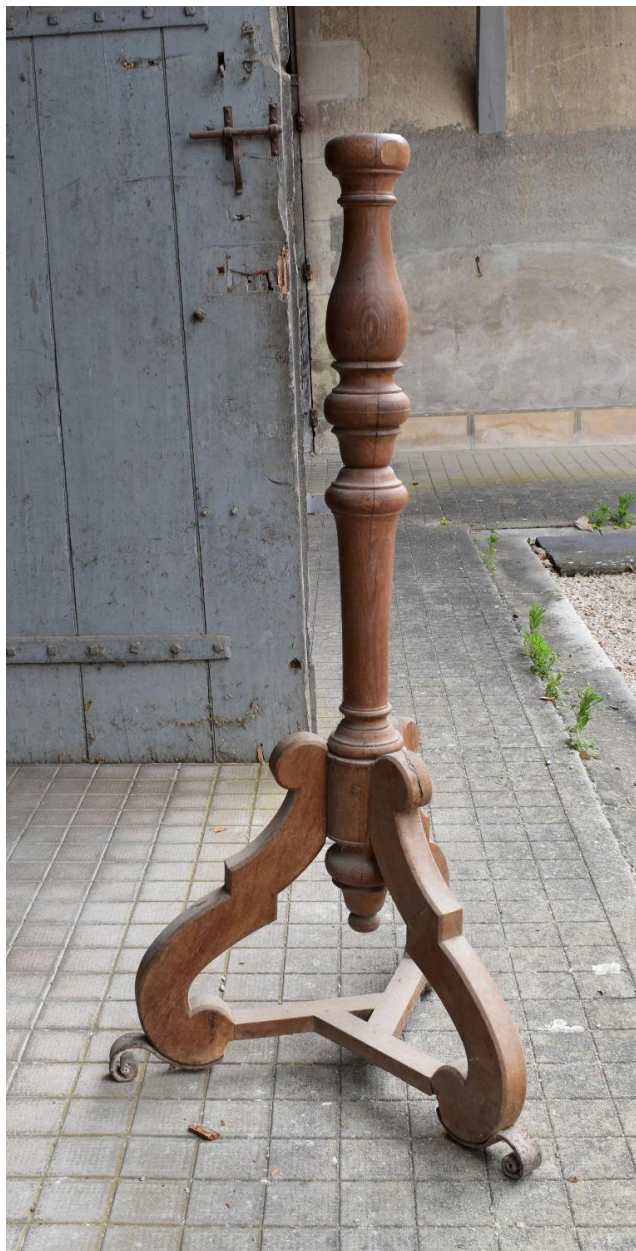
Vue du pied