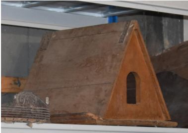
Vue du haut du lutrin IVR84_20226300697NUC4A