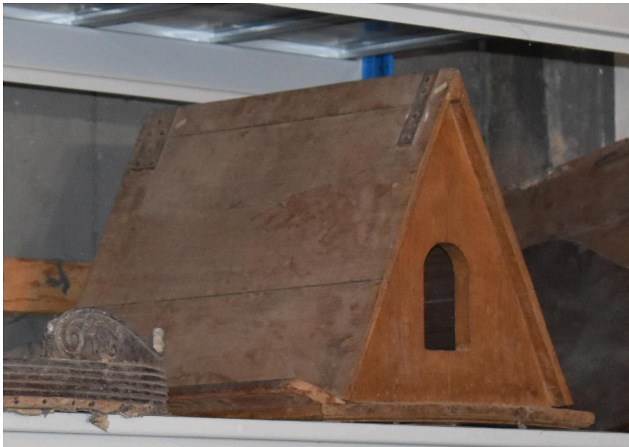
Vue du haut du lutrin