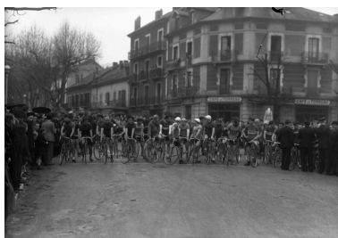
Course cycliste devant l'immeuble IVR82_20117300699NUCB