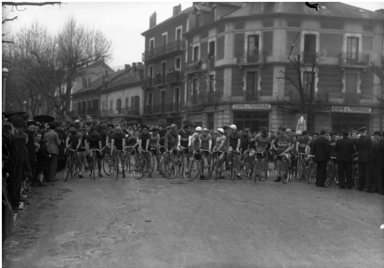
Course cycliste devant l'immeuble