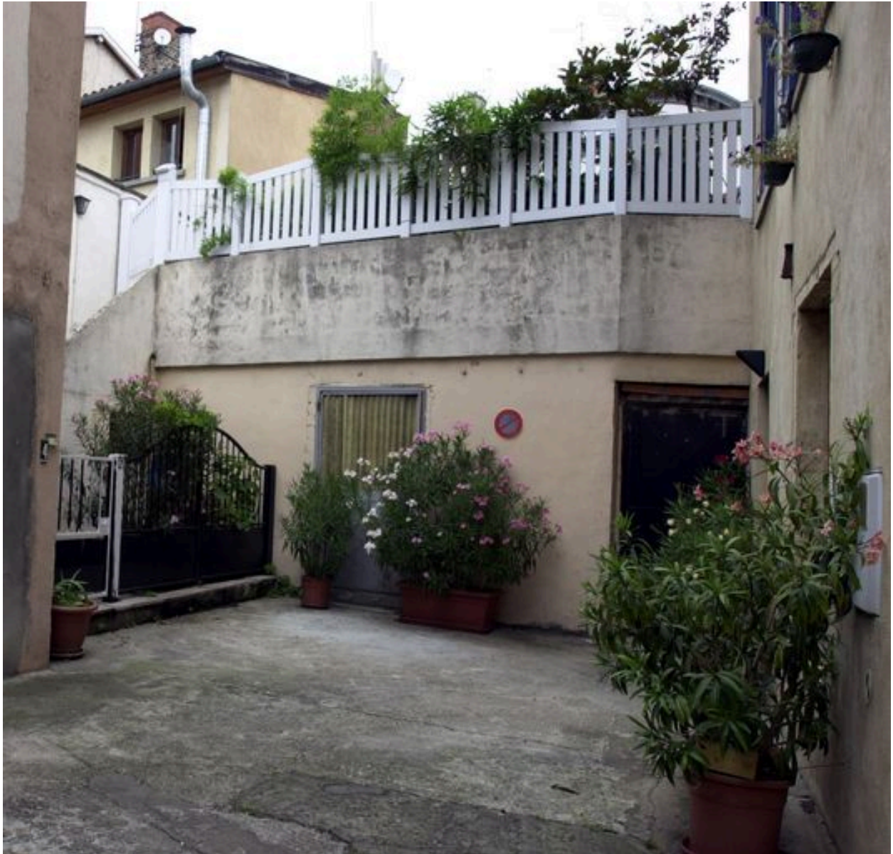
Terrasse contre l'élévation postérieure, impasse Rival