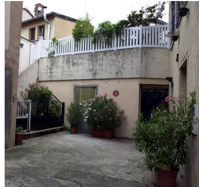
Terrasse contre l'élévation postérieure, impasse Rival IVR82_20096901072NUCA