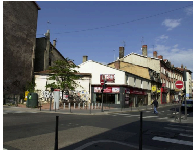
Vue générale depuis le nord-est IVR82_20096901203NUCA