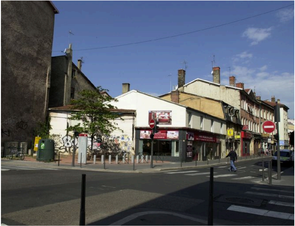
Vue générale depuis le nord-est