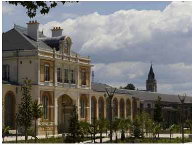
Vue partielle de la façade principale depuis la place de la Gare.