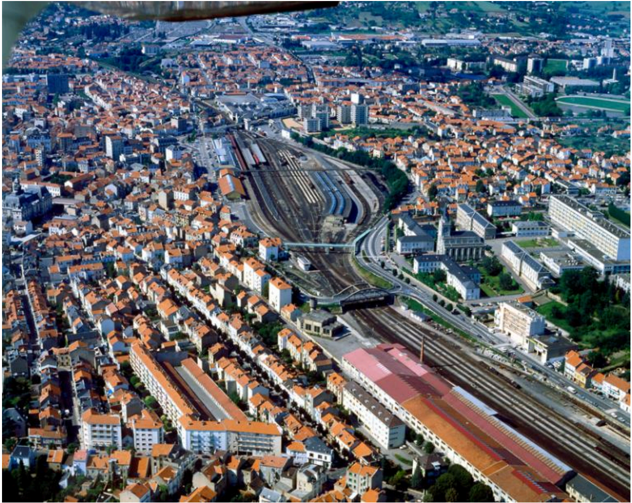
Vue aérienne de la gare et du quartier de la gare de Vichy en 1987.