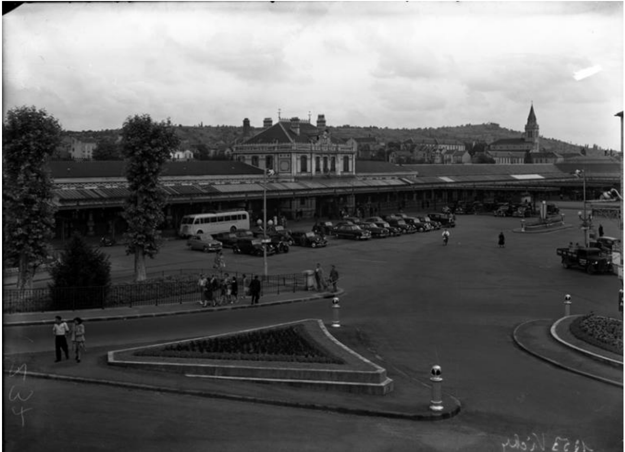
La gare de Vichy côté cour des voyageurs, photo ancienne s.d.