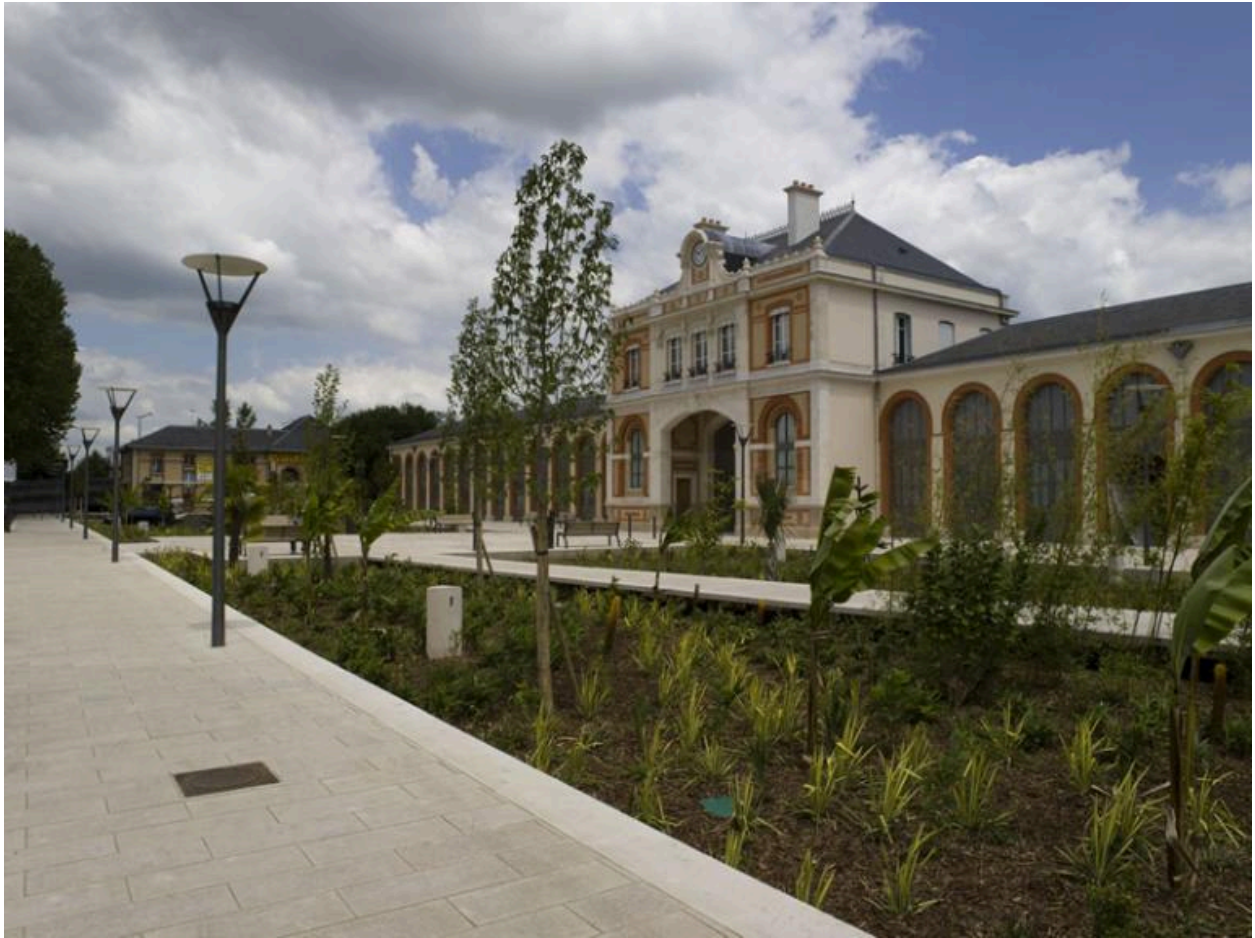
Façade de la gare depuis la cour des voyageurs, sur la place de la Gare : le pavillon central et ses deux ailes.