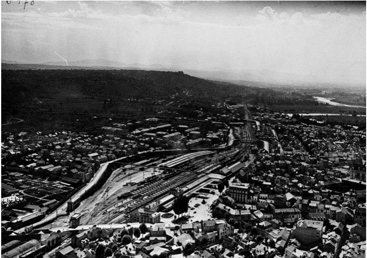
"Vue d'avion : la gare [de Vichy]". Photographie noir & blanc, s.n., 1935.