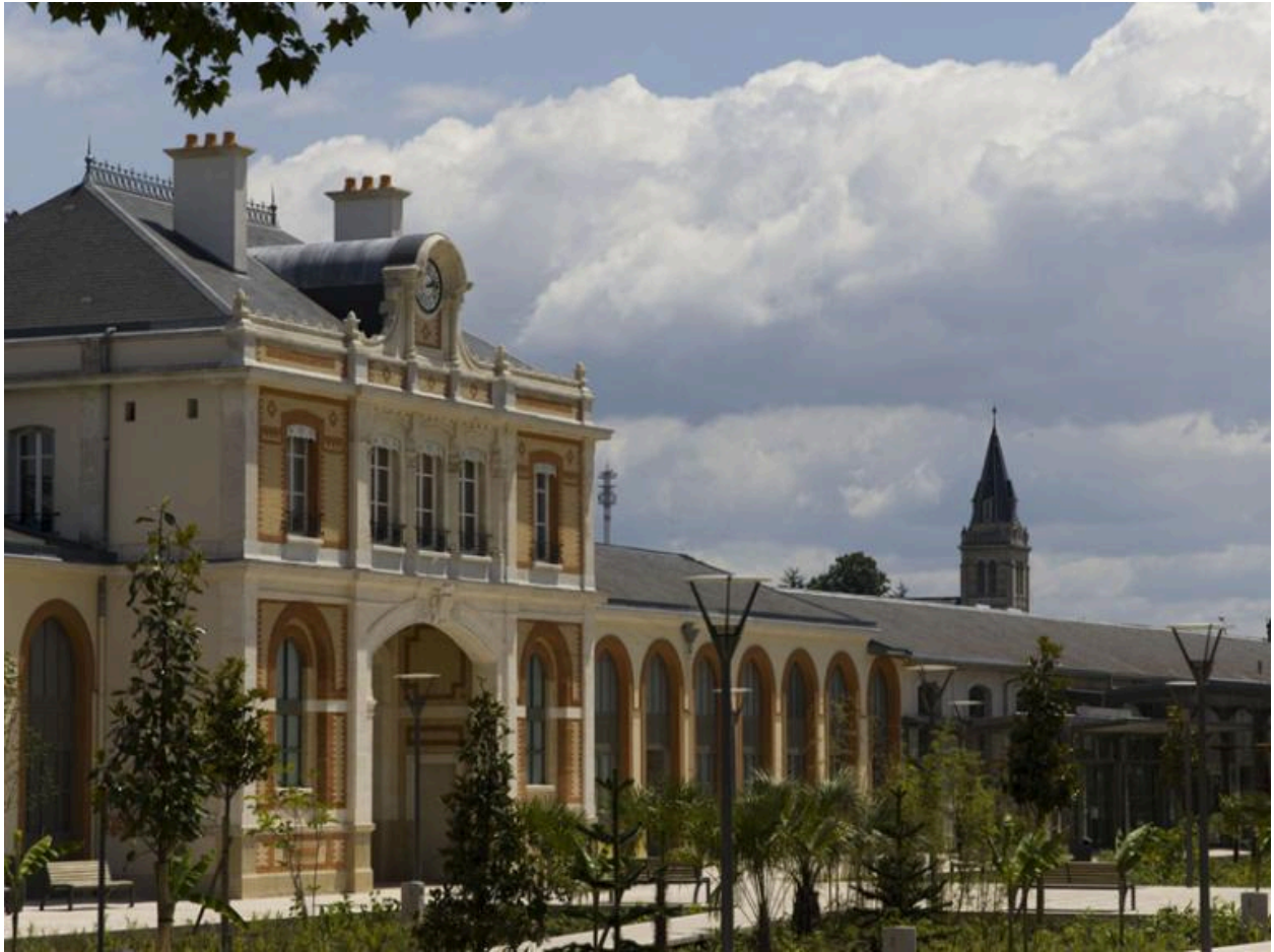
Vue partielle de la façade principale depuis la place de la Gare.