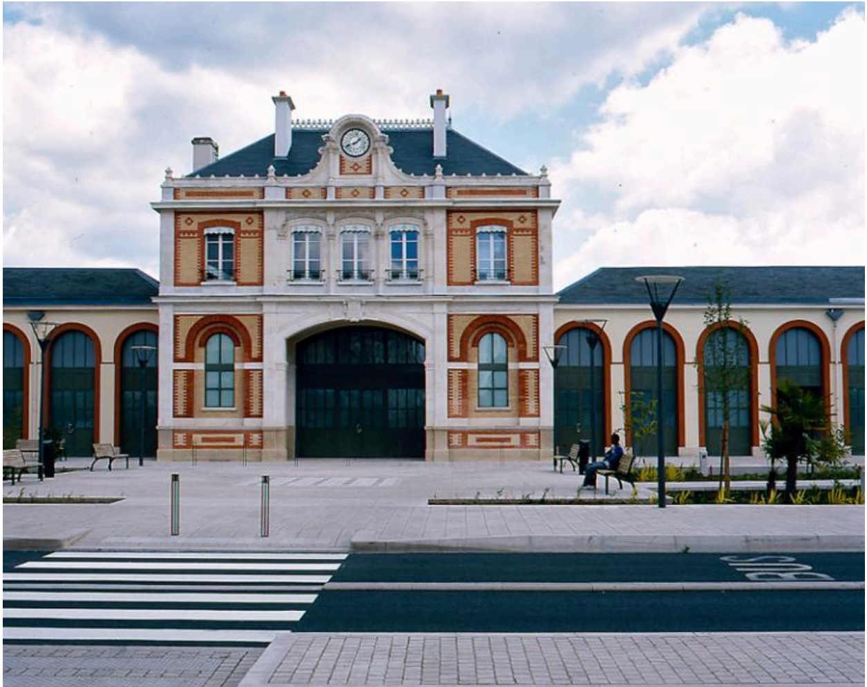
Le pavillon central et l'entrée des voyageurs depuis la place de la Gare.