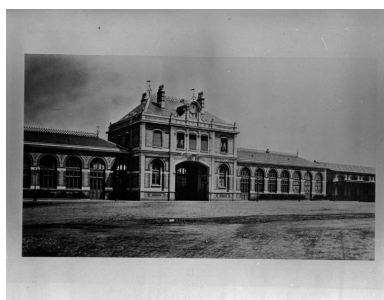
La gare de Vichy. In : Album des travaux du Casino, 1863-1865.