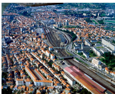
Vue aérienne de la gare et du quartier de la gare de Vichy en 1987.