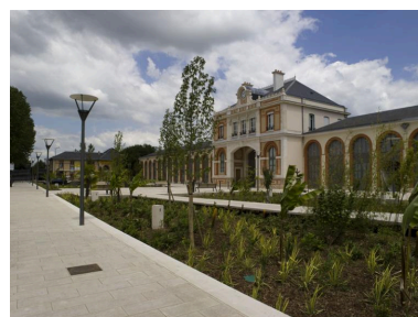
Façade de la gare depuis la cour des voyageurs, sur la place de la Gare : le pavillon central et ses deux ailes.