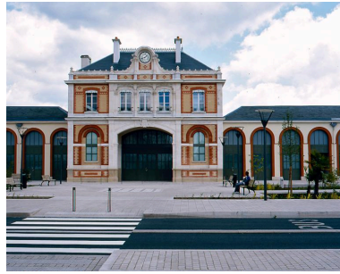
Le pavillon central et l'entrée des voyageurs depuis la place de la Gare. IVR83_20090300547XA