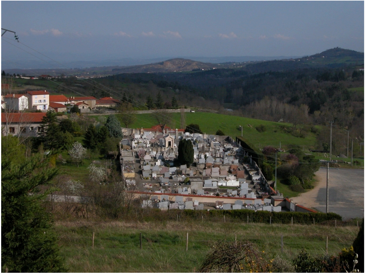
Vue générale depuis le nord-ouest.