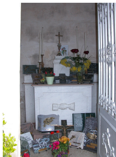
Intérieur de la chapelle funéraire (tombe de la famille Poncet).