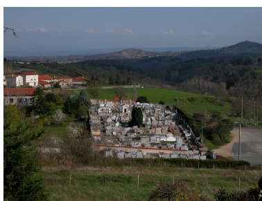
Vue générale depuis le nord-ouest. IVR82_20114202216NUCA