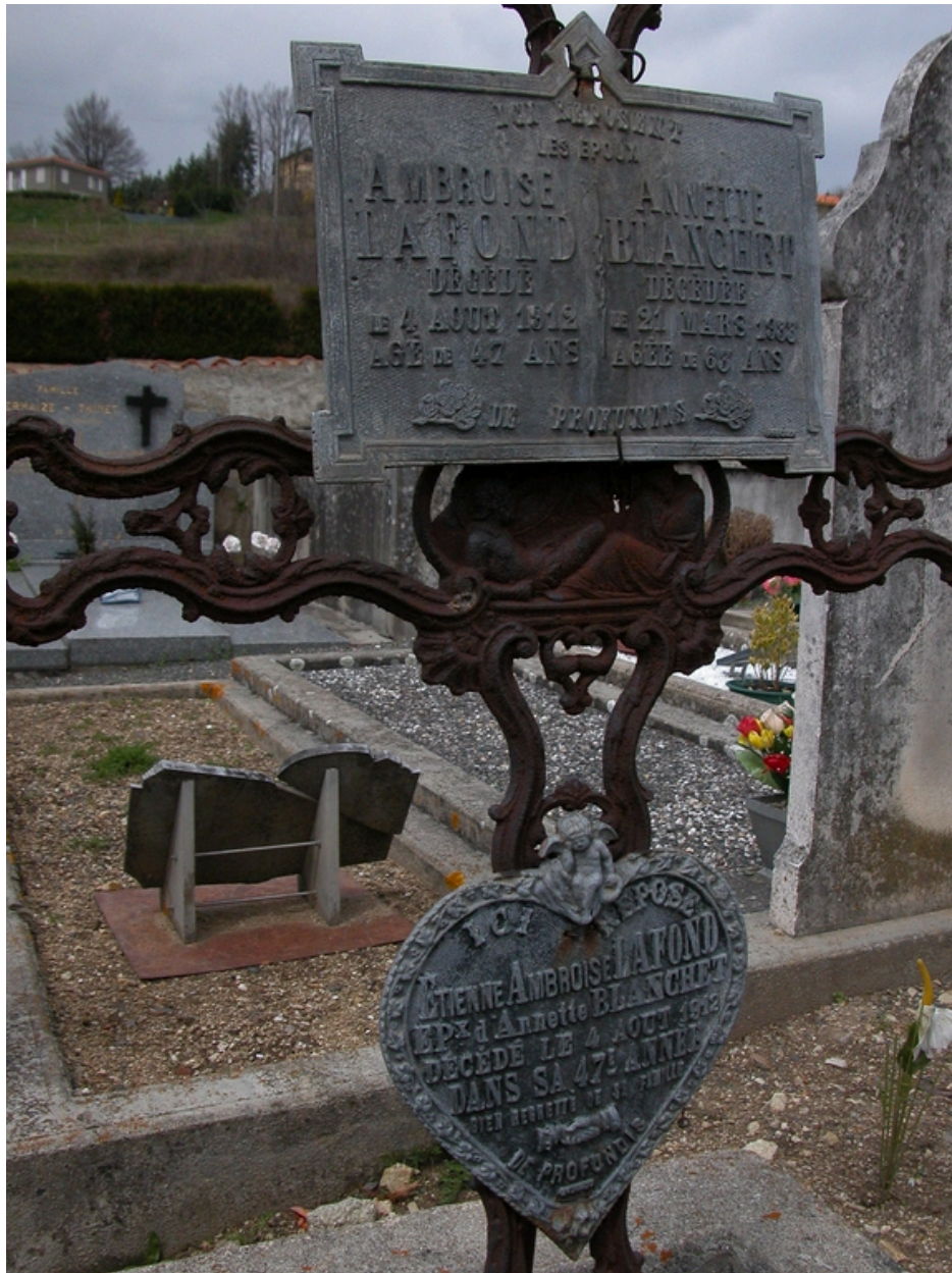
Croix tombale (plaques datées 1912).