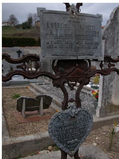
Croix tombale (plaques datées 1912). IVR82_20124200323NUCA