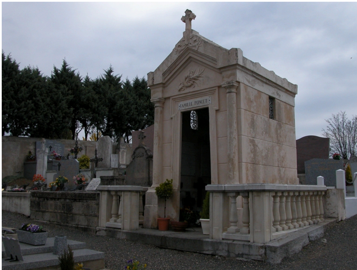
Tombe avec chapelle funéraire (famille Poncet).