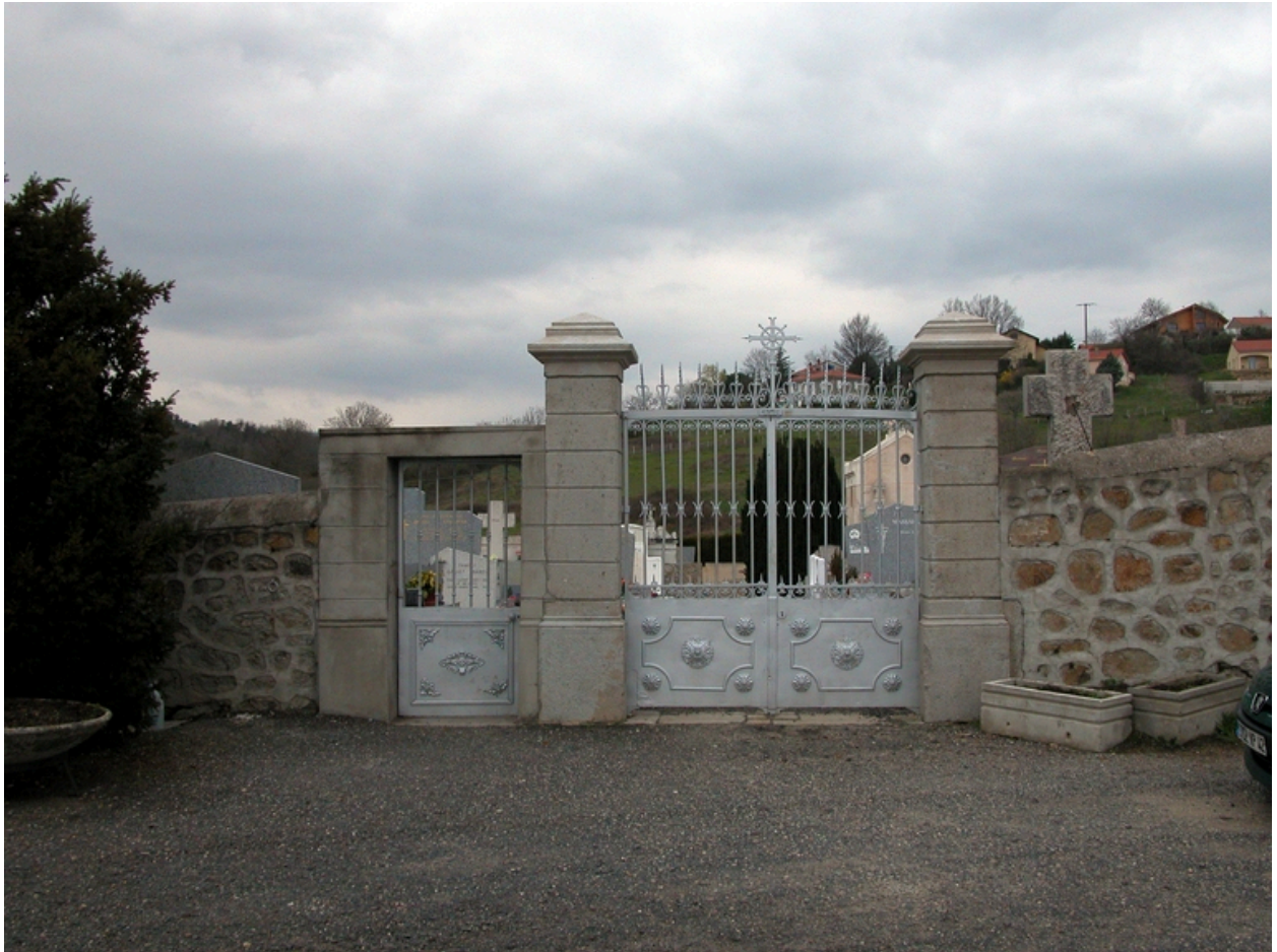
Vue du portail principal.