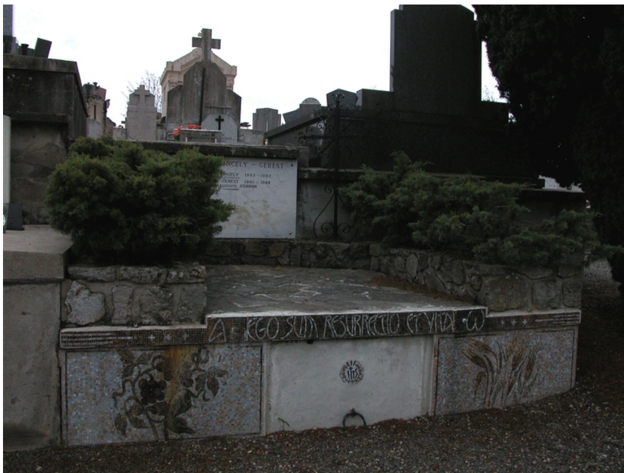
Tombe de la famille Pinoncely-Gerest. Décor de mosaïque.