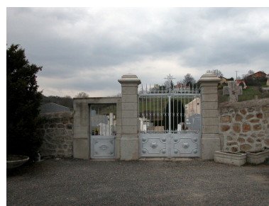
Vue du portail principal.