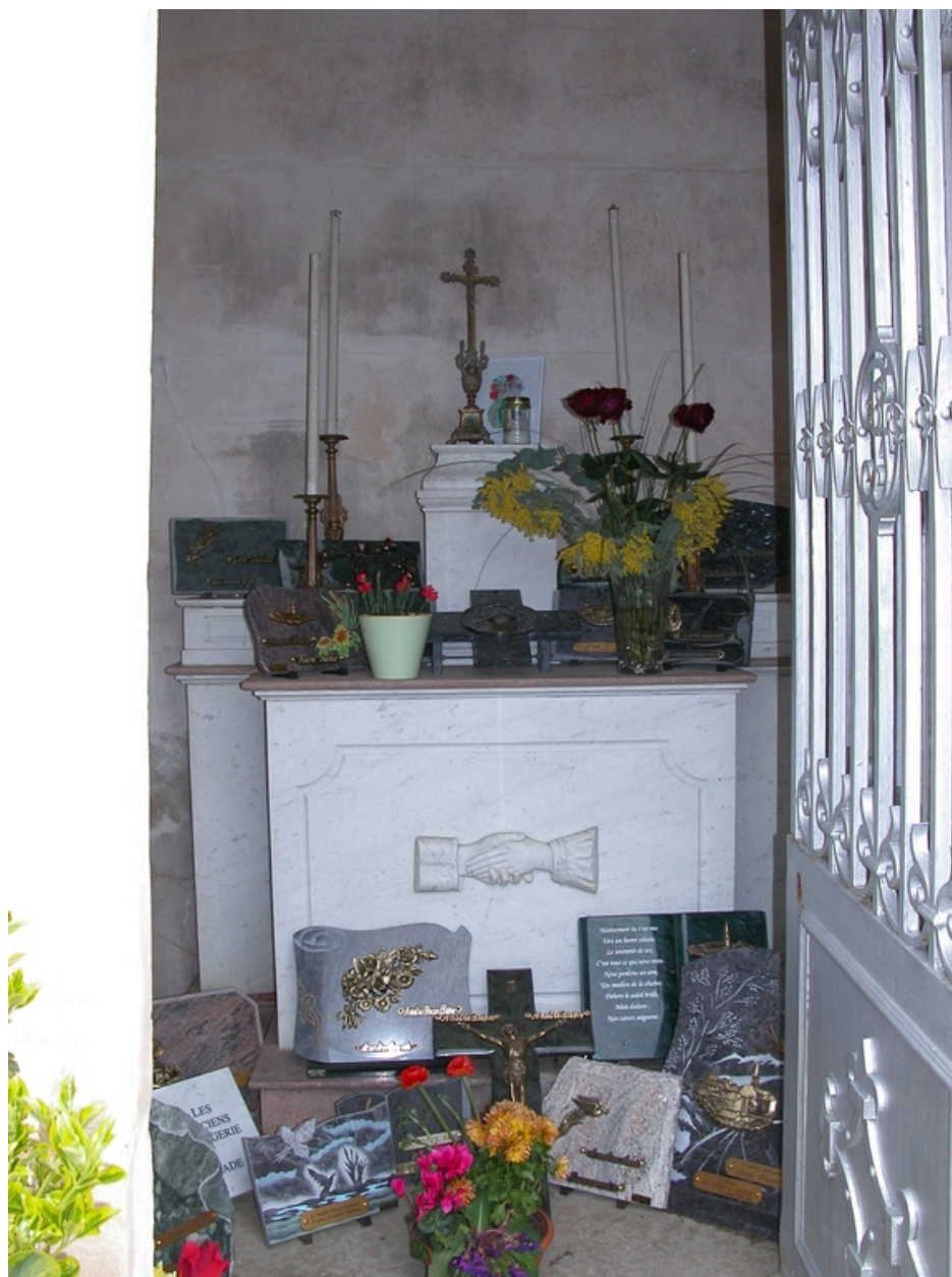
Intérieur de la chapelle funéraire (tombe de la famille Poncet).