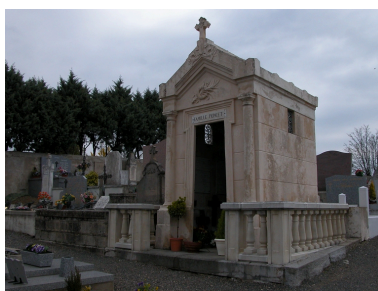
Tombe avec chapelle funéraire (famille Poncet).