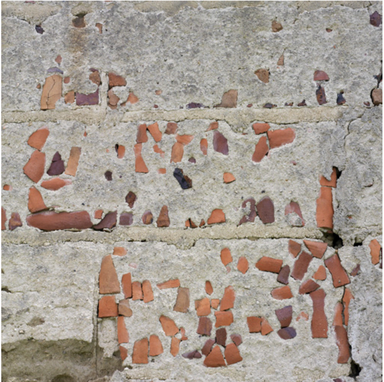
Détail du pignon ouest du logis (utilisation de débris de tuiles pour charger l'enduit).