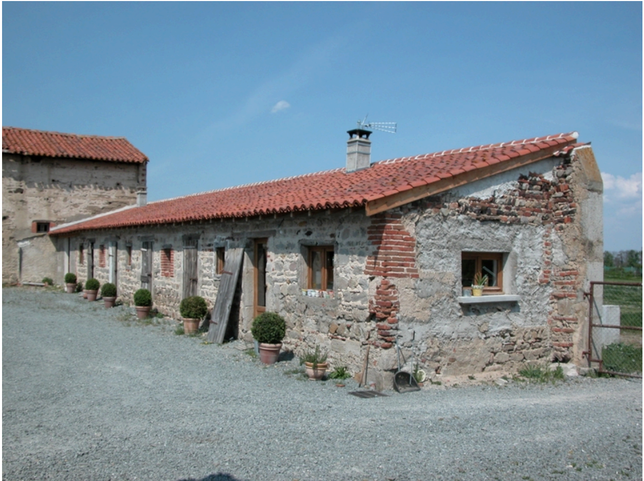
Vue des porcherie.