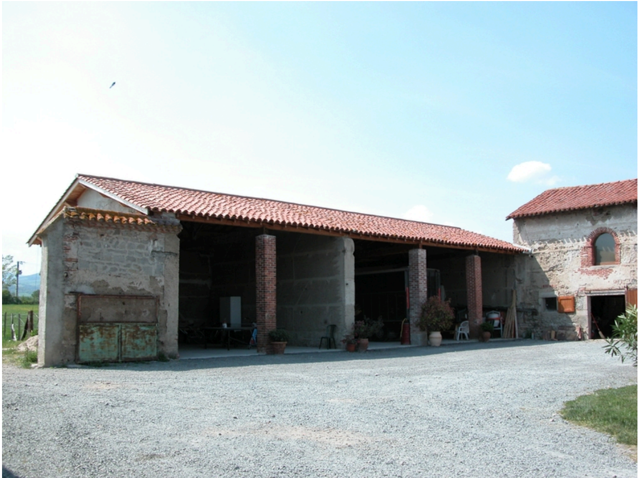
Vue du hangar.