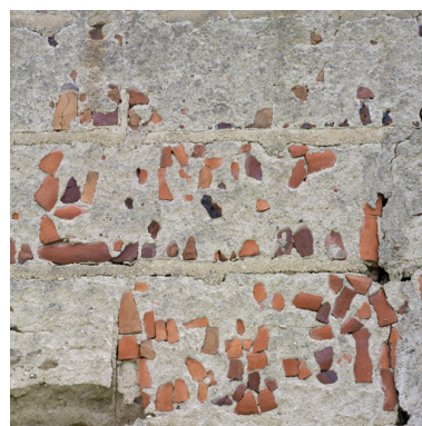
Détail du pignon ouest du logis (utilisation de débris de tuiles pour charger l'enduit). IVR82_20084201213NUCA