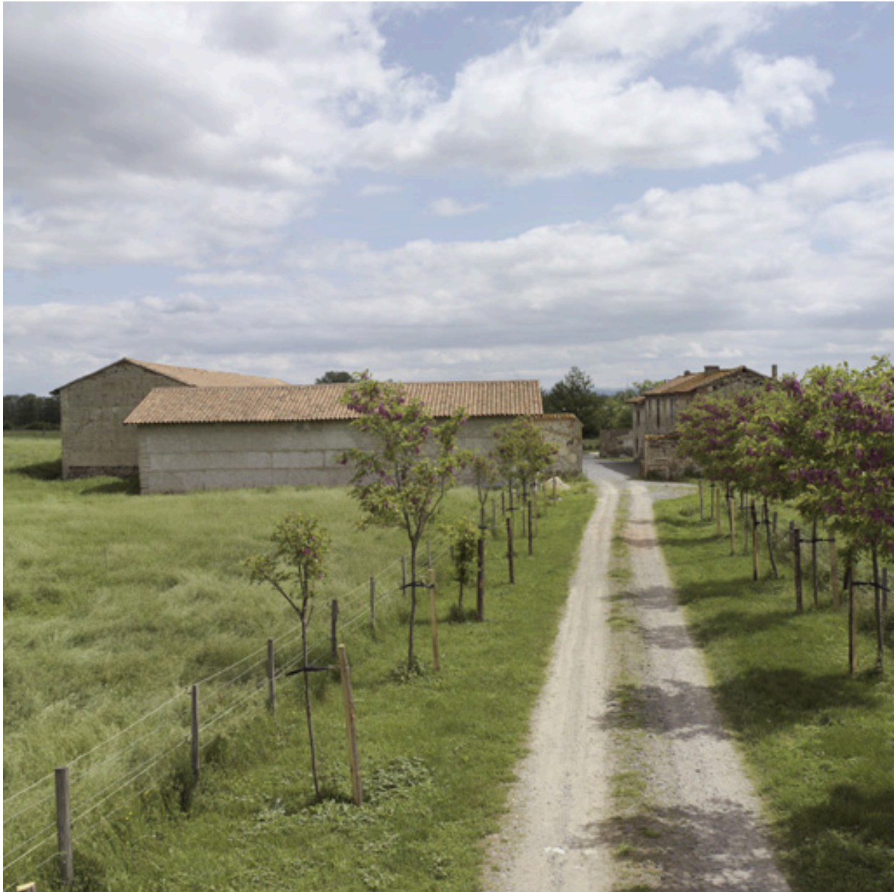
Vue générale depuis le sud-ouest.