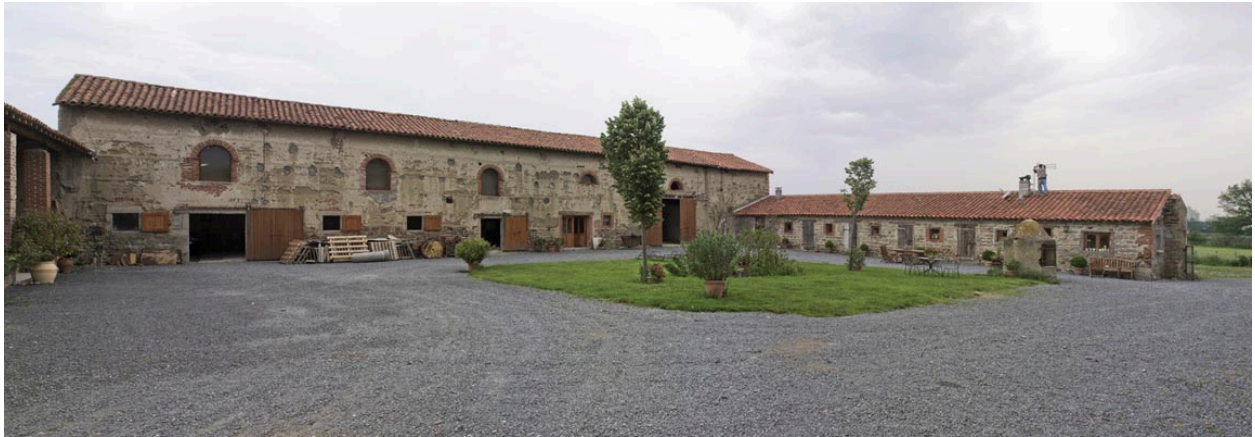
Vue d'ensemble de l'angle nord-est de la cour.