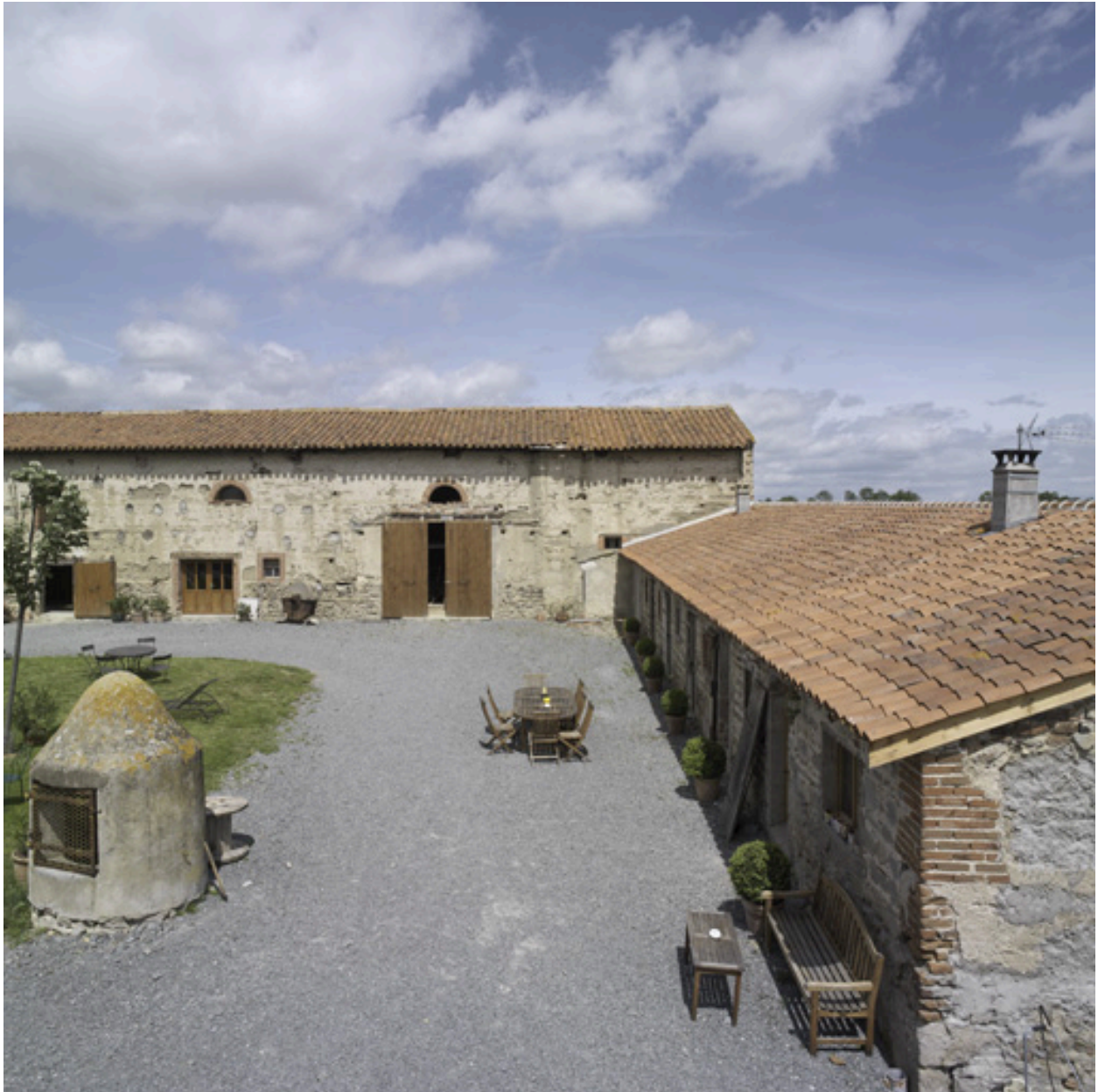
Vue d'ensemble de l'angle nord-ouest de la cour, depuis le sud.