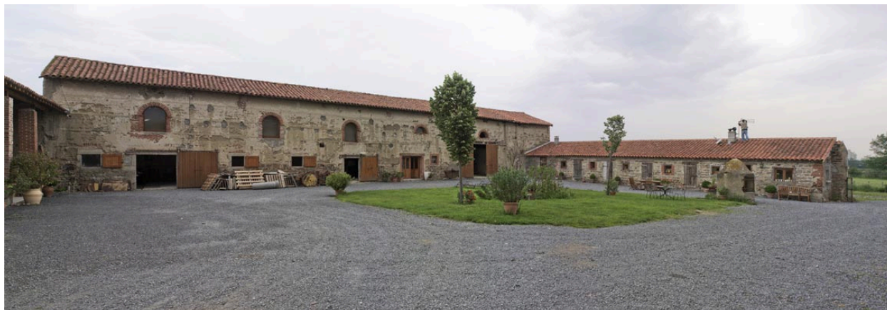
Vue d'ensemble de l'angle nord-est de la cour.