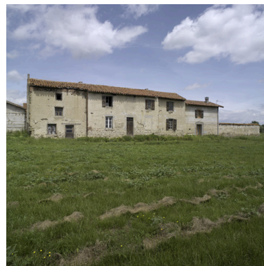
Vue d'ensemble de l'élévation sud du logis.