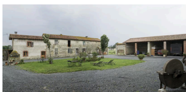
Vue générale de l'angle sud-ouest de la cour.