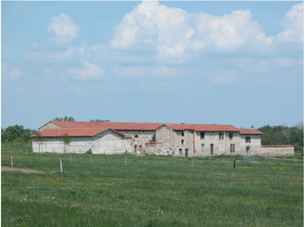
Vue générale depuis le sud-ouest.