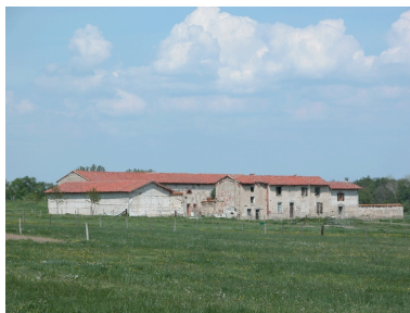
Vue générale depuis le sud-ouest. IVR82_20134204337NUCA