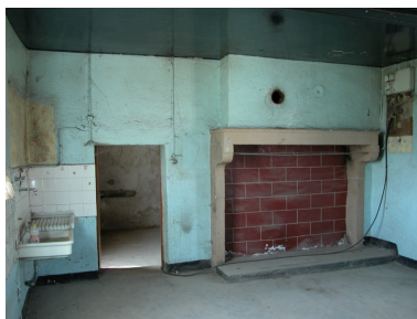
Vue intérieure du logis : cheminée. IVR82_20134204343NUCA