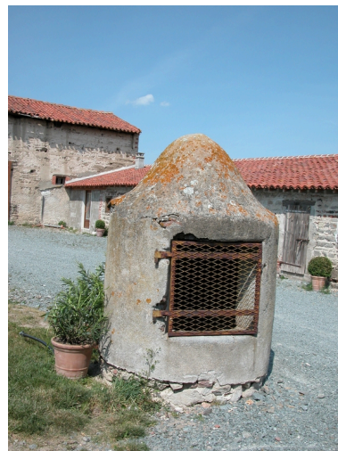
Vue du puits. IVR82_20134204340NUCA