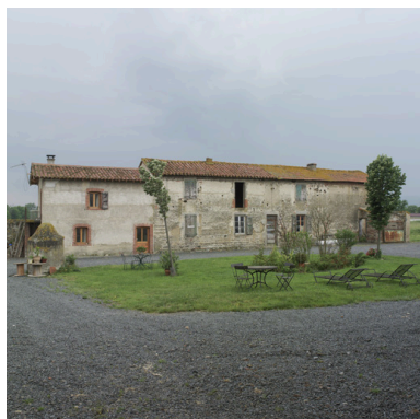
Vue d'ensemble de l'élévation nord du logis.