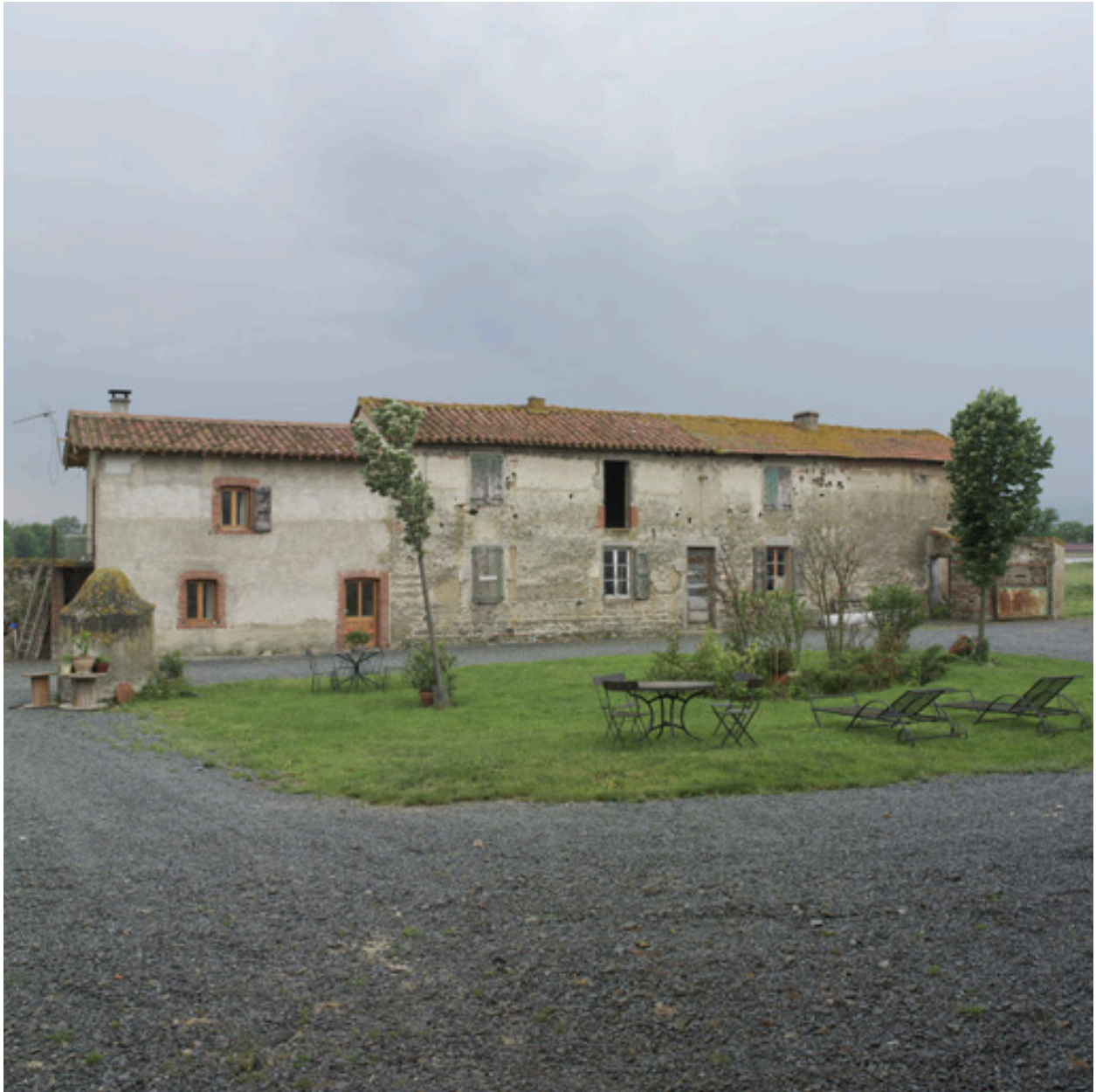
Vue d'ensemble de l'élévation nord du logis.