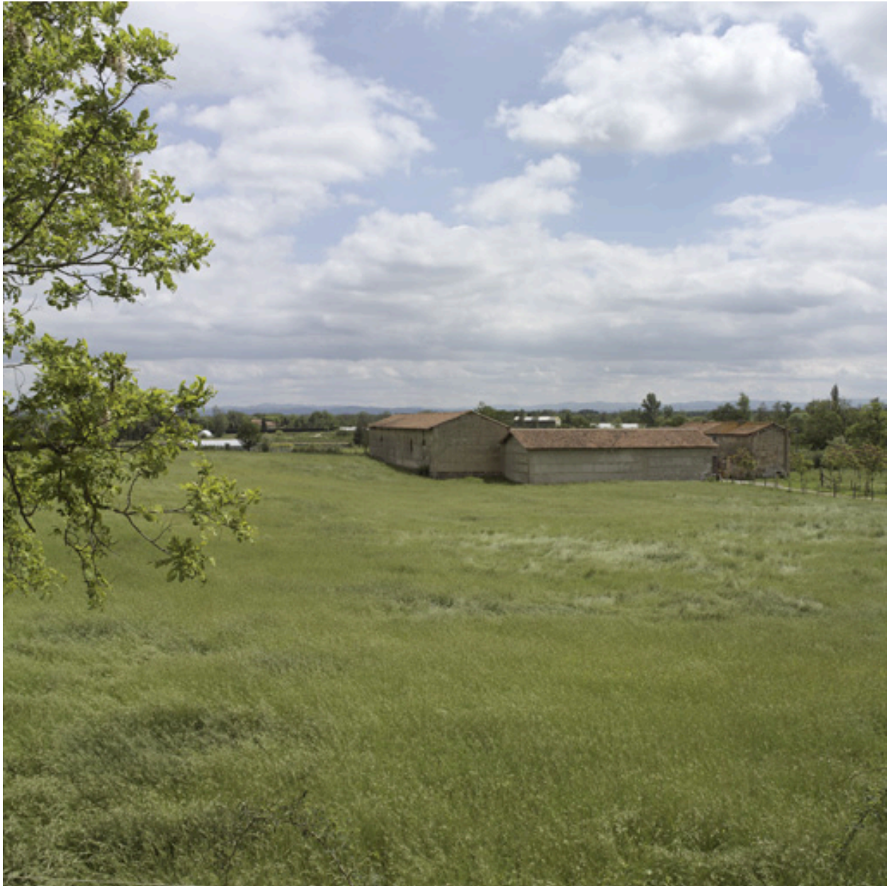
Vue générale depuis l'ouest.