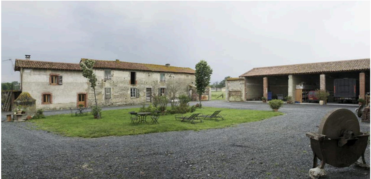
Vue générale de l'angle sud-ouest de la cour.