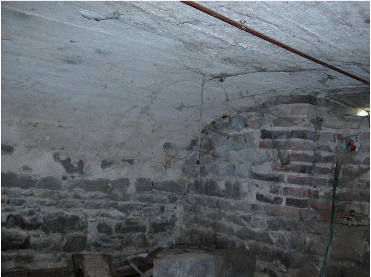
Vue intérieure de la cave.