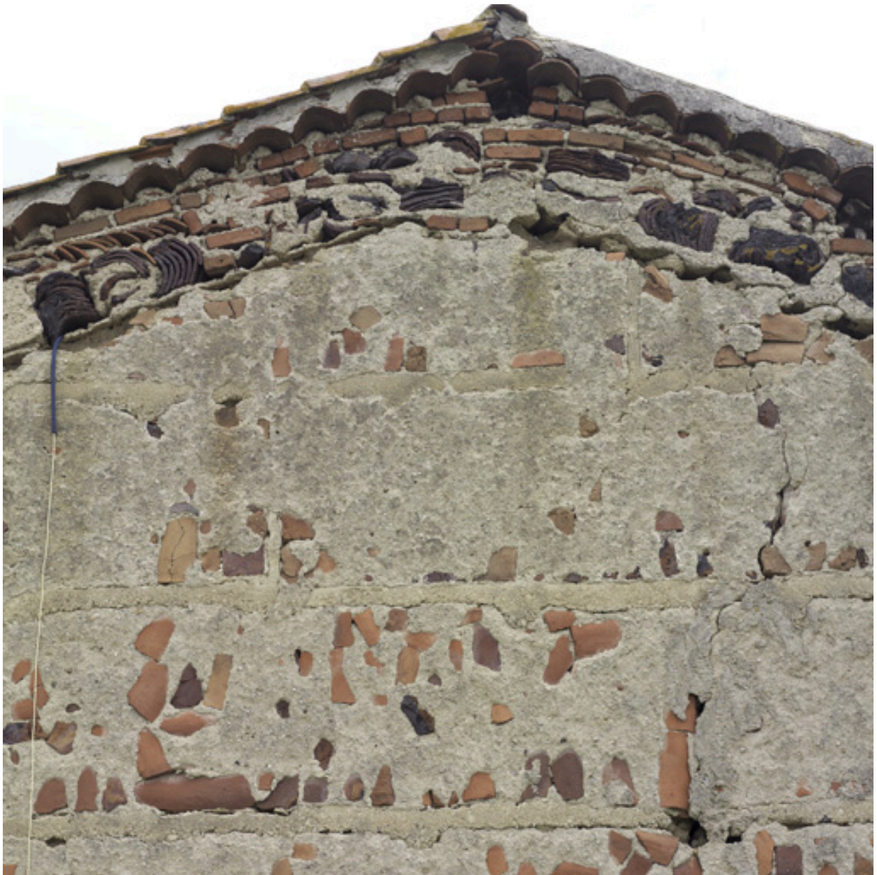
Détail du pignon ouest du logis (utilisation de ratés de cuisson dans la maçonnerie).