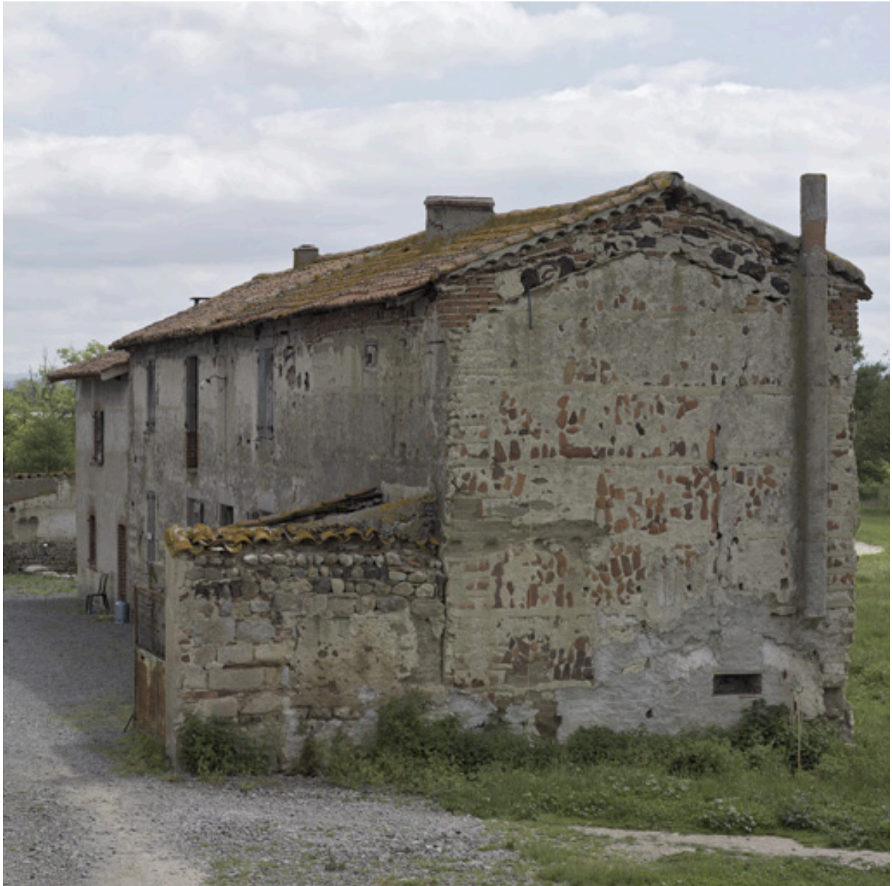
Vue du logis depuis le nord-ouest.