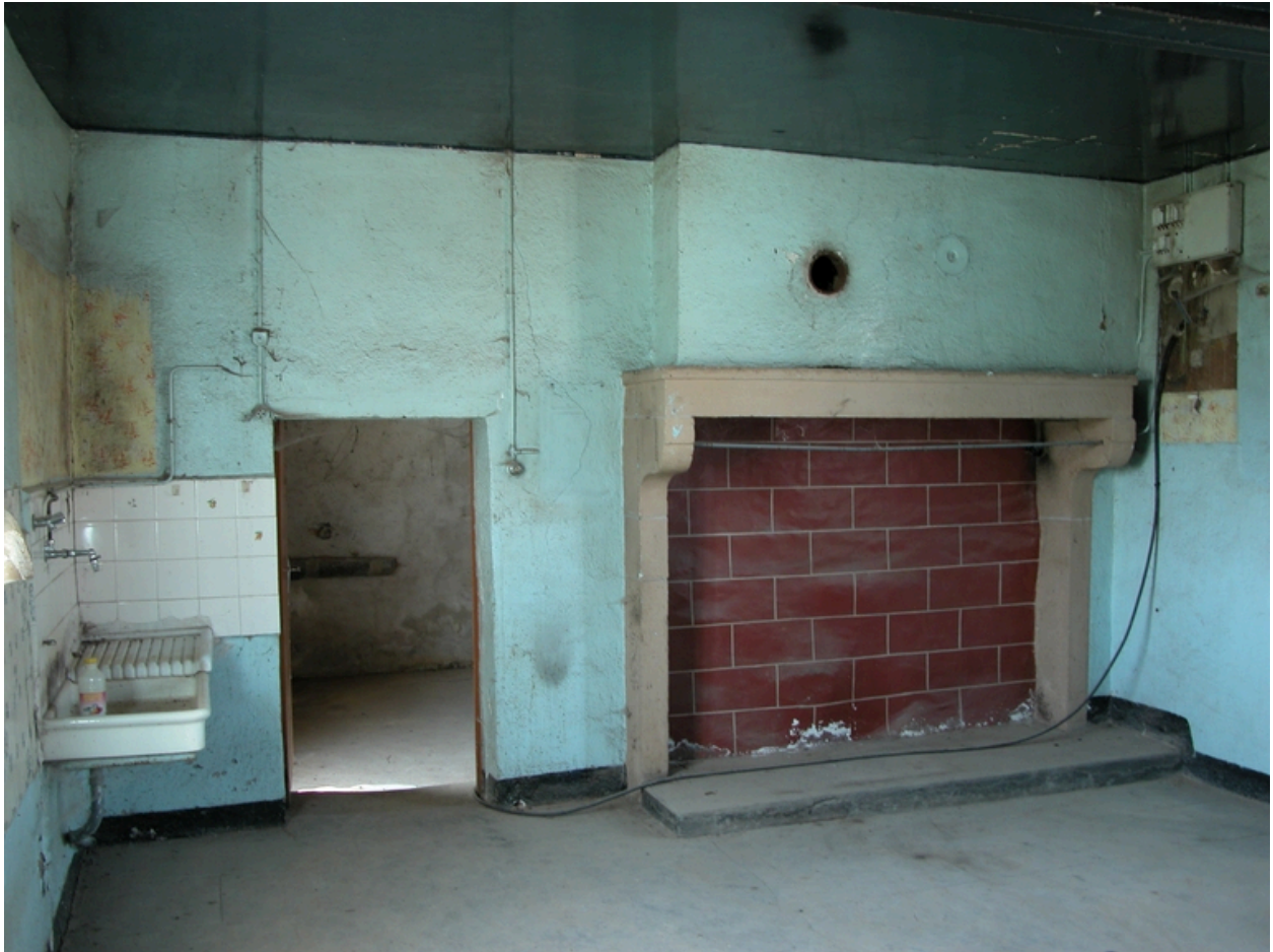
Vue intérieure du logis : cheminée.