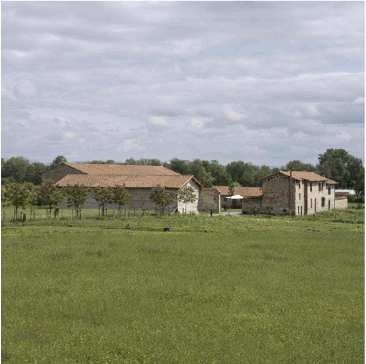
Vue générale depuis le sud-ouest.