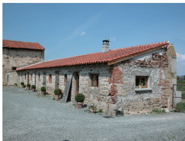
Vue des porcherie. IVR82_20134204339NUCA