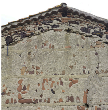
Détail du pignon ouest du logis (utilisation de ratés de cuisson dans la maçonnerie).