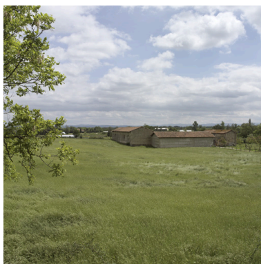
Vue générale depuis l'ouest. IVR82_20084201237NUCA