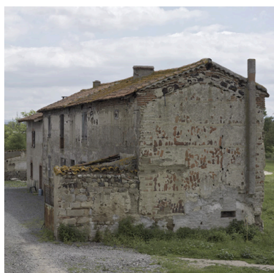
Vue du logis depuis le nord-ouest. IVR82_20084201209NUCA