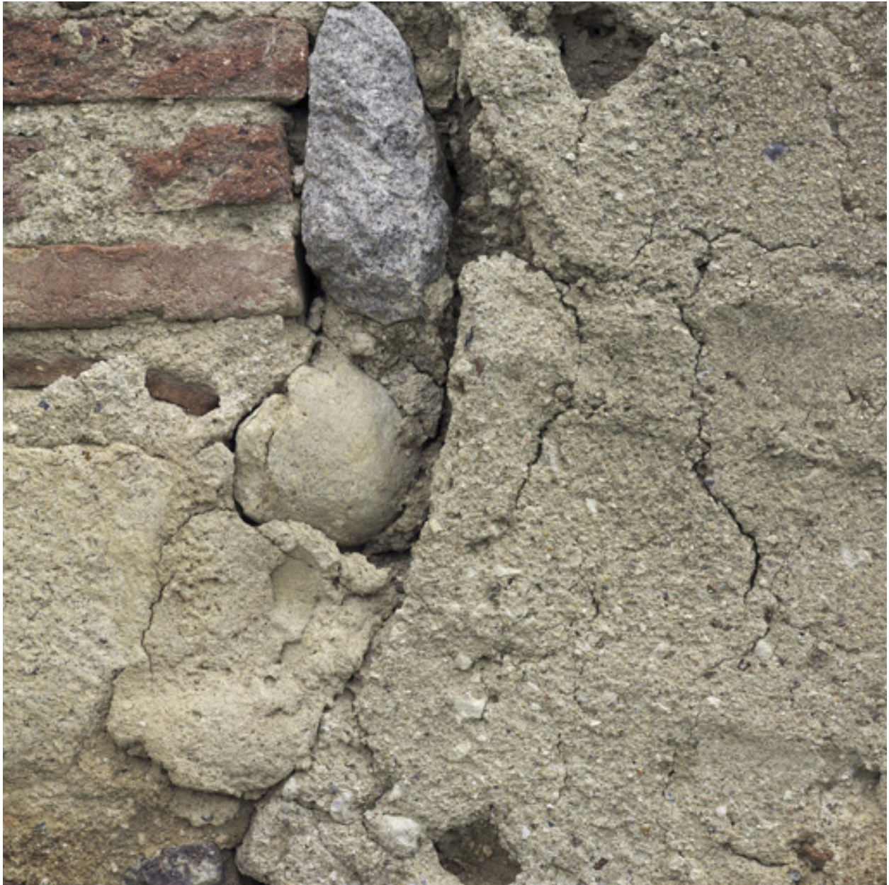
Détail de maçonnerie.