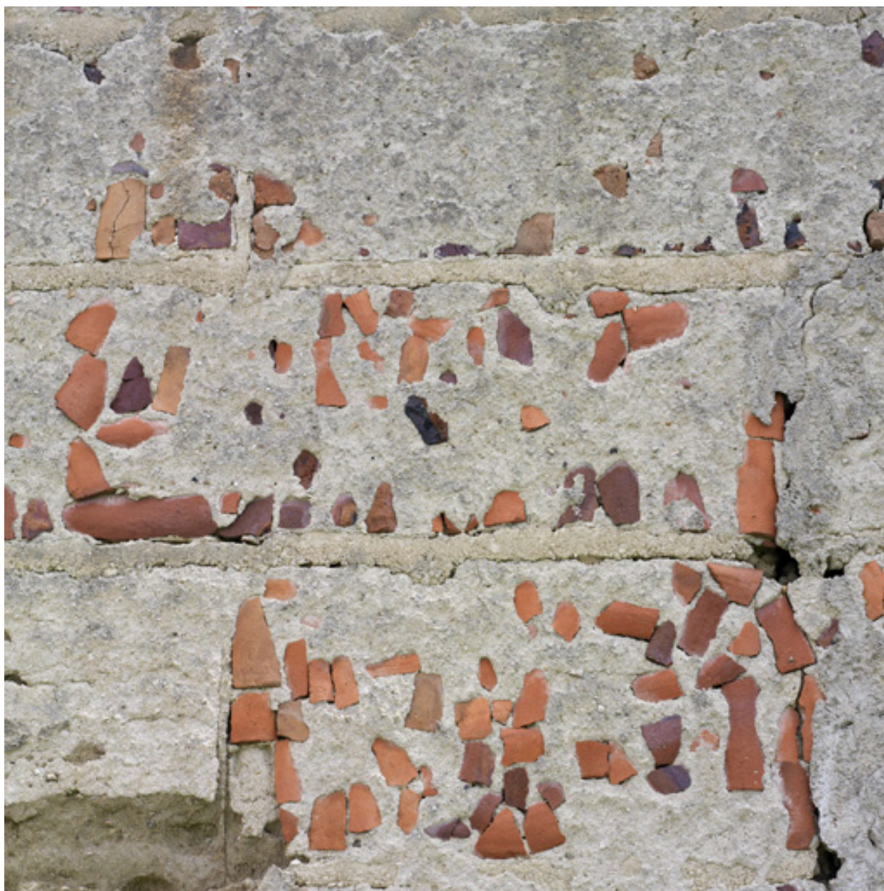
Détail du pignon ouest du logis (utilisation de débris de tuiles pour charger l'enduit).