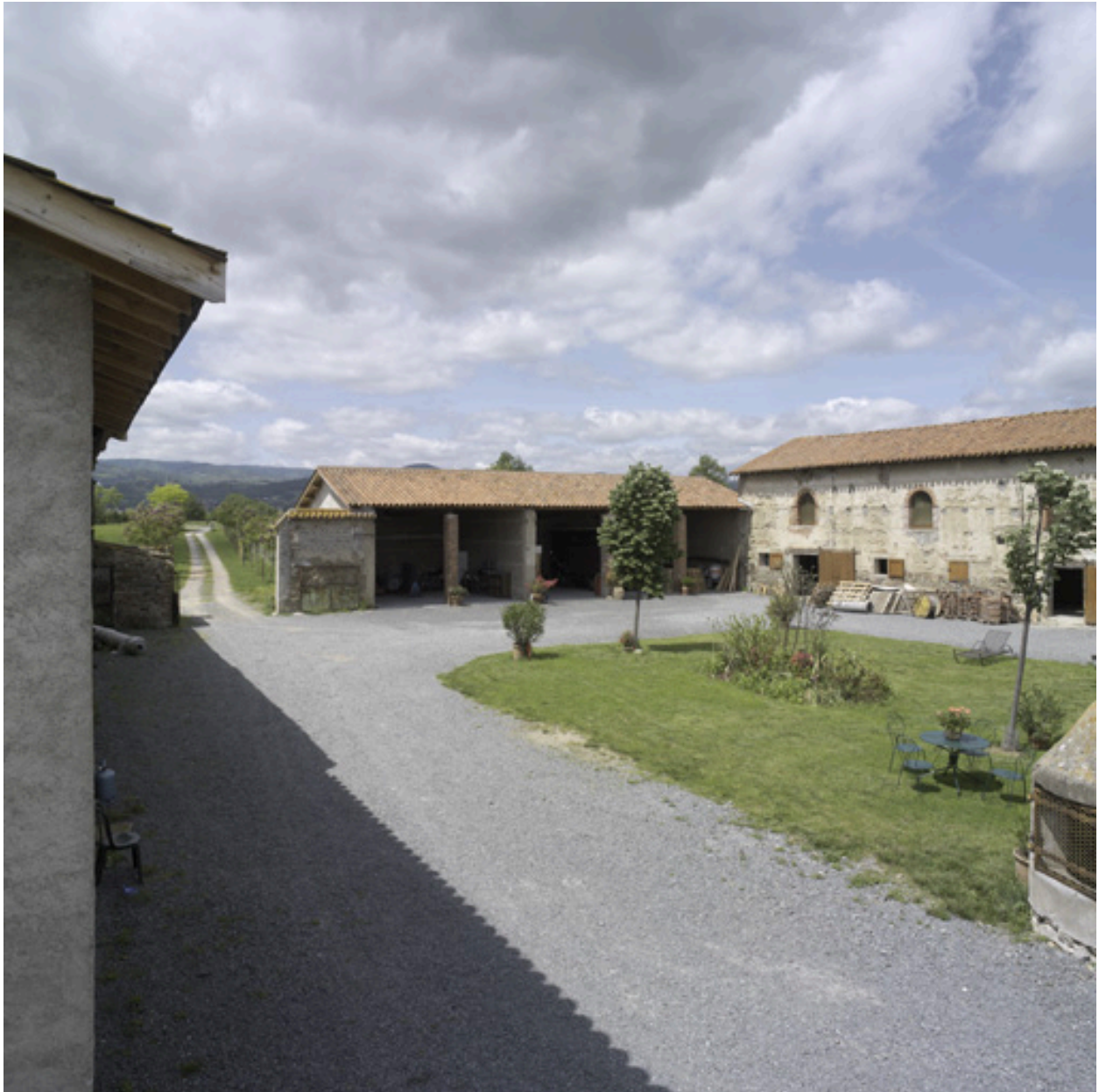
Vue d'ensemble de l'angle nord-ouest de la cour.