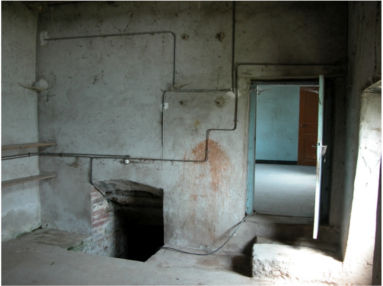
Vue intérieure du logis : accès à la cave.