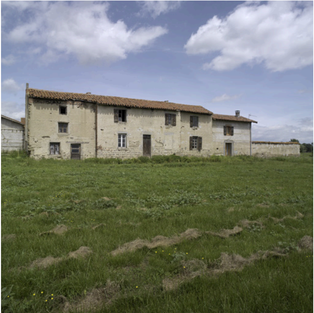
Vue d'ensemble de l'élévation sud du logis.