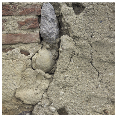
Détail de maçonnerie. IVR82_20084201215NUCA