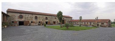
Vue d'ensemble de l'angle nord-est de la cour. IVR82_20074201172NUCAQ