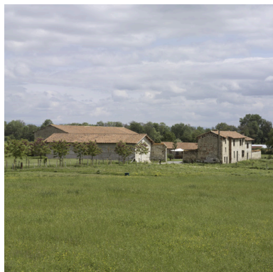
Vue générale depuis le sud-ouest. IVR82_20084201236NUCA