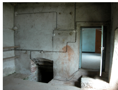
Vue intérieure du logis : accès à la cave. IVR82_20134204344NUCA