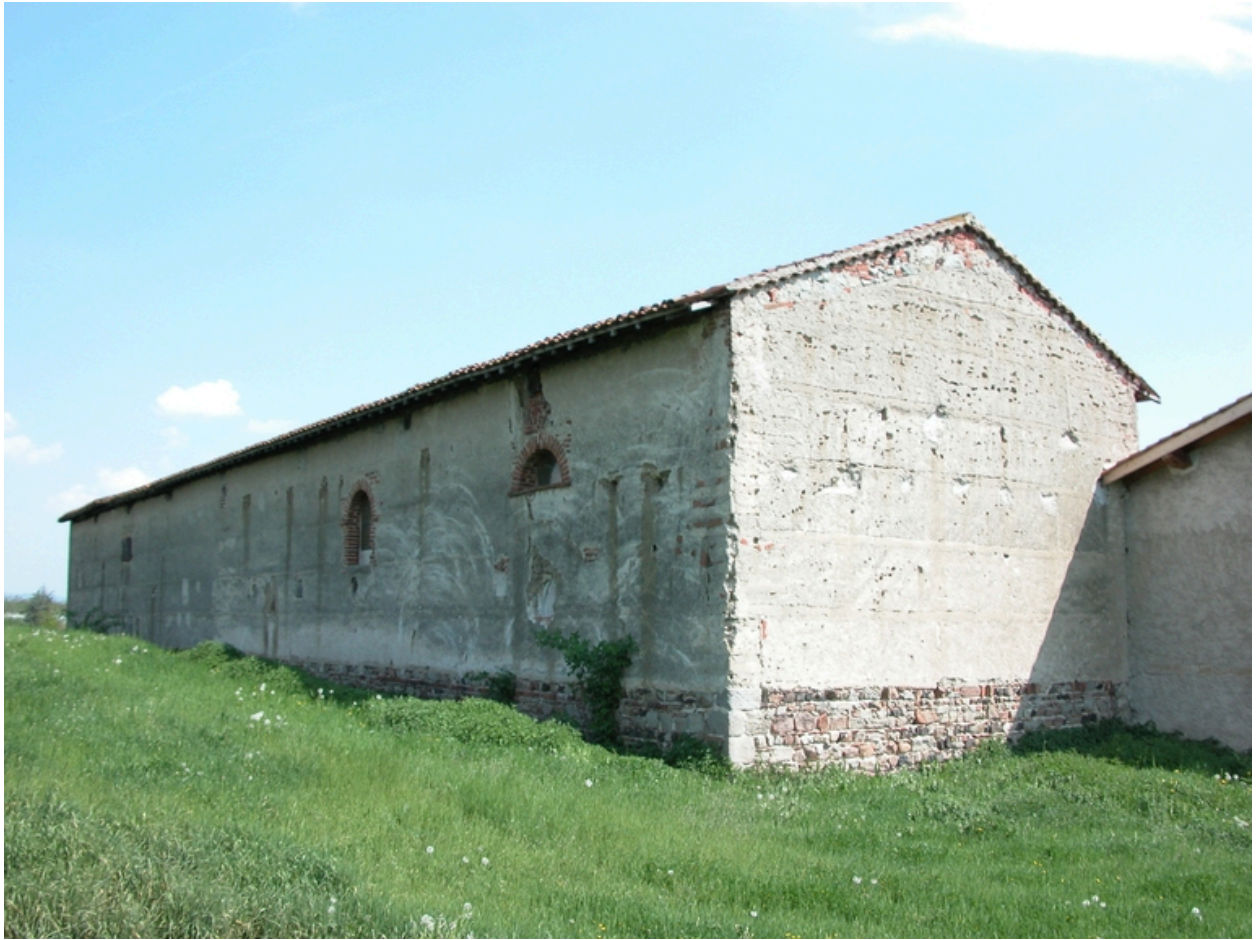
Vue arrière des granges-étables.