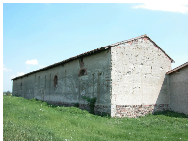
Vue arrière des granges-étables.