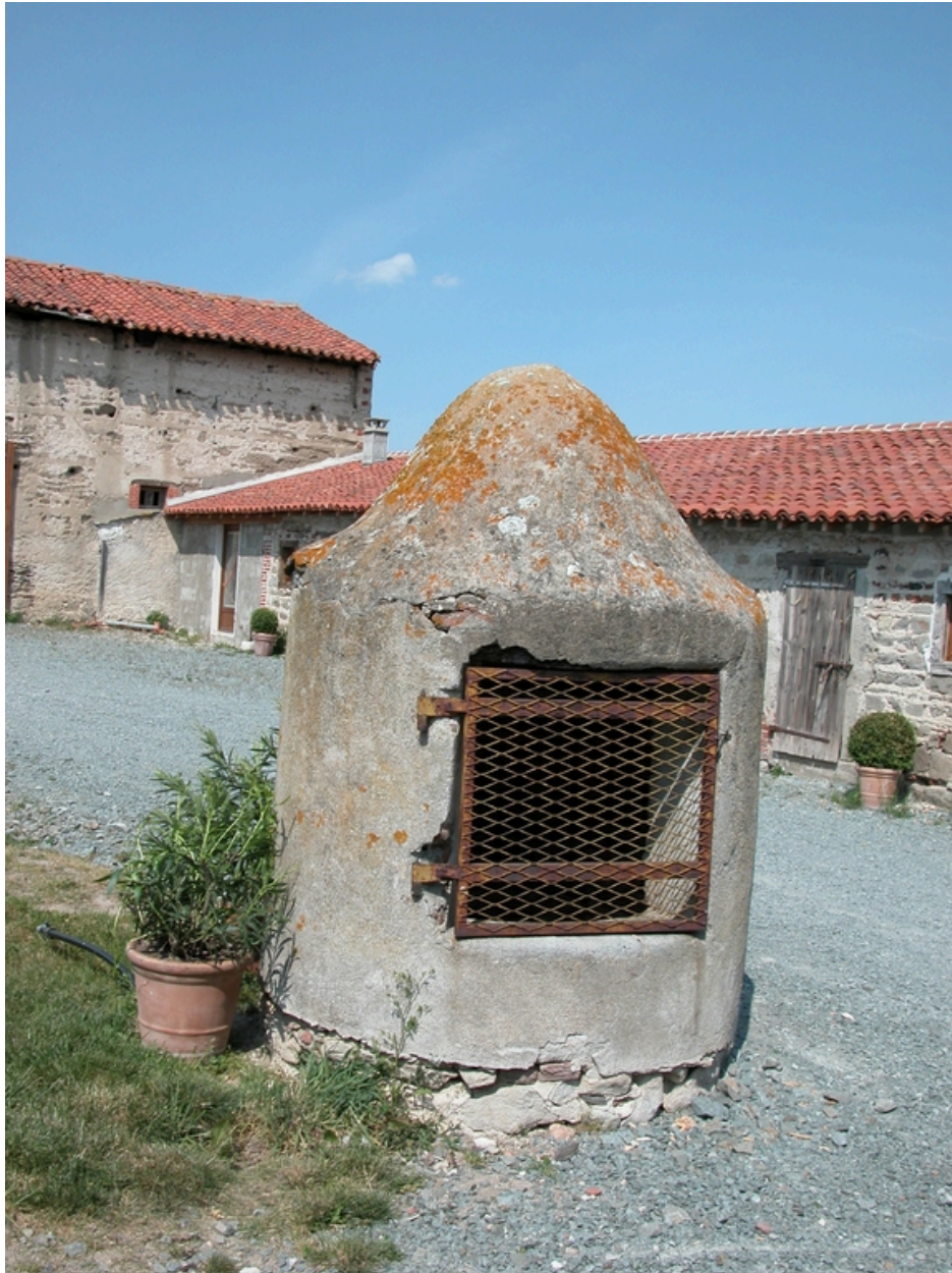
Vue du puits.