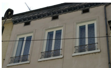
Le 2e étage et le comble à surcroît