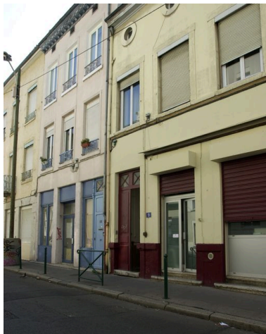
Elévation principale depuis le sud-ouest IVR82_20096901118NUCA