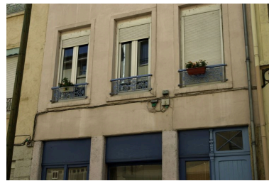
Le 1er étage IVR82_20096901119NUCA