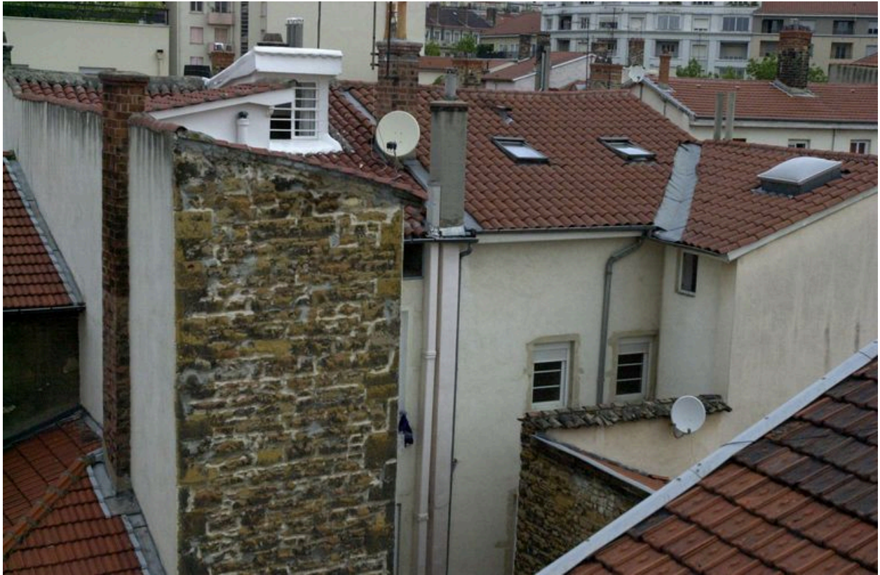
Vue d'ensemble depuis l'est : le corps de bâtiment en retour sur la cour