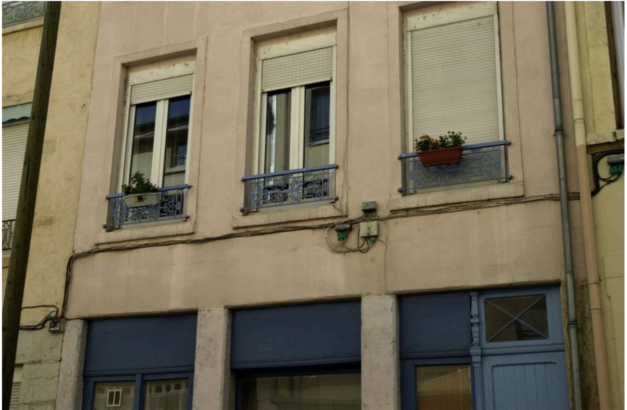
Le 1er étage