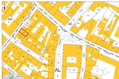
Plan masse et de situation, extrait de http://cadastre.gouv.fr IVR82_20136902463NUDA