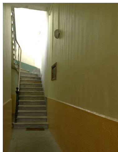
L'escalier IVR82_20096901122NUCA