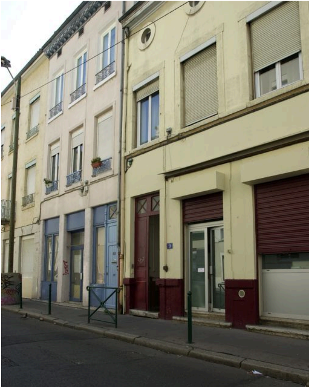
Elévation principale depuis le sud-ouest