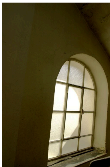
Baie éclairant l'escalier