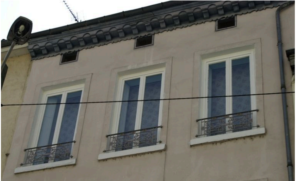
Le 2e étage et le comble à surcroît