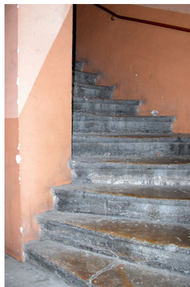
Départ de l'escalier IVR82_20046904133NUCA