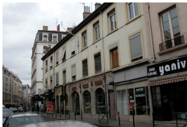
Vue générale de la façade sur rue IVR82_20046904132NUCA