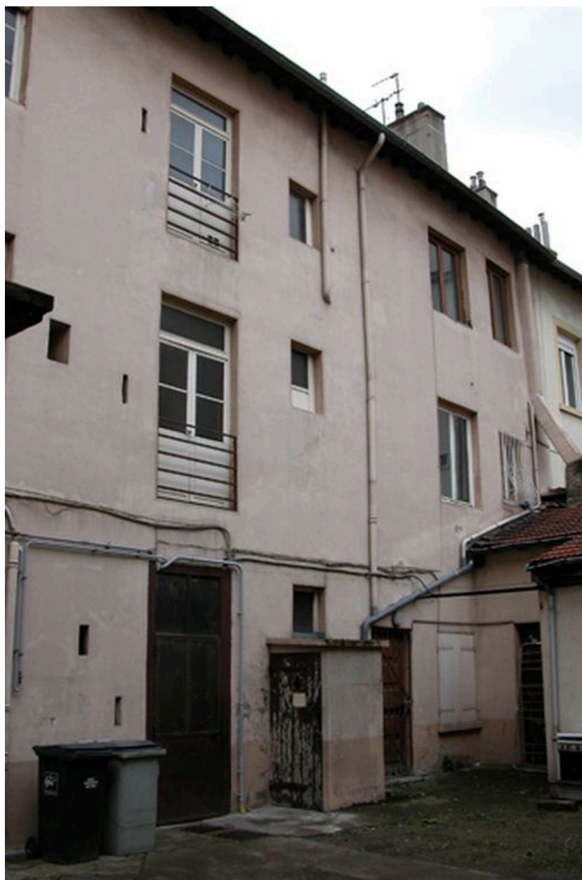
Elévation postérieure, partie ouest