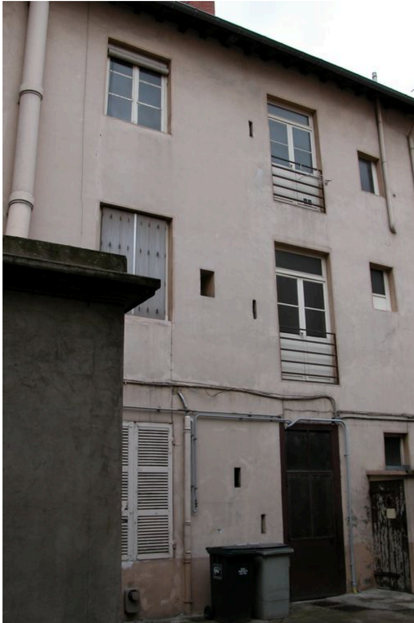
Elévation postérieure, partie est