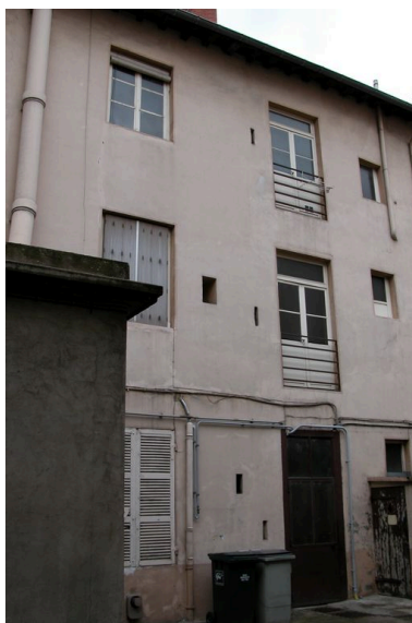
Elévation postérieure, partie est IVR82_20046904626NUCA