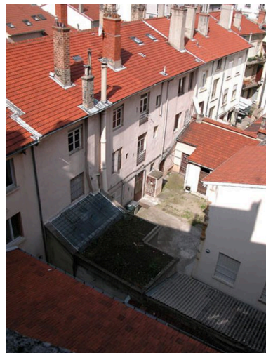
Elévation postérieure depuis un immeuble avenue Jean-Jaurès au nord-est