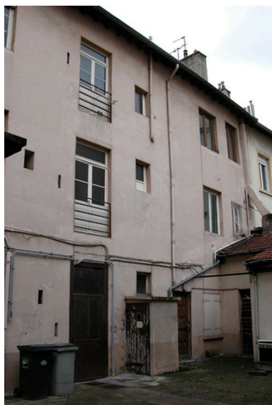
Elévation postérieure, partie ouest