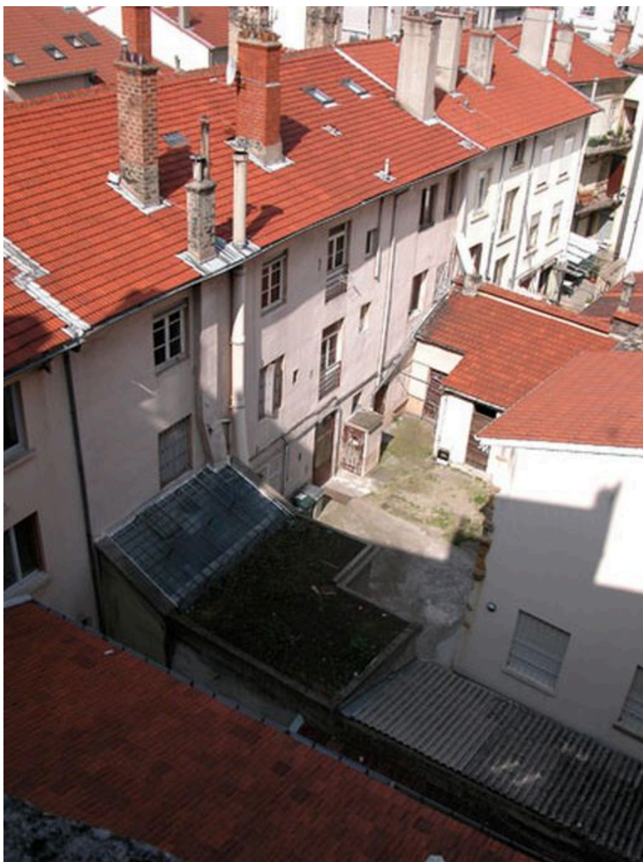
Elévation postérieure depuis un immeuble avenue Jean-Jaurès au nord-est