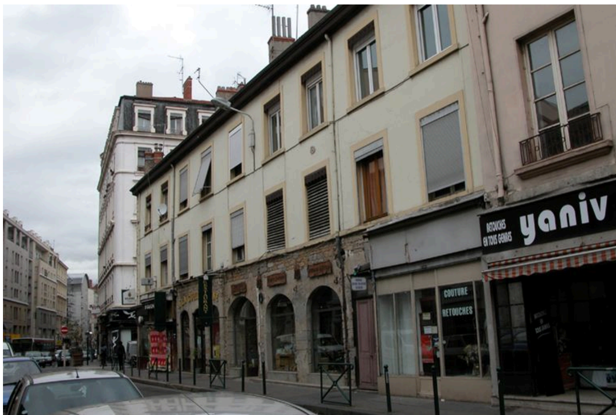
Vue générale de la façade sur rue