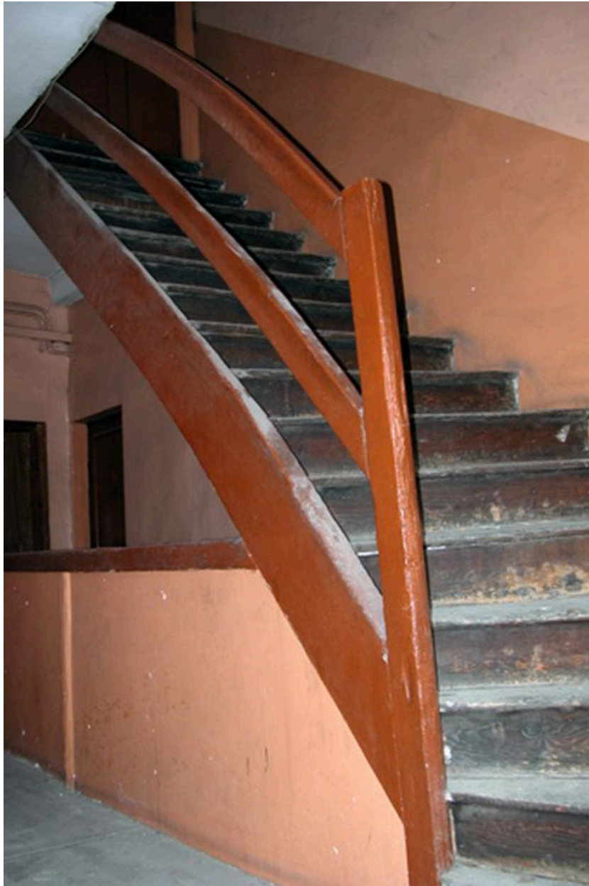
Vue de la montée d'escalier du dernier niveau