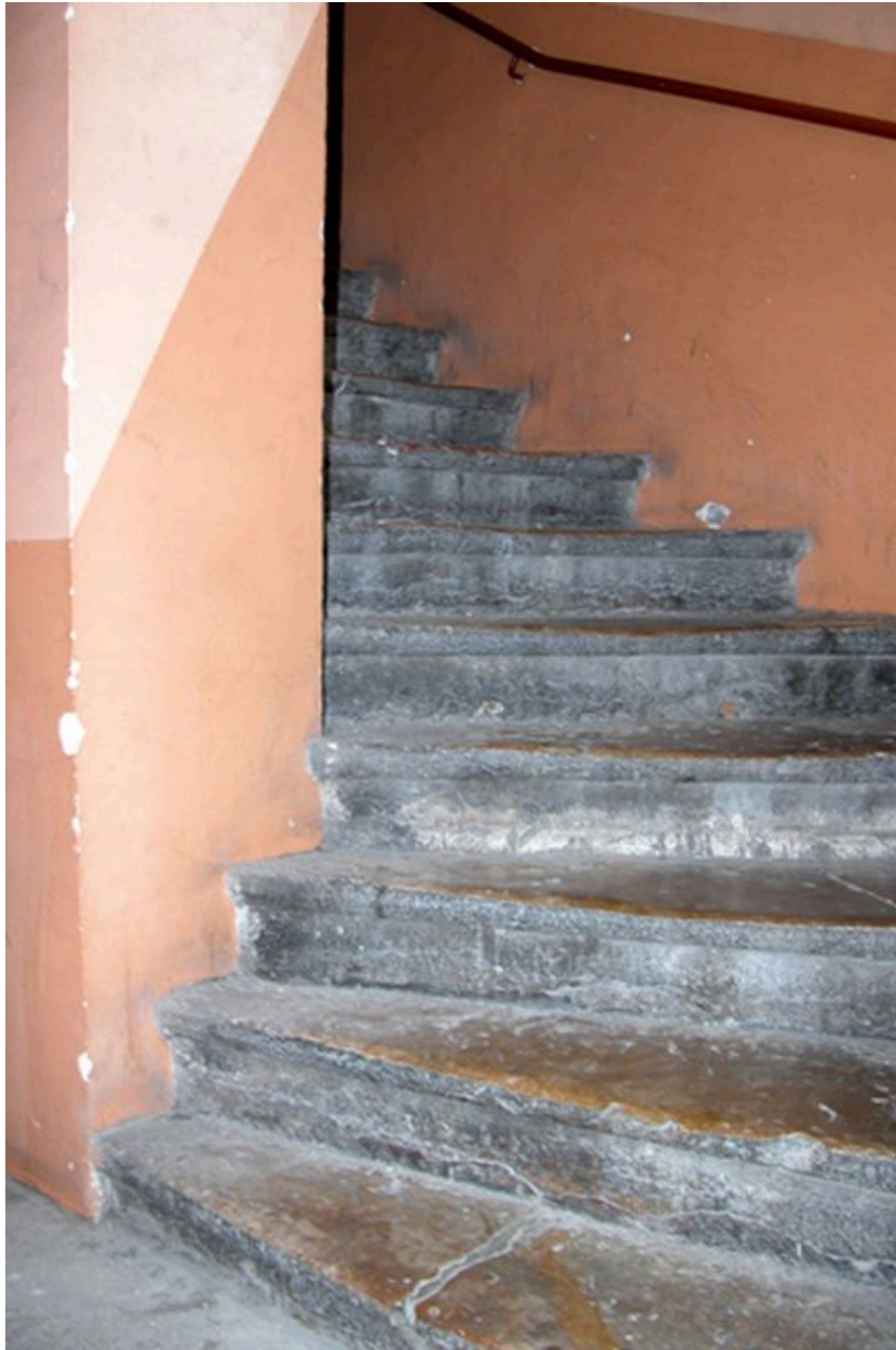
Départ de l'escalier