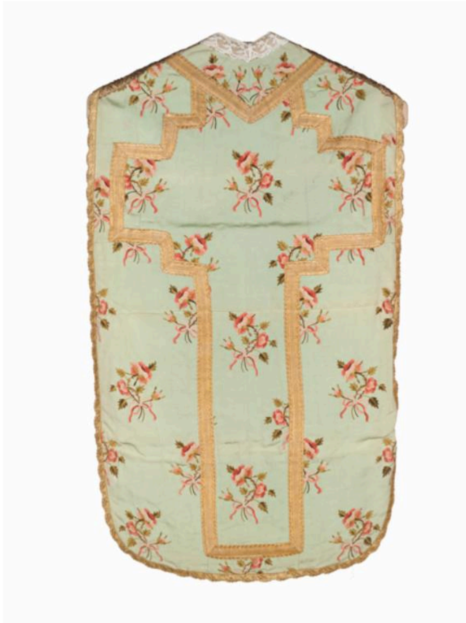
Vue générale du dos de le chasuble.