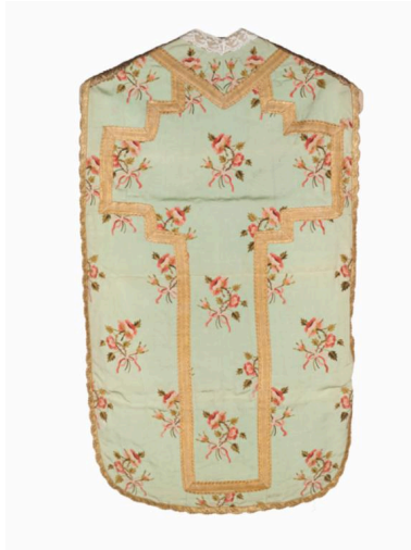
Vue générale du dos de le chasuble. IVR83_20146300676NUC4A