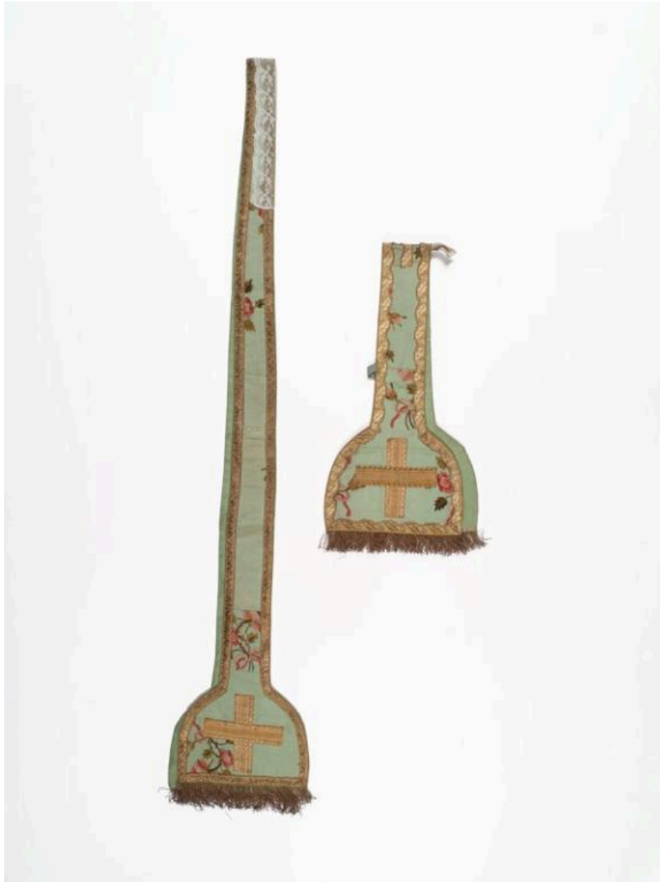
Vue générale de l'étole et du manipule.