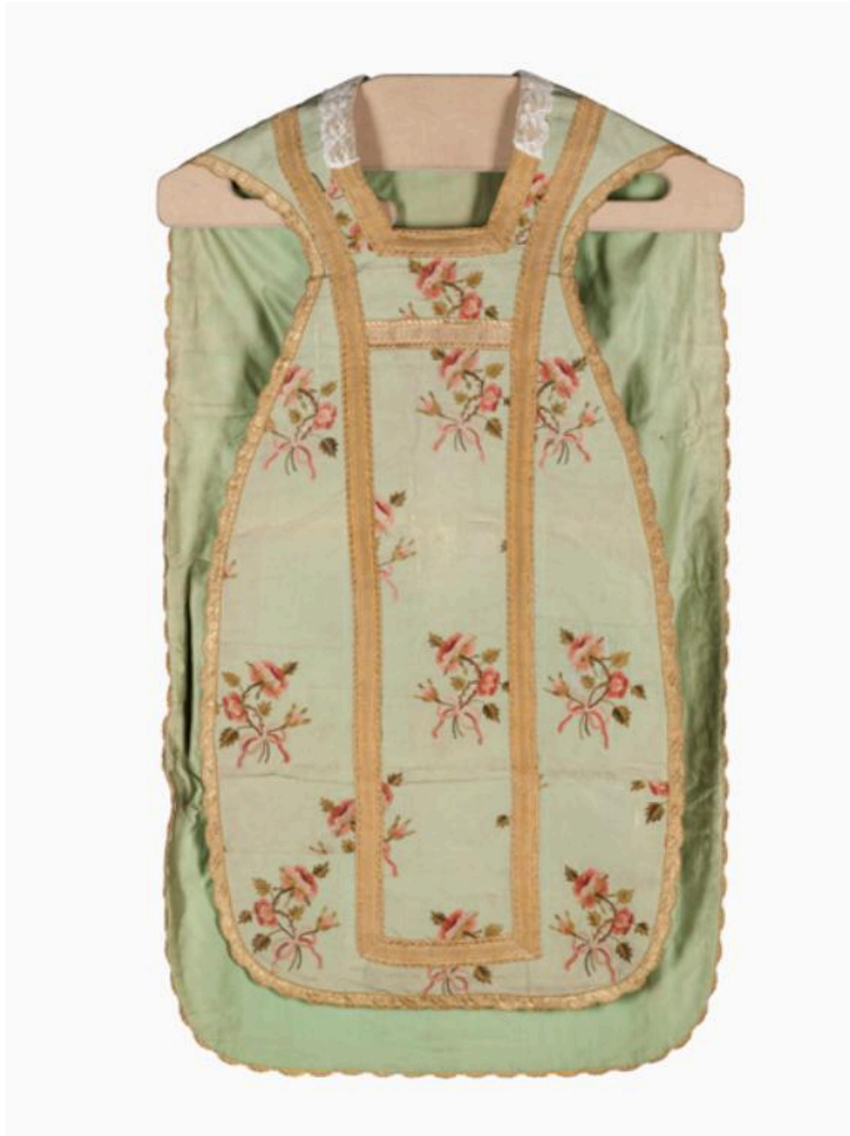
Vue générale du devant de la chasuble.