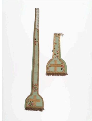
Vue générale de l'étole et du manipule.