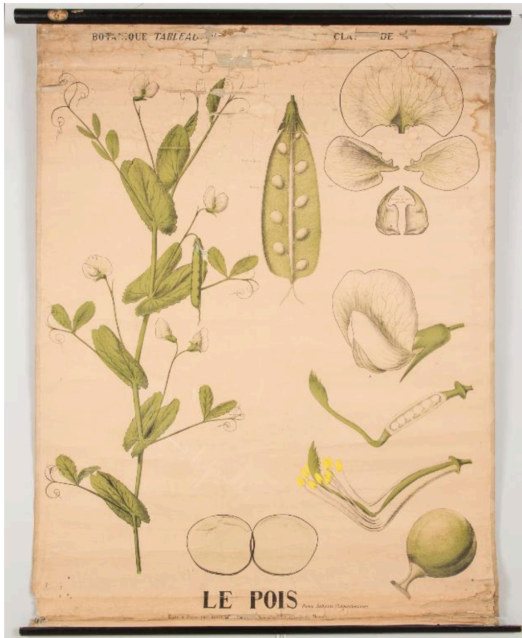
Carte de biologie scolaire. Le pois