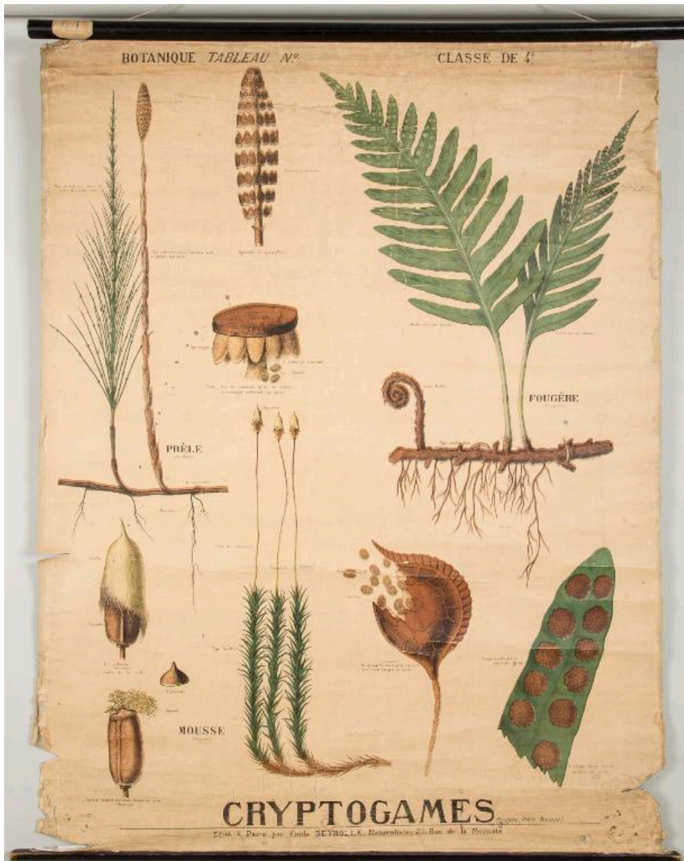
Carte de biologie scolaire. La fougère