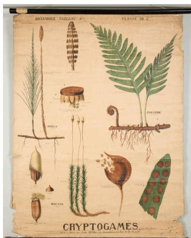
Carte de biologie scolaire. La fougère IVR82_20134202272NUCA