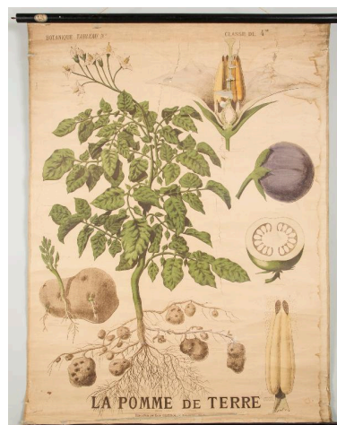
Carte de biologie scolaire. La pomme de terre