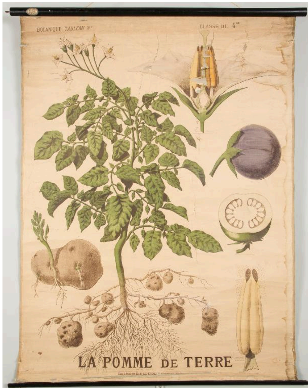
Carte de biologie scolaire. La pomme de terre