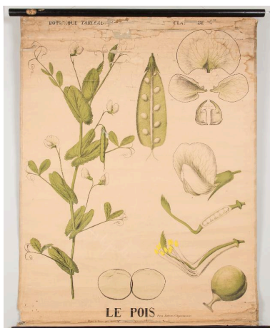
Carte de biologie scolaire. Le pois IVR82_20134202273NUCA