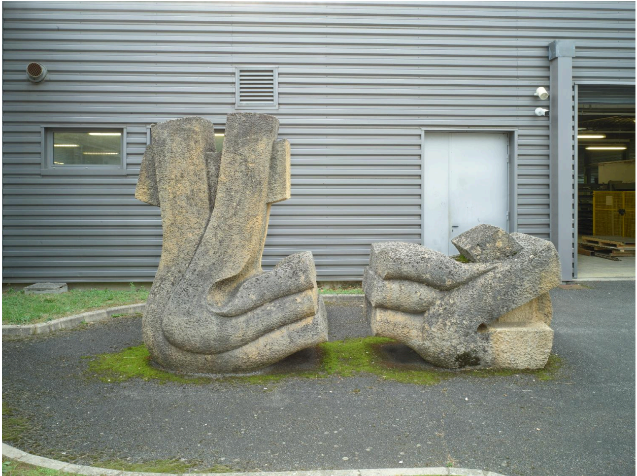
Vue de profil.