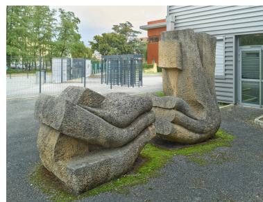
Vue d'ensemble de trois-quarts. IVR84_20204200179NUCA