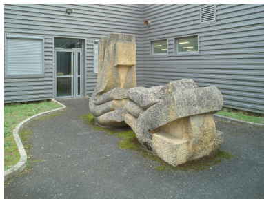
Vue de trois-quarts. IVR84_20204200183NUCA