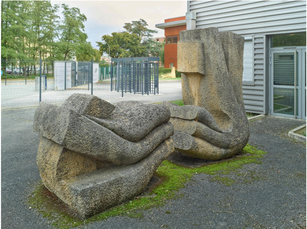
Vue d'ensemble de trois-quarts.