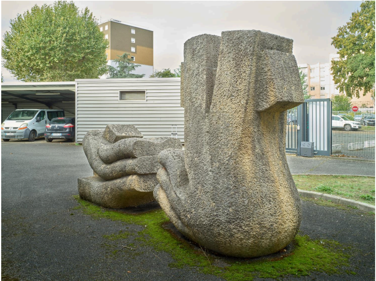
Vue de trois-quarts arrière.