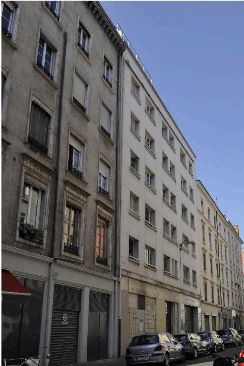
Vue d'ensemble de l'élévation sur rue