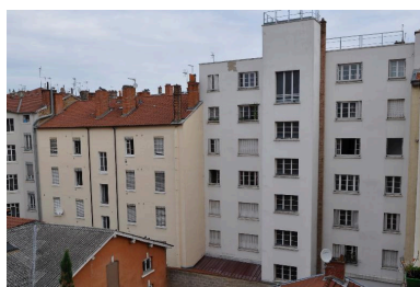
Vue générale de l'élévation sur cour (à droite) IVR82_20156901124NUCA