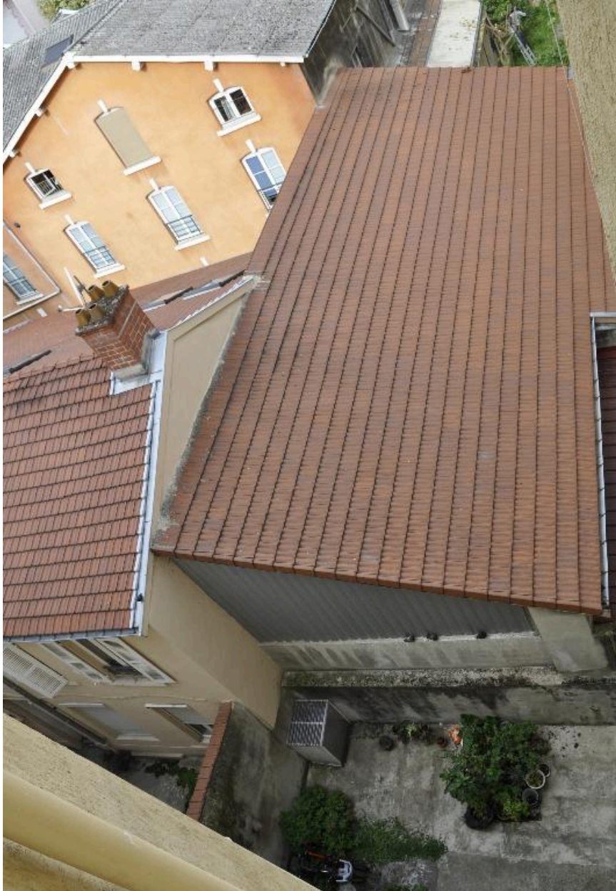
Bâtiment sur cour (entrepôt ?)