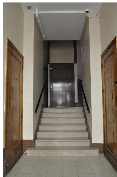
Vue intérieure : le vestibule et la volée d'escalier isolée joignant la tour d'escalier et d'ascenseur