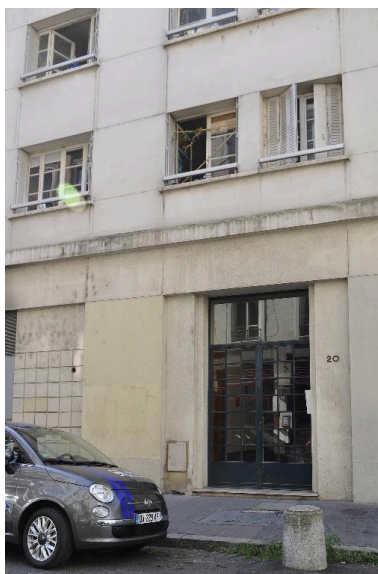
Vue rapprochée de la porte d'entrée