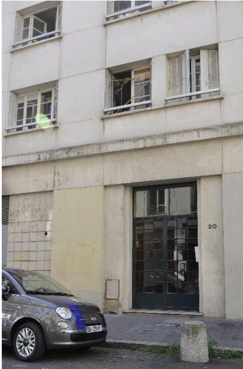
Vue rapprochée de la porte d'entrée