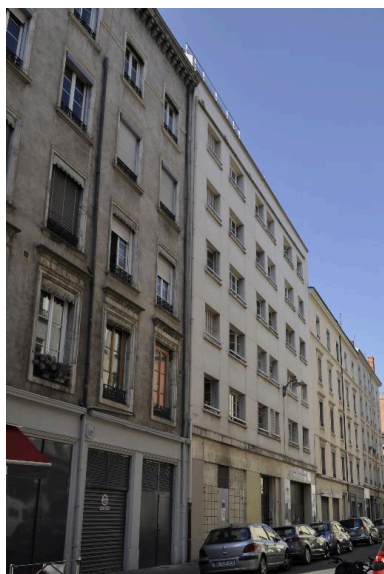
Vue d'ensemble de l'élévation sur rue IVR82_20156901128NUCA