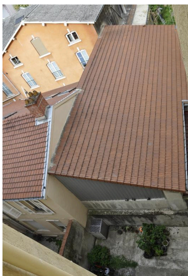
Bâtiment sur cour (entrepôt ?) IVR82_20156901133NUCA