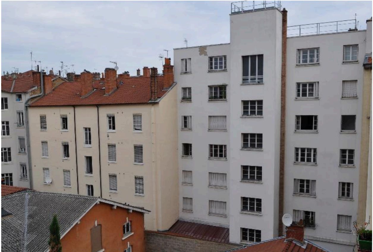
Vue générale de l'élévation sur cour (à droite)