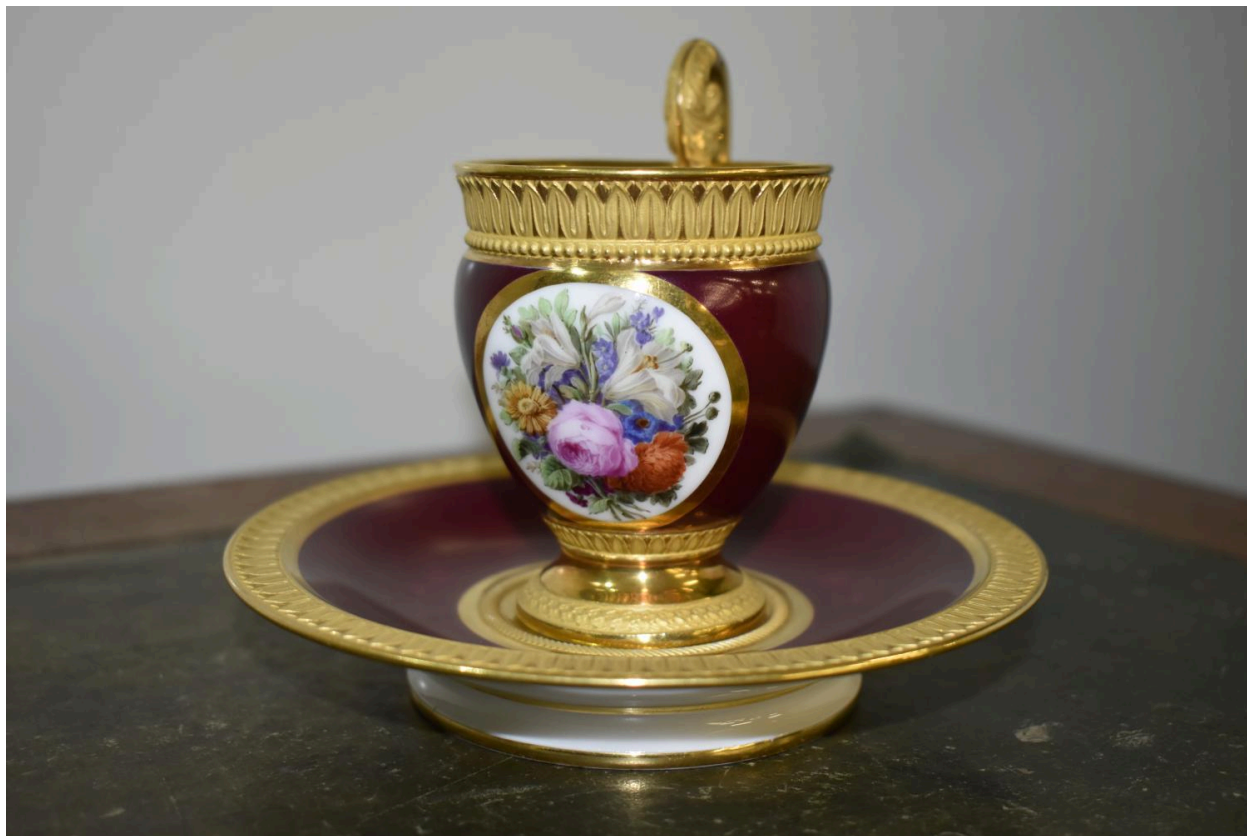
Vue de l'ensemble