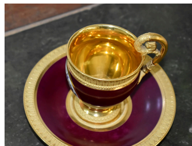
Vue de l'ensemble