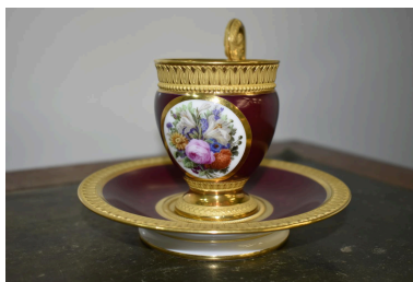
Vue de l'ensemble IVR84_20256300911NUCA