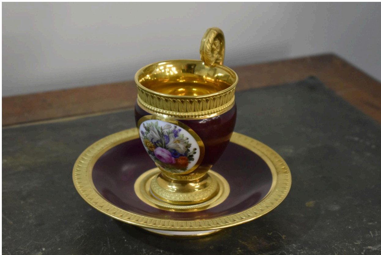
Vue de l'ensemble