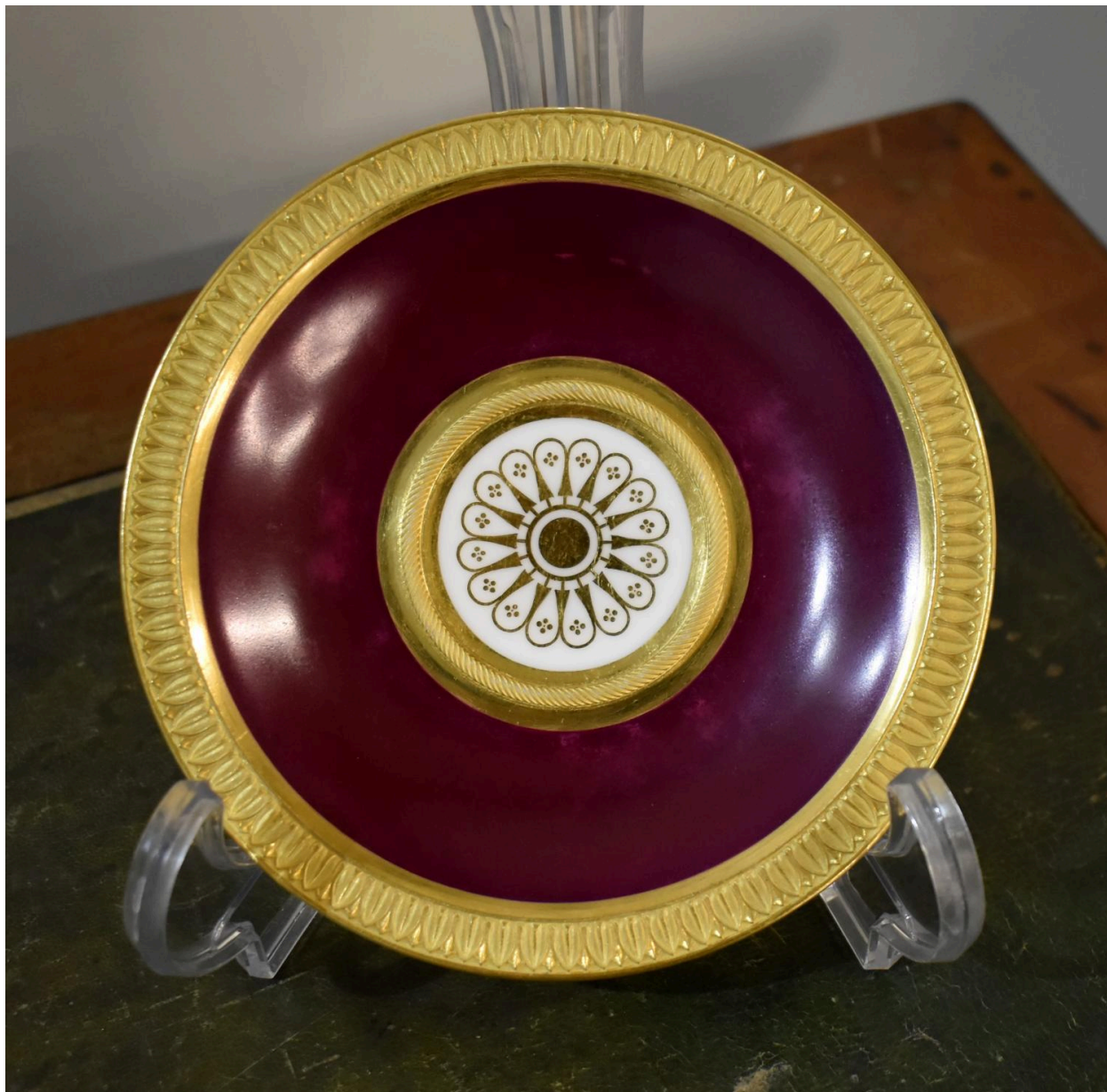
Vue de la soucoupe