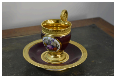
Vue de l'ensemble IVR84_20256300910NUCA