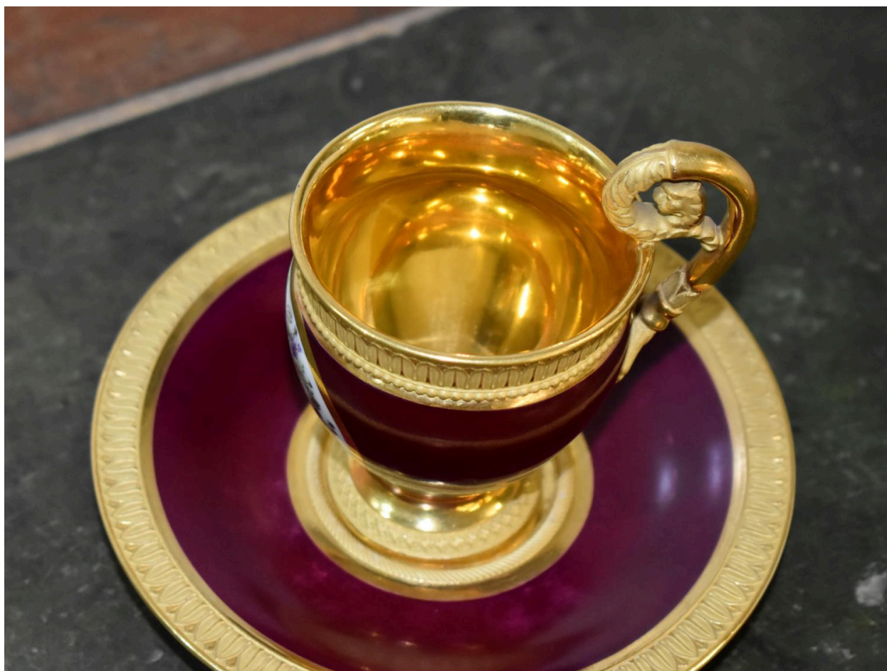
Vue de l'ensemble