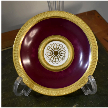
Vue de la soucoupe IVR84_20256300914NUCA