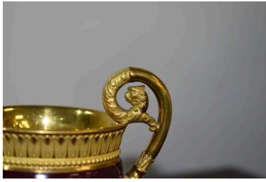
Détail de l'anse