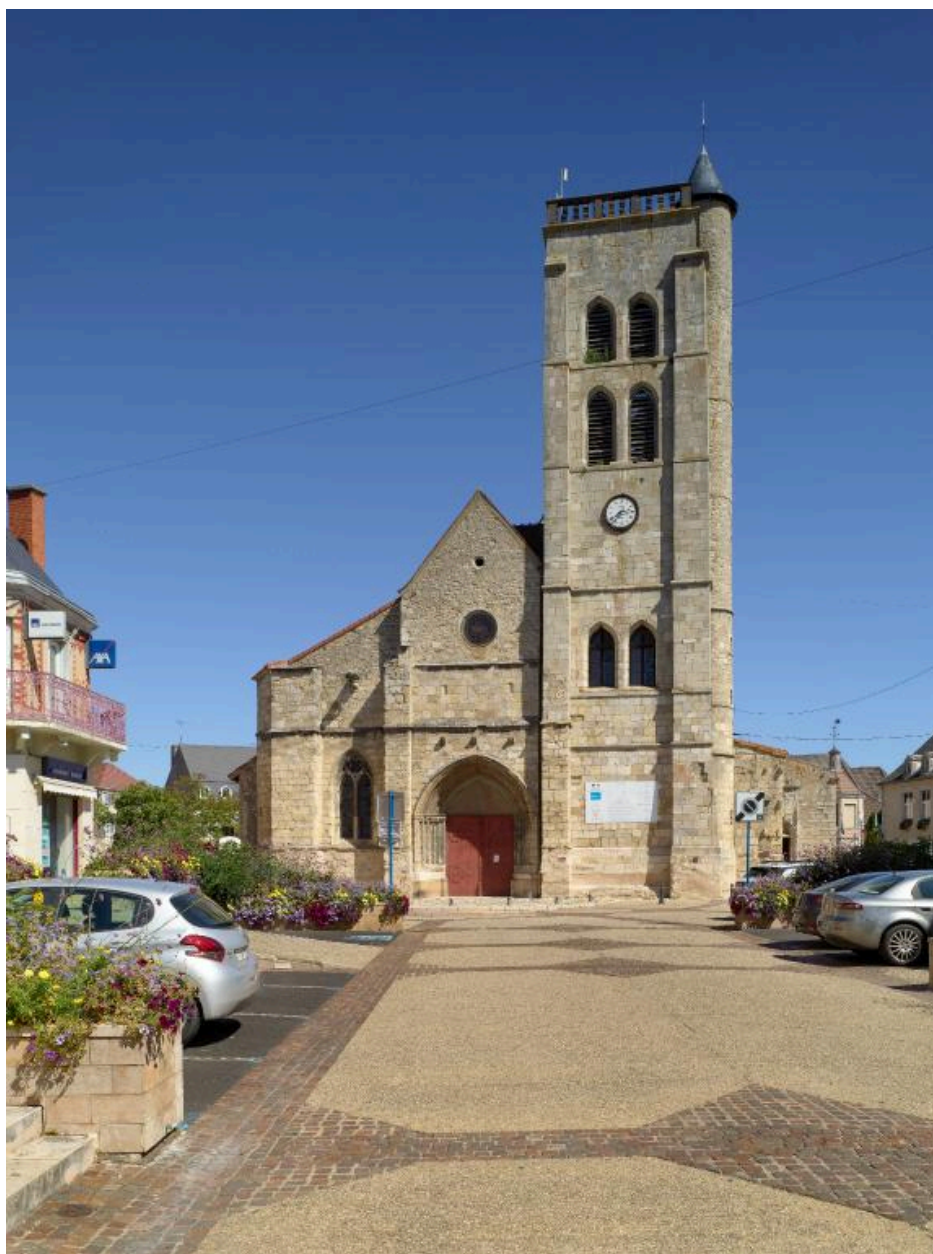
Vue générale de la façade occidentale