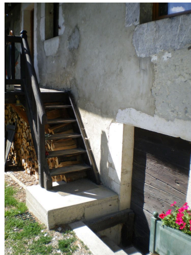
Vue de la porte de la cave. IVR82_20117400876NUCA