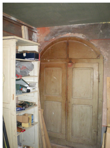
Vue de l'intérieur de l'ancienne boutique.