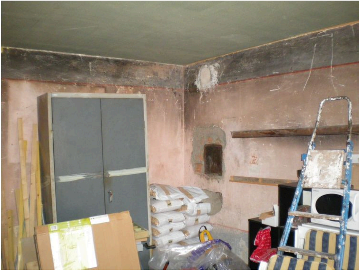
Vue intérieur de l'ancienne boutique.