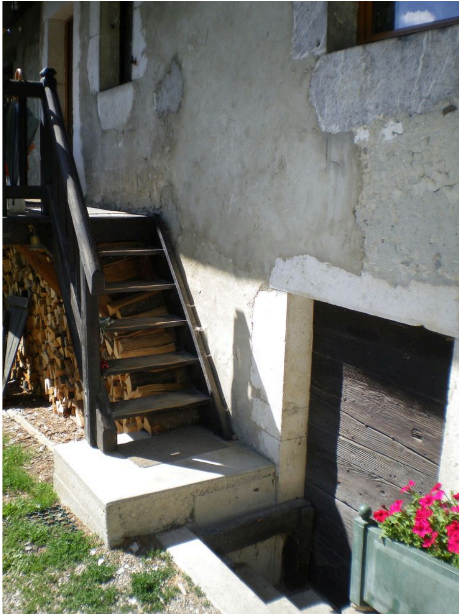
Vue de la porte de la cave.