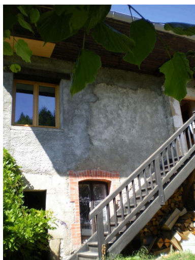
Vue de la porte et de la fenêtre de l'ancienne boutique.