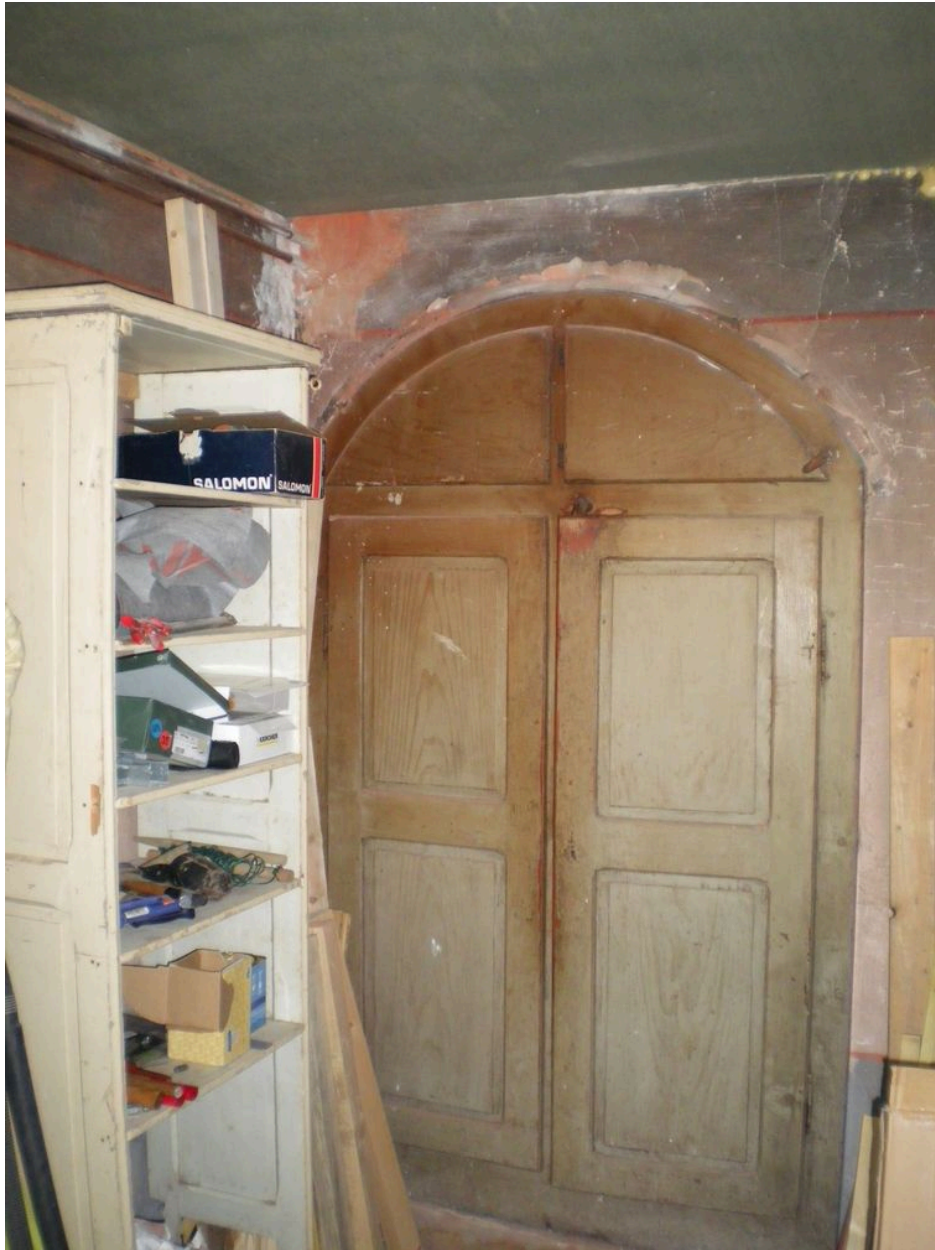
Vue de l'intérieur de l'ancienne boutique.