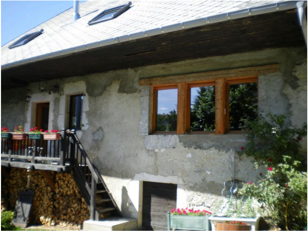
Vue de la façade sud avec la fenêtre agrandie.