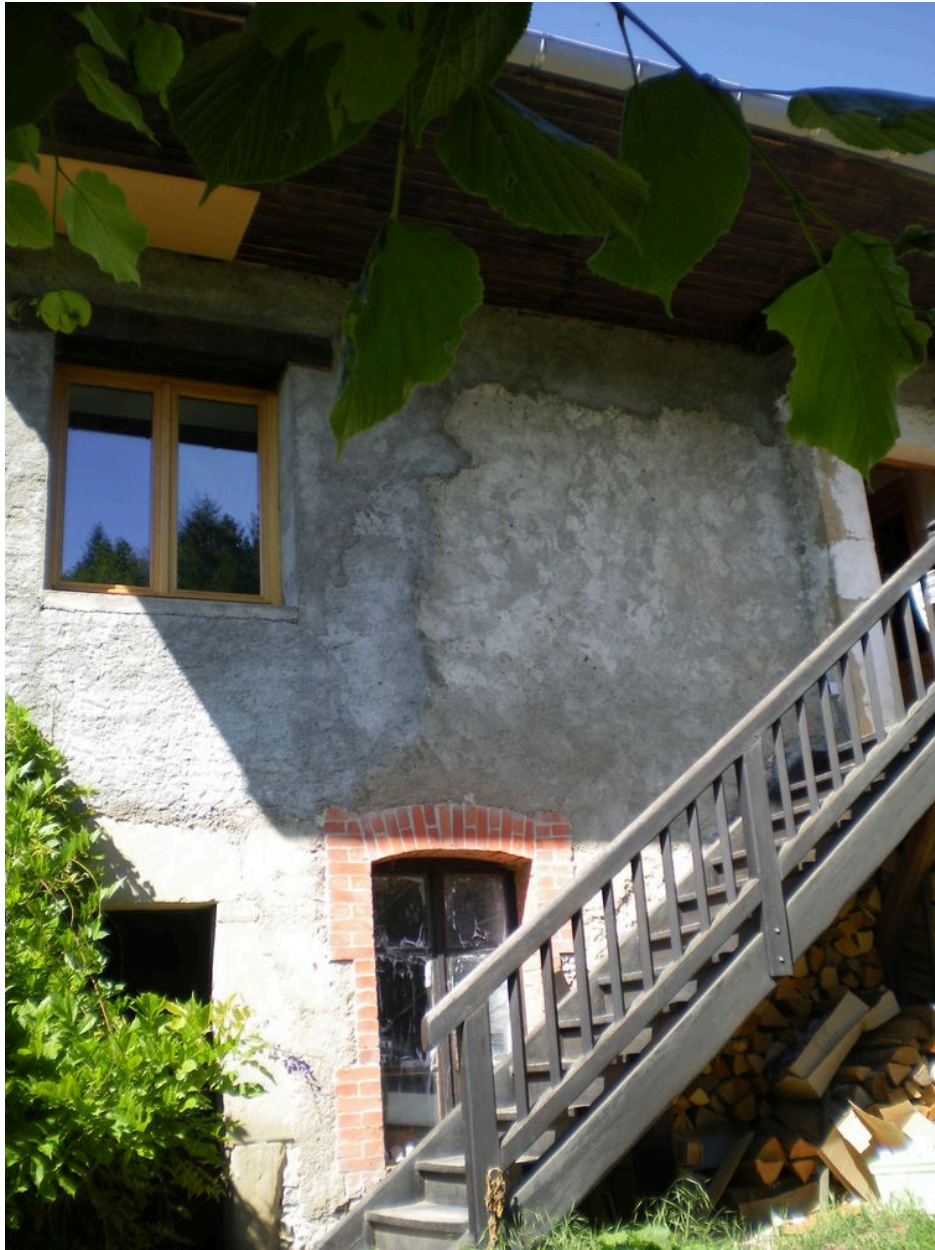
Vue de la porte et de la fenêtre de l'ancienne boutique.