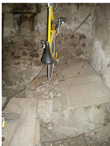
Vue des restes d'un puits comblé dans une pièce donnant au nord.