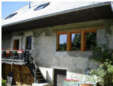
Vue de la façade sud avec la fenêtre agrandie.