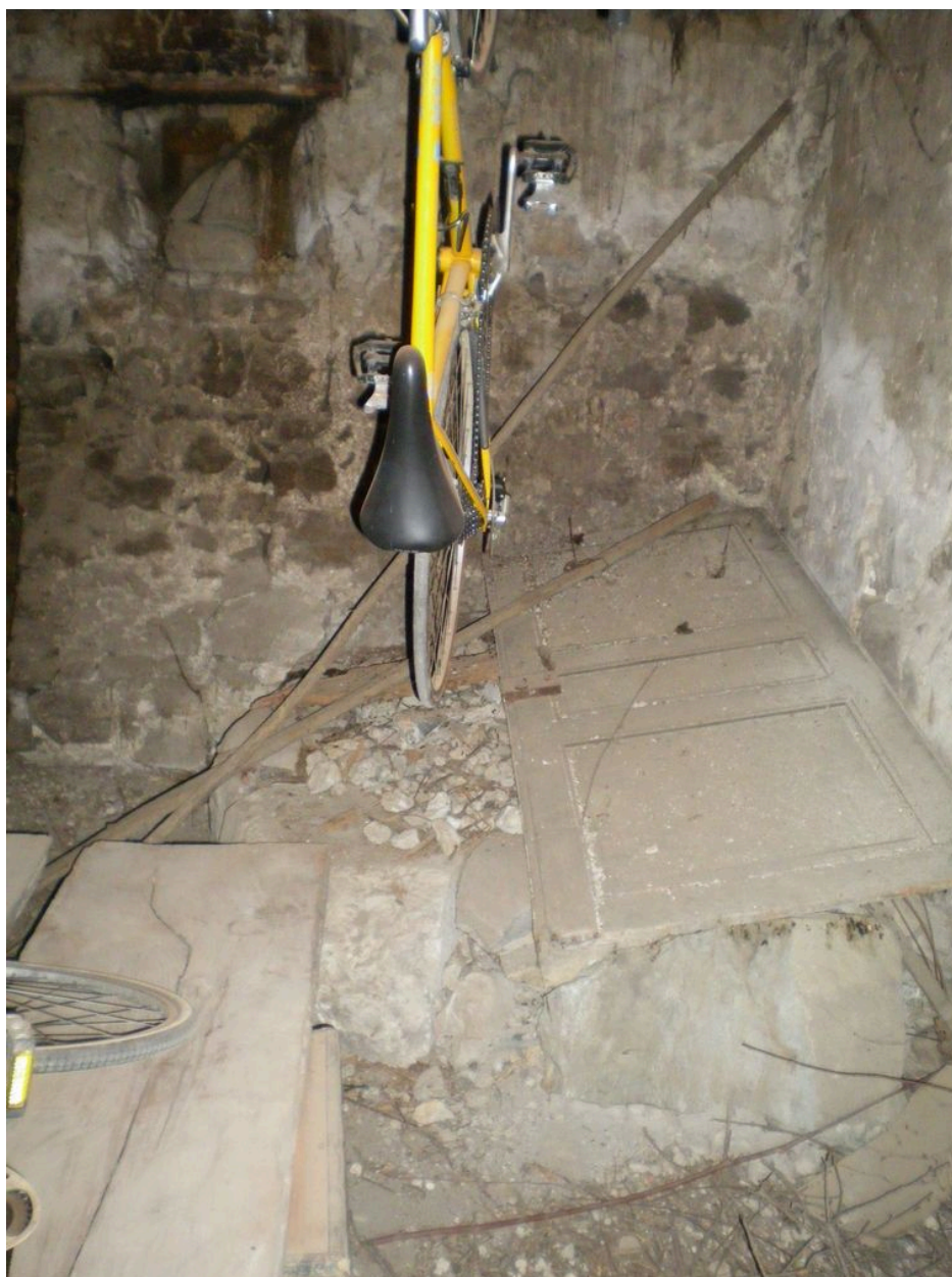
Vue des restes d'un puits comblé dans une pièce donnant au nord.