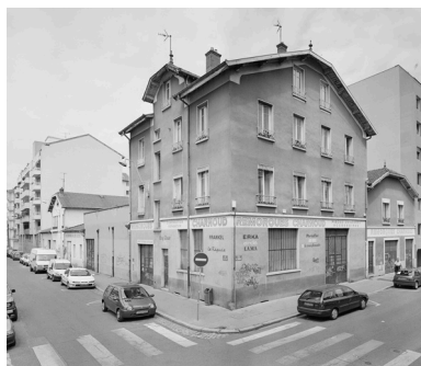
Vue générale sud-ouest du site