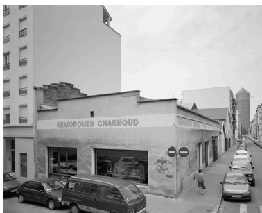
Vue sud-est, extension 1907.