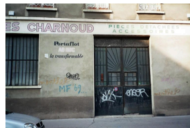
Détail portail entrée