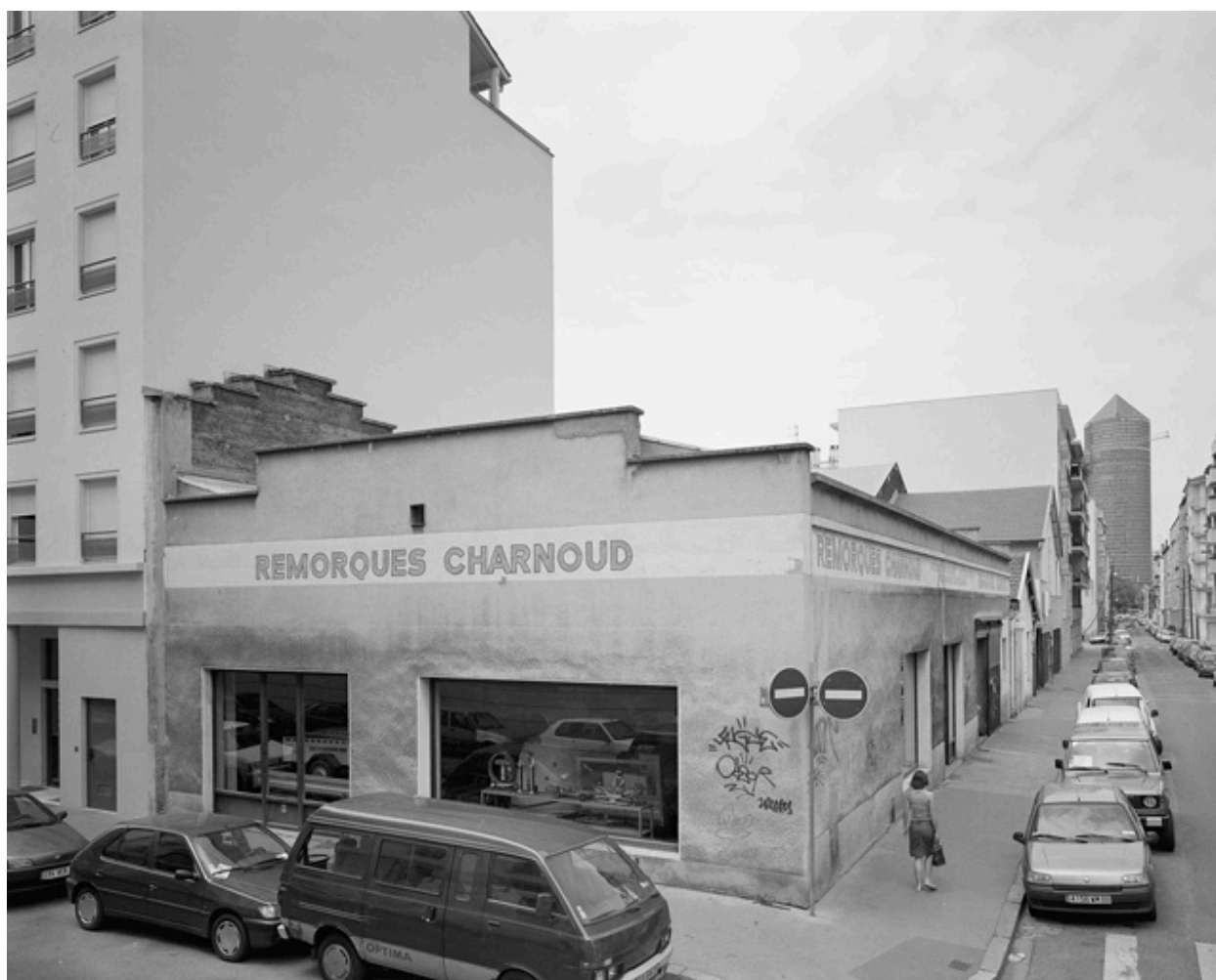
Vue sud-est, extension 1907.