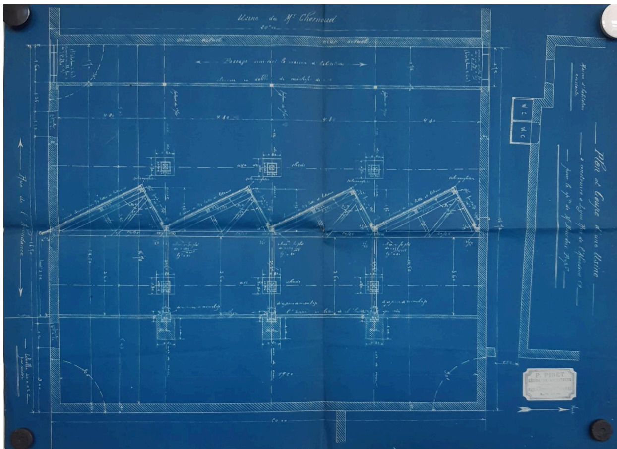
Plan extension usine 1907