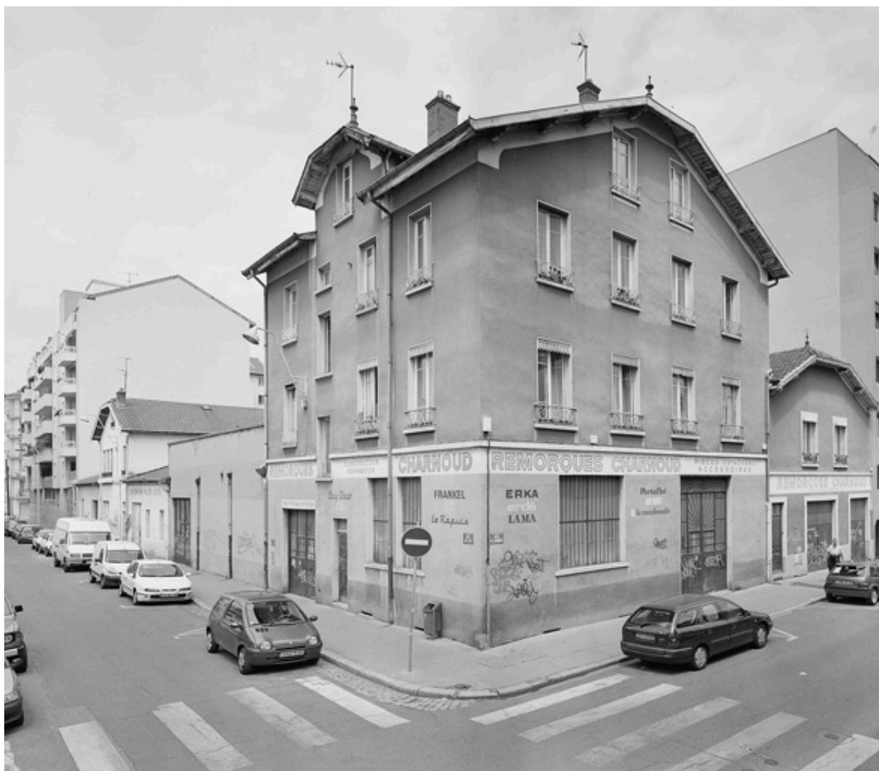
Vue générale sud-ouest du site