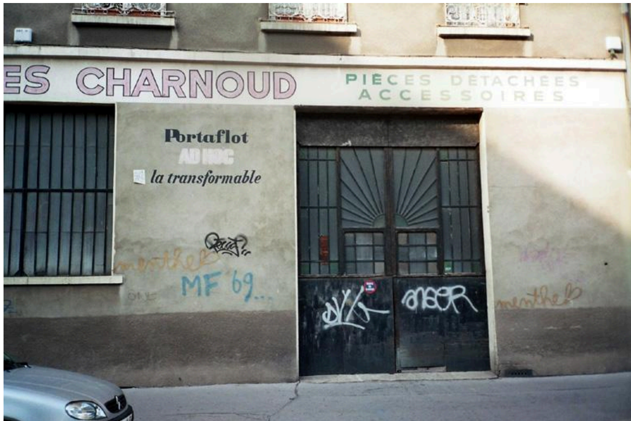
Détail portail entrée