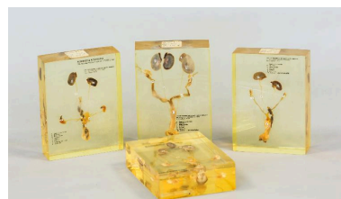
Ets Sciences et Pédagogie : inclusions IVR82_20140700155NUCA