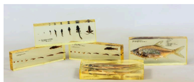
Ets Sciences et Pédagogie : inclusions