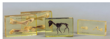
Ets Sciences et Pédagogie : inclusions