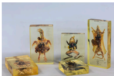
Ets Sciences et Pédagogie : inclusions IVR82_20140700153NUCA