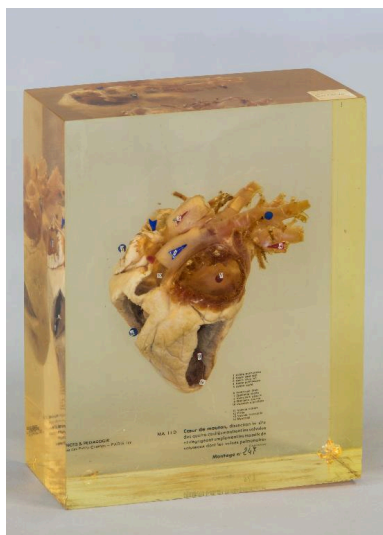
Ets Sciences et Pédagogie : inclusions IVR82_20140700156NUCA