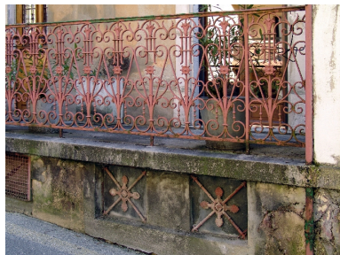
Détail du garde-corps