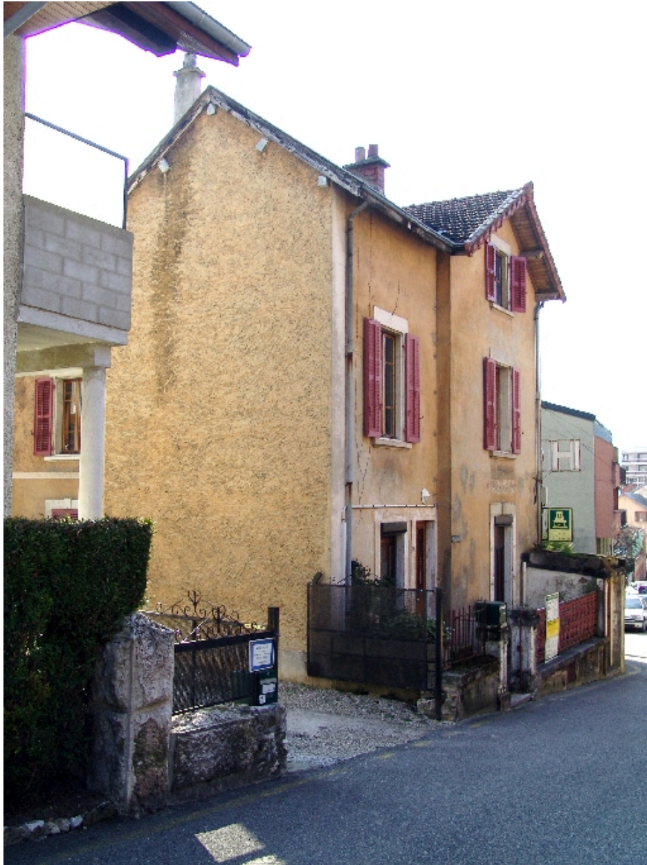
Vue de trois-quart gauche