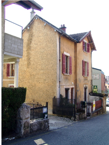
Vue de trois-quart gauche IVR82_20097300488NUCA