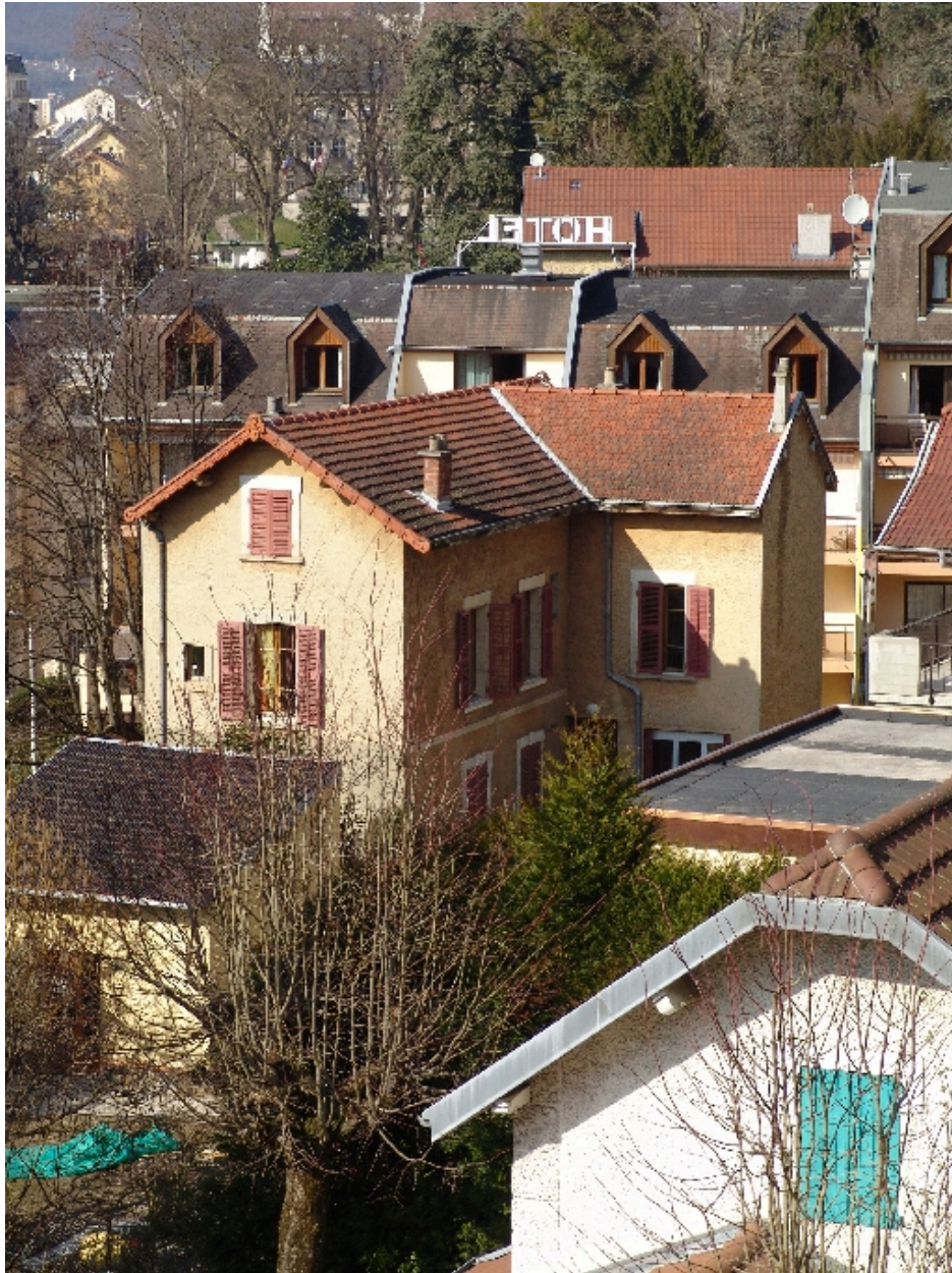
Vue depuis l'arrière