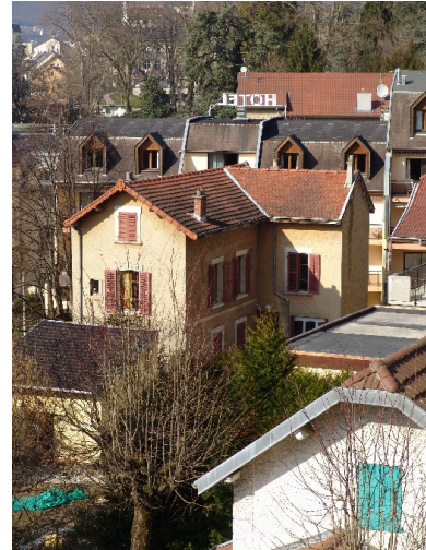
Vue depuis l'arrière IVR82_20097300487NUCA