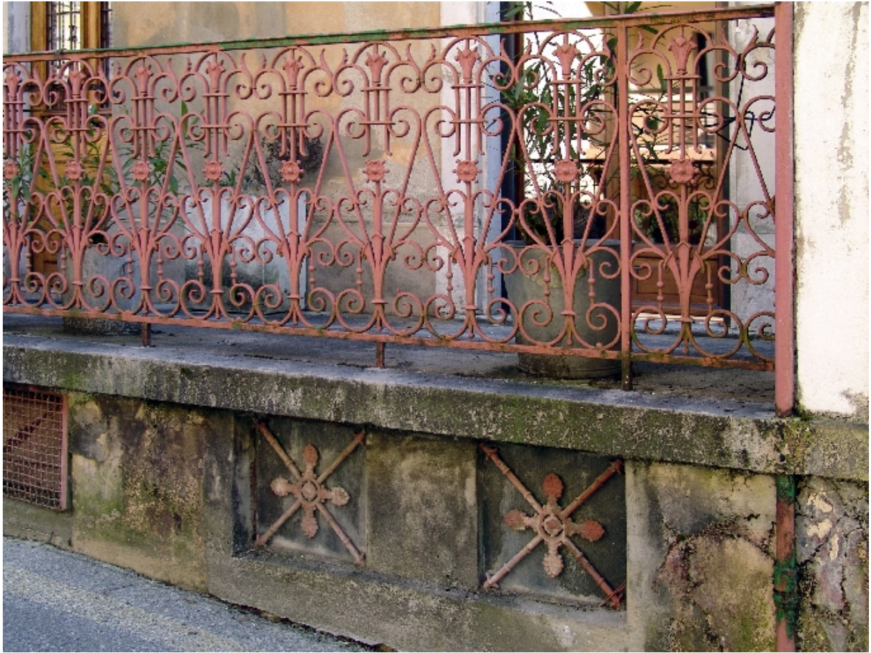
Détail du garde-corps