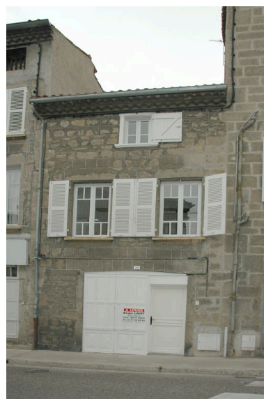
Vue générale IVR82_20124201293NUCA