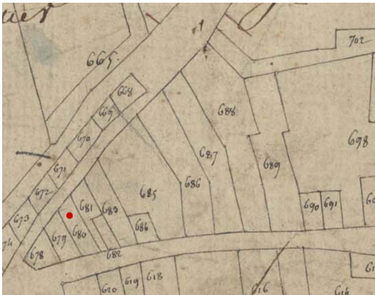
Plan de situation, extrait du cadastre de 1809, parcelle E 680 (partie est).