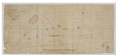
Plan des maisons et jardins, rue Simon Boyer en 1777. Plan, 1777 B Diana Montbrison. C géo 149 (1)