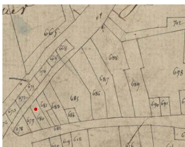
Plan de situation, extrait du cadastre de 1809, parcelle E 680 (partie est). IVR82_20124201304NUD